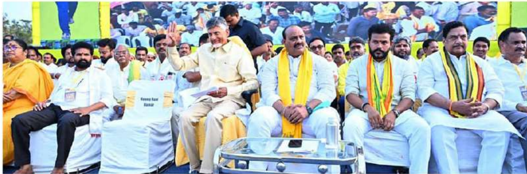
(1వ వేళ తరువాత)

భోగాపురం విమానాశ్రయం, భావనపాడు పోర్టు పూర్తయ్యింది. భావనపాడుకి జగన్ రెండోసారి శంకు స్థాపన చేసి మూలపాదని పేరు మార్చాడు. విశాఖ నుంచి లూలా వంటి పలు కంపెనీలు, మెట్రో ప్రాజెక్టు పారటోయాయి. రైల్వేజోన్లకు భూములు ఇవ్వలేదు. నేను శంకుస్థాపన చేసిన ట్రైబల్ యూనివర్సిటీని పూర్తి చేయలేకపోయాను. స్ట్రీట్లైట్ల వైద్యకరణకు వ్యతిరేకంగా ఒక్క మాట కూడా మాట్లాడలేకపోయాను. ఏటవైతీ వల్ల ఆశ్రయద్రలకు ఉద్యోగాలు రాకుండా చేశారని చంద్రబాబు మండిపడ్డారు.