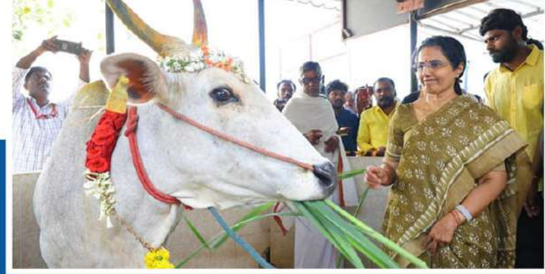
గోపాలన, పోషణ, రక్షణ వేతనమున్నది సూచక. అత్యంత భక్తి ప్రధానతో గోవుని పూజించటం మన సంప్రదాయం. తూర్పు అరిష్టము గోమాత ప్రత్యాది అంభసంతానాలు. రెండు కోంక్వి మనసులో అనుభవ గోవుల గమనమున్న -ఆ రెండు కోంశలనా గోమాత కిరుస్తుందని హిందూ సంప్రదాయం నమ్మకం. ఇద్దవులు చందిస్తున్న భువనము ఏం కోలుకుని ఉంటుంది. నిజం గెలవని పట్టుకలలో భాగంగా -సుక్ష్మవారం కాసెటికం అంబరయస్విమని దర్శించుకున్న భువనము. అక్కడ గోపాలలో గోసిన చేస్తున్న దృక్పథం.