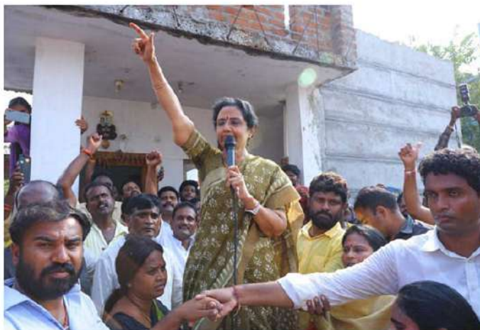
మాట్లాడుతూ... తెలుగుదేశం పార్టీ కార్యకర్తలు, నాయకులు, ప్రజలు, చంద్రబాబును వైసీపీ ప్రభుత్వం