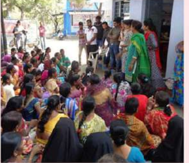
ఎన్నికల హామీ మేరకు ప్రతి మహిళకు రూ.3 వేల పెన్షన్ లభింకూపూ ఏడాదికి రూ.36 వేలు. అదేట్లలో రూ.1.8 లక్షలు ఇస్తామని. కానీ అదేట్లలో రూ.75 వేలు ఇస్తామని మదమ తిప్పడంతో ఒక్కో మహిళకు రూ.1.05 లక్షల చొప్పున ఏగనామం పెట్టారు. 45 ఏళ్ల దానిన మహిళలకు రూ.18,750 చొప్పున ఆర్థిక సాయం చేస్తున్నారంటూ.. మహిళల సంక్షేమంలోనూ జగన్ రెడ్డి చేతివాటం ప్రదర్శించాడు.

అక్కచెల్లెమ్మలను పక్కాగా ముంచిన జగన్ రెడ్డి ఆర్థికసాయం ముసుగులో నమ్మక ధ్రోహం 45ఏళ్ల దానిన మహిళలకు రూ. 3వేల హామీ సాయం చేయకుండానే చేసినట్లు పబ్లిసిటీ