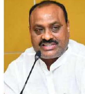
బస్సులు, జనవరి 27 న టీఎంఐ సభకు వెయ్యి బస్సులు మళ్లించారు. పెద్దఎత్తున ఆర్టీసీ బస్సులు తరలించడంతో సామాన్య ప్రజలు, ప్రయాణికులు అనేక ఇబ్బందులు ఎదురవుతున్నారు. ఇది పెద్దక్షణ సీఎస్

అమరావతి: ముఖ్యమంత్రి సిద్ధం సభలకు పెద్ద సంఖ్యలో ఆర్టీసీ బస్సులను తరలిస్తుండటంతో సామాన్య ప్రజలు, విద్యార్థులు ఇబ్బందులకు గురవుతున్నారని టీడీపీ రాష్ట్ర అధ్యక్షుడు కింజరాపు అచ్చెన్నాయుడు విమర్శించారు. ప్రజలు, విద్యార్థుల ఇబ్బందులను దృష్టికో పెట్టుకుని జగన్ సభలకు ఆర్టీసీ బస్సులు తరలింపకుండా ఆదేశాలు జారీ చేయాలంటూ రాష్ట్ర ప్రభుత్వ ప్రధాన కార్యదర్శి (సీఎస్ కు) అచ్చెన్నాయుడు లేఖ రాశారు. గత కొన్ని వారాలుగా వైకాపా నిర్వహిస్తున్న సిద్ధం సభలకు పెద్ద సంఖ్యలో ఆర్టీసీ బస్సులు తరలిస్తున్నారు. ఈ నెల 18న రాష్ట్రంలో జరిగిన సిద్ధం సభకు రాధాపు 3 వేల ఆర్టీసీ బస్సులు, 3 వ డెండరులూరు సభకు 1200