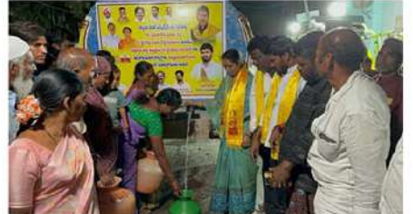
పాణ్యం (వైతన్యరథం): వేసవి కాలం రాక మునుపే చాలా గ్రామాల్లో ప్రజలు దాచుకోవడానికి అర్హమైన నీటి కోసం పడదాని

సాంత నిధులతో నీళ్ల ట్యాంకర్లు ఏర్పాటు చేసిన గౌరు చరిత రెడ్డి