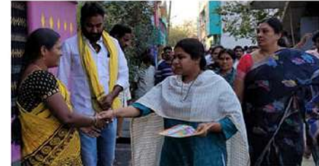
పార్టీకారని, అలాంటి పిచ్చి తుగ్లక్ కు ఓటుతోనే బుద్ధి చెప్పాలని భూమా అఖిలప్రియ ప్రజలకు పిలుపునిచ్చారు.

ఆళ్లగడ్డ (వైతన్యరథం): డి.బి.కె.లో ప్రజల భవిష్యత్తు, రాష్ట్రాభివృద్ధి సాధ్యమని నమ్మిన ప్రజలు పార్టీ వైపునకు తాకింపులవడం అభినందనీయమని మాజీమంత్రి భూమా అఖిలప్రియ వ్యాఖ్యానించారు. శుక్రవారం బాబు షూరిటీ - భవిష్యత్తుకు గ్యారెంట్ కార్యక్రమంలో భాగంగా ఆళ్లగడ్డ పట్టణంలోని పాలసాగరం రోడ్, కర్ణమయ్య ఏడ లలో అమె ఇంటింటి ప్రచారం చేపట్టారు. ఈ సందర్భంగా డి.బి.కె మిసి మేనిఫెస్టోలో ఇచ్చిన సూపర్ సిక్స్ పథకాలను ప్రజలకు వివరించారు. డి.బి.కె ప్రభుత్వం ఏర్పాటు కాగానే ఇంటింటికి కొండా మేయిస్ట్రేషన్, ప్రతి ఇంటికి అన్ని సంక్షేమ పథకాలు అందుతాయని భరోసా ఇచ్చారు. మహాశక్తి పేరుతో మిసి మేనిఫెస్టోను డి.బి.కె అధినేత చంద్రబాబు విడుదల చేశారని, ఈ మహాశక్తి, తల్లికి వందనం పథకాలతో మహిళలు అభివృద్ధి చెందుతారని పేర్కొన్నారు. ఒక్కవార్డు అంటూ గడ్డెన్ని రాష్ట్రాన్ని అధోగతి