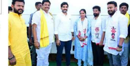
మరో రెండునెలల్లో రాజీయే ప్రజాప్రభుత్వం అన్నిసర్కారుల అందగా నిలుస్తుందని, న్యాయమైన డిమాండ్ల పరిష్కారానికి కృషిచేస్తుందని చెప్పారు.