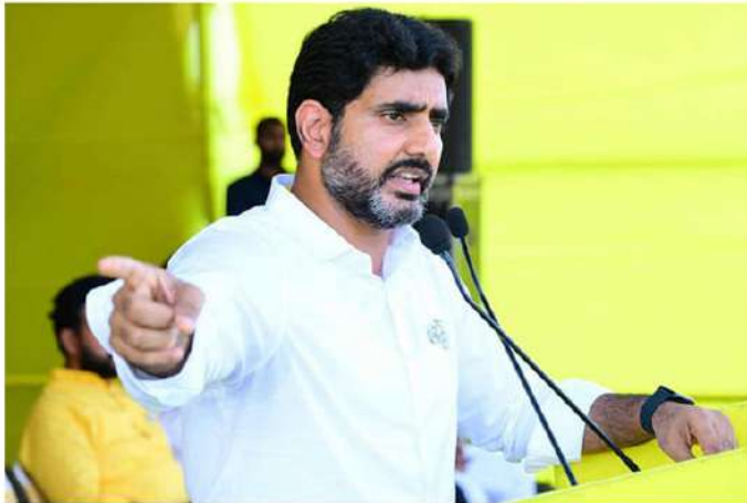
తల్లి, చెల్లెల గంటేశారు

జగన్ కు నిజం చెప్పకూడదనే శాపం జగన్ రెడ్డికి ఒక శాపం ఉంది. నిజం చెబితే ఆయన కల పగిలిపోతుంది. మోసానికి పొద్దులే, పట్టే వేస్తే అది జగన్ రెడ్డి. పాదయాత్రలో దొంగిన ప్రతి మహిళకు ముద్దులు పెట్టారు. తర్వాత గుడ్డులు గుడ్డు తున్నారు. జాబ్ కేటంబో కాస్తా పాక్కి కేంద్రం లా మారింది. డిఎస్సీ మోసం, పీఠీ ఫీజు, రీయంబర్స్ మెంట్ మోసం, ఐదేళ్ల విద్య మోసం, 6500 కాని స్టేబుల్ పోస్టులు ప్రతి ఏడాది భర్తీ చేస్తున్నారని చెప్పే మూల పెట్టారు. 4 నెలల్లో దానినే ఎన్నో మహిళలకు పెన్షన్లు అందావన్నారు. ఇచ్చారా? టీసీ, ఎస్సీ, ఎస్టీ స్టడీ సర్టిఫైడ్ మూసీకారు. ఎన్నికలకు ముందు డిఎస్సీ అంటూ మరో మోసం చేస్తున్నారు. ఇప్పుడు కేవలం రెండు నెలల సమయం మాత్రమే ఉంది. సమయం లేకపోవడమే కాదు.. పోస్టులు కూడా తక్కువ. ఇది ప్రజలకు జగన్ రెడ్డి చేసిన మోసం కాదా? హేతు బద్ధికరణ వేరిట ఉపాధ్యాయుల పోస్టులు భారీగా