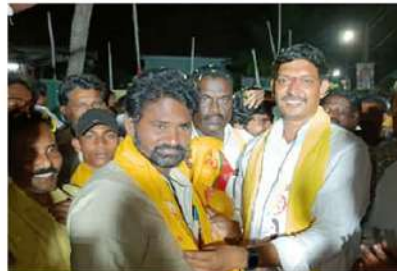
పెదన (చైతన్యరథం): వైసీపీ అధినేత జగన్మోహన్ రెడ్డి తిసుకుంటున్న ఆసంబద్ధ సిద్ధంలను పుటిరేకిస్తూ పలువురు వైసీపీ నాయకులు, కార్యకర్తలు ఆ పార్టీని వీడి