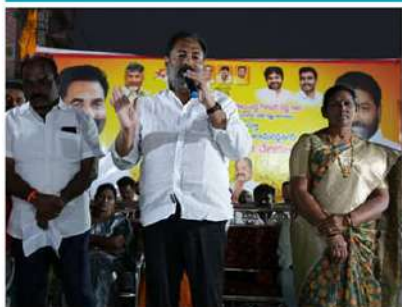
నెల్లూరు (చైతన్యరథం): ఒకవేళే రూ. 10 ఇచ్చి... మరో చేతే రూ. 100 లావుంటున్న వైసీపీ ప్రభుత్వాన్ని ప్రజలు ఇంటికి సాగనంపాలిని, ప్రజా సమస్యలపై తన పోరాటం ఆగదన్నారు. 15