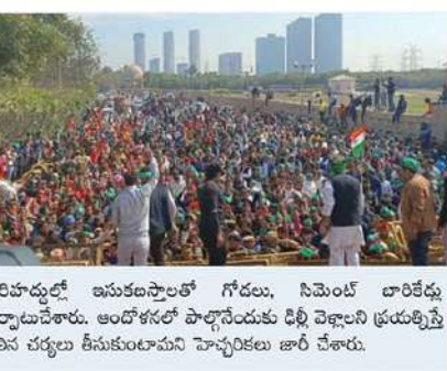
సరిహద్దుల్లో ఇసుకపైలైన్లతో గోదలు, సిమెంట్ లాభిదేళ్లు ఏర్పాటుచేశారు. అందోళనలో పాల్గొన్నందుకు ఢిల్లీ వెళ్లాలని ప్రయత్నిస్తే కఠిన చర్యలు తీసుకుంటామని హెచ్చరికలు జారీ చేశారు.