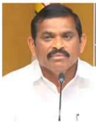
దళనగి ప్రధానమంత్రి అయిన నరేంద్ర మోదీ