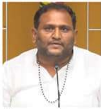
దళనగి ప్రధానమంత్రి అయిన నరేంద్ర మోదీ

ఉద్యోగాల కల్పనపై దారుణంగా అలదాలు ఉద్యోగాల కల్పనపై దారుణంగా అలదాలు. ఉద్యోగాల కల్పనపై దారుణంగా అలదాలు.