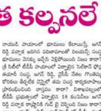
దళనగి ప్రధానమంత్రి అయిన నరేంద్ర మోదీ

ఉద్యోగాల కల్పనపై దారుణంగా అలదాలు ఉద్యోగాల కల్పనపై దారుణంగా అలదాలు. ఉద్యోగాల కల్పనపై దారుణంగా అలదాలు.