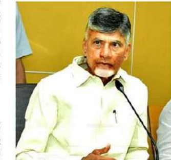
మరో కానిస్టేబుల్ ఏపీ పోలీస్ పేర్లో ఉండడాన్ని సందేహిస్తున్నారని తెలింది. జగన్ రెడ్డి నుంచి స్పూర్తి పొంది ఉంటుంటే అంటూ బుద్ధా వెంకన్న వ్యంగ్యం ప్రదర్శించారు.

హైదరాబాద్ లో నిర్వహించిన యాంటీ డ్రగ్స్ ఆపరేషన్ లో ఇద్దరు ఏపీ పోలీసులు పట్టుబడడంపై డీడీపీ నాయకుడు బుద్ధా వెంకన్న కూడా స్పందించారు. దేశంలో ఎక్కడ గంజాయి పట్టుబడితూ దాని మూలాల ఏపీలో తేలాల్సిందేనని విమర్శించారు. హైదరాబాద్ లోని బాచుపల్లిలో 22కిలో గంజాయిని పట్టుబట్టిన పాపానాన్ని పట్టుకున్నారు. ఆరా తీస్తే కాకినాడలో పనిచేస్తున్న ఒక హెడ్ కానిస్టేబుల్,