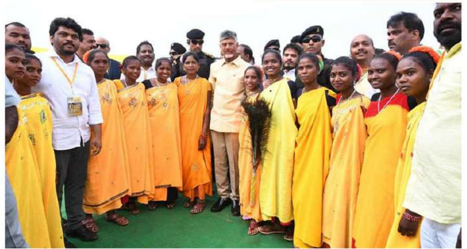
అరకు రా...కదలిరా బహిరంగ సభ దృశ్యాలు