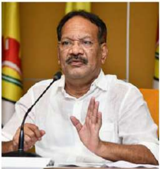
చంద్రబాబుపై ఆక్రమ కేసులు అధగోలుగా బనాయించారు. 17 ఏ వర్షిస్తుందని మేం కోర్టుకెళ్ళాం. అక్కడ సుప్రీంకోర్టు ద్విసభ్య ధర్మాసనం ఖిన్నాభిప్రాయాలు