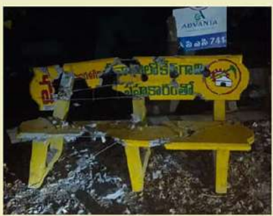
విడ్డంసాగితి బ్రాండ్ అంబాసిడర్ జగన్!

మంగళగిరి నియోజకవర్గం దుర్గిరాల మండలం పేరకలపూడి టీడీపీ జాతీయ ప్రధాన కార్యదర్శి నారా లోకేశ్ సహకారంతో ఏర్పాటు చేసిన సిమెంటు బిల్లులను వైసీపీ మాత్రం సోపావారం రాత్రి ధ్వంసం చేశాయి. దీనిపై ఎన్ డిఎస్ వేదికగా లోకేశ్ సుంధించారు. అందుకే అనేది విడ్డంసాగితి బ్రాండ్ అంబాసిడర్ జగన్ అని పోస్టు పెట్టారు. జైలై విధ్వంసం, జై ఏపీ ఛాన్సెల్ జగన్, 2024 జగన్ నో షోర్ అనే హ్యాష్ ట్యాగ్ లో వైసీపీ మాత్రం ధ్వంసం చేసిన సిమెంటు బిల్లు ఫోటోలను పేర్ చేశారు.