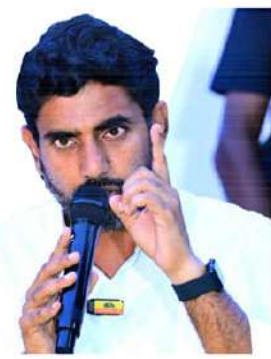
ఈ మేరకు ఒక వీడియో సందేశాన్ని లోకేశ్ విడుదల చేశారు.

మహమ్మారికి దూరంగా ఉండాలని, గంజాయి వద్యులతో అంటూ పెద్ద ఎత్తున చైతన్య కార్యక్రమాల నిర్వహించాను. గంజాయి, మద్యం, డ్రగ్స్, అసాంఘిక కార్యకలాపాల నుంచి పిల్లల్ని కాపాడే పరకూ సోదాడుకూనే ఉంటాను. చంద్రగిరిలో 9వ తరగతి అమ్మాయి గంజాయికి బానిసైంది. చోడవరంలో ఏడవతరగతి విద్యార్థులు స్కూలులో మద్యం తాగుతుండగా, వీడియో తీసిన వ్యక్తిపై దాడికి పాల్పడ్డారు. జగన్ వల్ల బడి పాఠకులు బడికి, పిల్లలు, యువత బంగారు భవిష్యత్తు నాశనం అవుతోంది. చోడవరంలో దండయాత్రకు వైకాపా సర్కారుకి ఎన్ని కల్లోలు బుద్ధి చెప్పింది. ఈ మహమ్మారిపై ప్రతి వక్రంగా ఉంటానే రాజీవేని పోరాటం సాగిస్తున్నాం. టిడిపి-జనసేన ప్రభుత్వం వచ్చాక గంజాయి, డ్రగ్స్, ప్రవాహం దగ్గర మద్యంపై ఉక్కుపాతం మోపుతాం. ప్రజలారా గంజాయి/డ్రగ్స్ రహిత ఆంధ్రప్రదేశ్ కోసం మనమంతా కలిసి యుద్ధం చేద్దాం రండి. మన పిల్లల్ని, మన రాష్ట్రాన్ని కాపాడుకుందామని లోకేశ్ పిలుపు ఇచ్చారు.