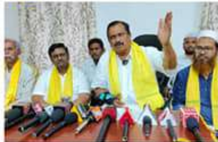
రెండవ స్థానంలో ఉండి, ప్రజల అభివృద్ధి కోసం పోరాడాలి. ప్రజల అభివృద్ధి కోసం పోరాడాలి. ప్రజల అభివృద్ధి కోసం పోరాడాలి.

రాజకీయ ప్రకటనలకు నైతిక అంశాలను పక్కన వేసి, అధికారం కోసం అందరూ ఒకటై పోరాడాలి. ప్రజాస్వామ్యం అని చెప్పాలి. రాష్ట్రంలో అందరూ పౌరస్వామ్యం అని చెప్పాలి.