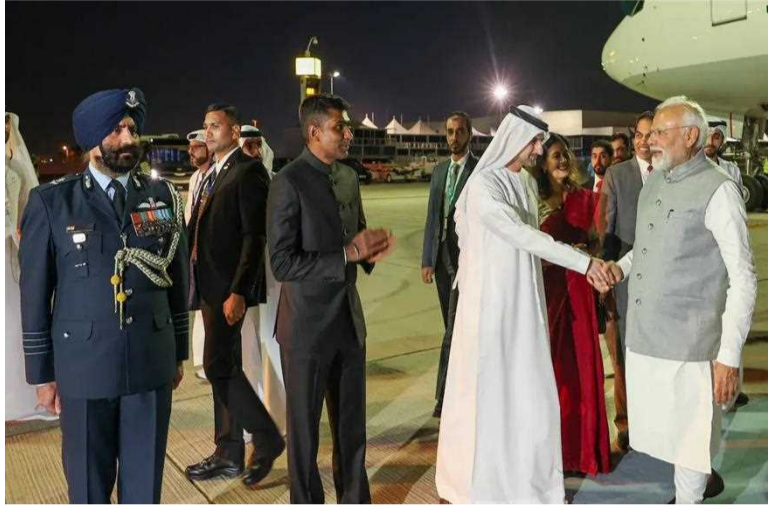
ప్రెసిడెంట్ ఉర్బులా వాన్ డెర్ లేయెన్తో సహా వివిధ ప్రపంచ నాయకులతో ప్రధాని నరేంద్ర మోదీ సంభాషించడం జరిగింది.

శుక్రవారం శిఖరాగ్ర సమావేశం ప్రారంభం కాగానే నాయకులు సంప్రదాయ 'కుటుంబ ఫోటో'కి పోజిలివ్వడం కనిపించింది. ఇటలీ ప్రధాని జార్జియా మెలోని మరియు యూరోపియన్ యూనియన్