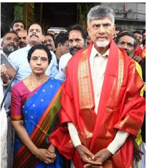
ప్రాణ భిక్ష పెట్టారు. మొన్న నాకు కష్టం వచ్చినపుడు కూడా వెంకటేశ్వరస్వామికి మొక్కుకున్నా. - మిగతా 2లో..

తిరుమల: తెలుగు జాతి ప్రపంచలో నెం.1 గా ఉండాలని, ఆ సంకల్పంతో పని చేస్తానని టీడీపీ జాతీయ అధ్యక్షుడు నారా చంద్రబాబు నాయుడు అన్నారు. శుక్రవారం ఉదయం తిరుమల శ్రీవారిని చంద్రబాబు నాయుడు కుటుంబ సమేతంగా దర్శించుకున్నారు. అనంతరం ఆయన మీడియాతో మాట్లాడుతూ... వెంకటేశ్వర స్వామి పాదాల చెంత పుట్టి అంచెలంచెలుగా ఎదిగి ప్రజా సేవకు అంకితమయ్యానన్నారు. వెంకటేశ్వర స్వామి మా ఇంటి దైవం, ఏ పనైనా ఆయన్ను తలచుకునే ప్రారంభిస్తా. 2003 శ్రీవారి బ్రహ్మోత్సవాల సమయంలో అలిపిరిలో నాపై దాడి జరిగినపుడు నాకు ఆ వెంకటేశ్వర స్వామి