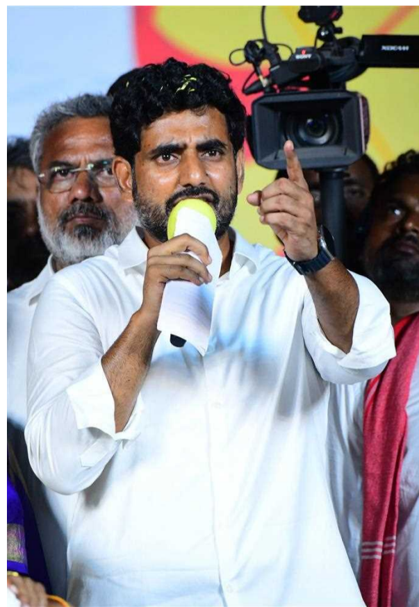
(దన వేజీ తరువాయి)