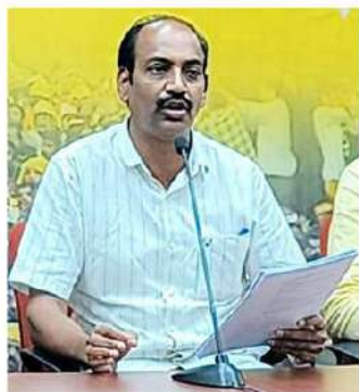
ఫిరేషన్ జారీ చేయడంలో ప్రభుత్వ చిక్కుకొంది తెలుస్తోందని చిరంజీవిరావు విమర్శించారు.

జాబ్ క్యాలెండర్ 2021లో ప్రకటించిన రెండున్నరేళ్లకు నోటిఫికేషన్ ఇచ్చారంటే ప్రభుత్వం నిరుద్యోగులకు ఎంపిక చిన్న చూపుచూస్తుంది, నిరుద్యోగుల జీవితాలకు ఎలా ఆడుకుంటున్నది తెలుస్తోంది. రోజూ పాఠశాలలు, పేస్ట్రీకట్ విద్యాలయ, అర్హత వయస్సు, విద్యార్హతలు, ఫీజు వివరాలు, ఖాళీల ప్రకటన వివరాలు ఏమీ కూడా నోటిఫికేషన్లో పొందు పర్చుకుండా 21 రోజుల పాటు పేర్లు ద్వారా తెలియజేస్తామని పేర్లన్నారంటే నోటి