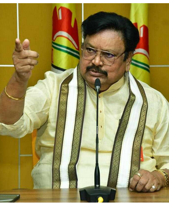
మూల్యం చెల్లించుకోవాల్సి ఉంటుందని గుర్తించుకోవాలి" అని రామయ్య హెచ్చరించారు.

క్లిటీ లేని వ్యక్తి. టార్గెట్ చంద్రబాబు అన్న జగన్ రెడ్డి విధానానికి పొన్నవోలు సుధాకర్ రెడ్డి తాబే దారులా పనిచేస్తున్నాడు. జగన్ మోహన్ రెడ్డి ప్రభుత్వం నిజాయితీపరులైన అధికారులను బయపెడుతూ... జగన్ మోహన్ రెడ్డి తప్పుడు కేసులను సమర్పిస్తున్న అధికారులకు అవార్డులు, రివార్డులు ఇస్తోంది. సాధారణంగా ఆధారాలు లేకుండా పోలీసులు కేసులు పెట్టరు. జగన్ మోహన్ రెడ్డి బెదిరింపులకు బయపడి, ఆయన ఇస్తున్న తాయిలాలకు ఆశపడే అధికారులు చంద్రబాబు నాయుడిపై తప్పుడు కేసులు పెడుతున్నారు. చంద్రబాబునాయుడిపై జగన్ మోహన్ రెడ్డికి ఎందుకంత ద్వేషం? చంద్రబాబునాయుడిపై కక్షసాధించడం కోసం కోట్లాది రూపాయల ప్రజాధనాన్ని వృధా చేస్తూ న్యాయవ్యవస్థను జగన్ మోహన్ రెడ్డి తప్పుదోవ పట్టిస్తున్నాడు. దీనికి జగన్ మోహన్ రెడ్డి కూడా శిక్షార్హుడే. తప్పుడు కేసులు పెట్టి, తప్పుడు సాక్ష్యాలు సృష్టించి జగన్ మోహన్ రెడ్డి విధానమైన టార్గెట్ చంద్రబాబుకు వత్తాసు పలకొద్దని అధికారులను హెచ్చరిస్తున్నాం. జగన్ మోహన్ రెడ్డి తాబేదారుల్లా చట్టానికి వ్యతిరేకంగా పనిచేసే ప్రతీ అధికారి తగిన