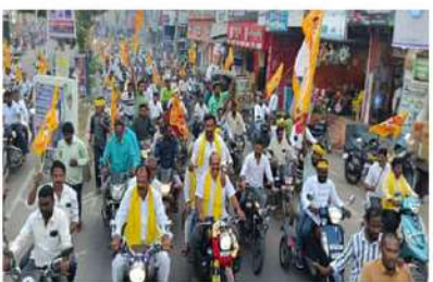
ఆయన కోసం ఎంతోమంది రోడ్లకొరకన్నారు. ఇవాళ చిన్న చిన్న గ్రామాల దగ్గర నుంచి మహానగరాల వరకు ప్రతి ఒక్కరూ ఆయన రాక కోసం ఎదురుచూశారని అన్నిచోట్ల ఒక వందల గాతావరణం కనిపిస్తోందన్నారు.