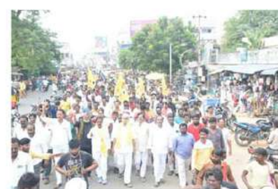
బయటకొచ్చారని, అక్కడ నుండి విజయవాడ వరకు లక్షలాదిగా అపూర్వమైన స్థాయిలో జమ్మలూరిపేట వరకూ వెళ్లింది. అన్న నియోజకవర్గం నుండి జాతీయ రహదారిపైకి వస్తున్నారు. మనవరం హనుమాన్ జంక్షన్ లాగా వెళ్లి స్వాగతం ఇవ్వాలని పిలుపునిచ్చారు. నేడు అగ్రి అపూర్వ స్వాగతం జగ్గయ్యపేట ప్రభుత్వానికి చరమగీతం పాడుతున్నారని, ఈ సందరాల్లో పట్టణ, మండల, నియోజకవర్గ, జిల్లా రాష్ట్రస్థాయిలో వివిధ హోదాలలో వచ్చేటట్లు ఉన్న టీడీపీ నాయకులు, కార్యకర్తలు, అభిమానులు, సానుభూతిపరులు పెద్ద ఎత్తున పాల్గొన్నారు.