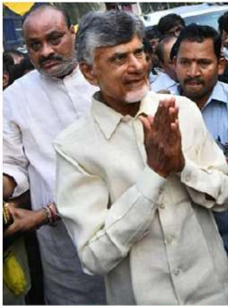
మధ్యంతర బెయిల్ మంజూరు చేసిన హైకోర్టు

నచ్చిన వైద్యసేవలు పొందేందుకు నాలుగు వారాల మధ్యంతర బెయిల్