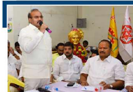
చిలకలూరిపేట చైతన్యరథం: జగన్ తాడేపల్లి ప్యాలెస్ లో టీడీపీ జనసేన పాత్ర ఇప్పటికీ ప్రకంపనలు సృష్టిస్తోందని, ఈ పట్టు