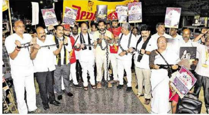
గుంటూరులో తెలుగుయువత ఆధ్వర్యంలో చేతులకు సంకెళ్లు వేసుకుని నిరసన తెలుపుతున్న పార్టీ నేతలు