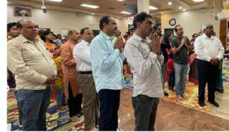
అమెరికా (వైశ్యవర్ణం): చంద్రబాబు ఆరెస్టు ఖండిస్తూ ప్రపంచవ్యాప్తంగా నిరసనలు వెలువెల్లుతున్నాయి. అనేక దేశాలలో ఉన్న ప్రవాసాంధ్రులు వివిధ పద్ధతులలో చంద్రబాబుకి సంఘీభావాలిచ్చి తెలియజేస్తున్నారు. ఆరెస్టు చేసిన అరెస్టు అయిన చంద్రబాబు సంఘర్షణ