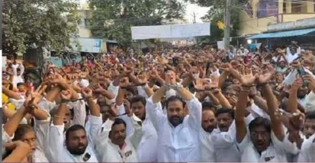
నెల్లూరు రూరల్ ఎమ్మెల్యే కోటం రెడ్డి శ్రీధర్ రెడ్డి ఆధ్వర్యంలో చేతులకు సంకెళ్లతో నిరసన తెలుపుతున్న తెలుగు తమ్ముళ్లు