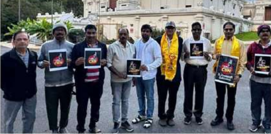
అమెరికాలో కొలకొని, తిరిగి రాష్ట్ర ప్రగతి కోసం ముఖ్యమంత్రి పాలనా నాయకత్వం వహించాలని, న్యాయస్థానాలు వేదికగా ఆయన చేస్తున్న ధర్మ పోరాటానికి దైవానుగ్రహం కోడవ్వాలని వెడుతున్నారు. ఈ కార్యక్రమానికి పెద్ద సంఖ్యలో తెలుగుదేశం, జనసేన అభిమానులు హాజరయ్యారు.