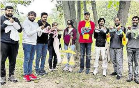
జర్నల్ లో నిరసన తెలుపుతున్న ఎన్ ఆర్ వలు