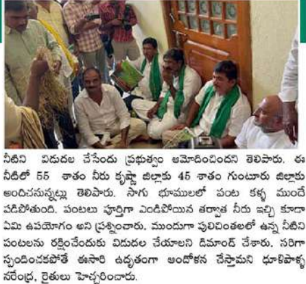
నీటిని విడుదల చేసేందుకు ప్రభుత్వం అనుకోలేదని తెలిపారు. ఈ నీటిలో 55 శాతం నీరు కృష్ణా డెల్టాకు 45 శాతం గుంటూరు డెల్టాకు అందించనున్నట్లు తెలిపారు. సాగు భూములలో పంట కళ్లు ముందే పడిపోతుంది. పంటలు పూర్తిగా ఎండిపోయిన తర్వాత నీరు ఇచ్చి కూడా ఏమీ ఉపయోగం అని ప్రశ్నించారు. ముందుగా పులిపెంజలలో ఉన్న నీటిని పంటలను రక్షించేందుకు విడుదల చేయాలని డిమాండ్ చేశారు. సరిగా సుందించలేకపోతే ఈసారి ఉధృతంగా అందోళన చేస్తామని ధూళిపాళ్ల నరేంద్ర, రైతులు హెచ్చరించారు.

- రైతులతో కలిసి ఆందోళనలు దిగి మాజీ ఎమ్మెల్యే ధూళిపాళ్ల నరేంద్ర - గుంటూరులో నీటిపారుదల శాఖ ఎన్ఆర్ కార్యాలయాన్ని ముట్టడించిన రైతులు గుంటూరు (వైశ్యవర్ణం): కృష్ణా పశ్చిమ డెల్టాకు సాగునీరు అందించడంలో ప్రభుత్వం పూర్తిగా విఫలమైందంటూ గుంటూరులోని నీటిపారుదల శాఖ ఎన్ఆర్ కార్యాలయాన్ని రైతులు ముట్టడించారు. పొన్నూరు మాజీ ఎమ్మెల్యే ధూళిపాళ్ల నరేంద్ర అధ్యక్షులలో ఎన్ఆర్ కార్యాలయానికి వచ్చిన రైతులు అక్కడే బైరాయింబి అంధోళనకు దిగారు. వ్యవసాయానికి నీటిని సాగునీరు ఇవ్వని కారణంగా పంటలు ఎండిపోతున్నాయని రైతులు ఆవేదన వ్యక్తం చేశారు. ఎండిన పరిస్థితులను తీసుకోలేక ప్రభుత్వానికి వ్యతిరేకంగా నిర్యాణం చేశారు. పశ్చిమ మోటార్లు పూర్తి స్థాయిలో ప్రారంభించి నీరు విడుదల చేస్తే పంటలను కాపాడవచ్చని తెలిపారు. అయితే చంద్రబాబుకు వేరేస్తానంటే కారణంతో అన్ని మోటార్లు ఆన్ చేయడం రేదన రైతులు విమర్శించారు. ఈ క్రమంలో కృష్ణా పశ్చిమ