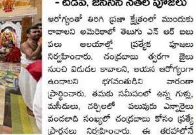
అమెరికాలో తిరిగి ప్రజా క్షేత్రంలో ముందుకు రావాలని అమెరికాలో తెలుగు ఎన్ ఆర్ ఐలు పలు అలయాల్లో ప్రత్యేక పూజలు నిర్వహించారు. చంద్రబాబు త్వరగా జైలు నుంచి విడుదల కావాలని, ఆయన అరెస్టుగా ఉండాలని ధగంతుతు దిన వారంకా ప్రార్థించారు. తమకు సమీపంలో ఉన్న గుళ్లు, మసీదులు, చర్చిలలో వలపులు ఎన్నారైలు వందలాది సంఖ్యలో చంద్రబాబు కోసం ప్రత్యేక ప్రార్థనలు నిర్వహించారు. ఈ తరహాలోనే