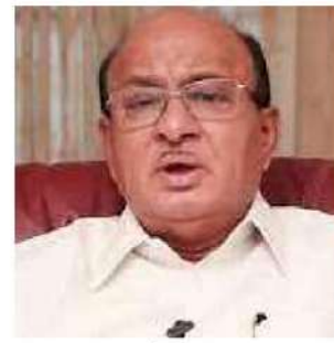
ఎందుకు ఇవ్వటం లేదని ప్రశ్నించారు. చంద్రబాబుని మానసికంగా దెబ్బతీయాలని