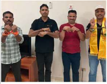
సాబీ అరేబియాలో చేతులను తాళ్లతో బంధించి నిరసన తెలుపుతున్న కార్యకర్తలు