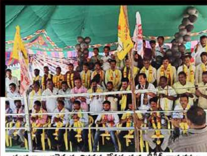
చంద్రబాబు అరెస్టుకు నిరసన చేపడుతున్న టీడీపీ కార్యకర్తలు, జనసేన కార్యకర్తలు