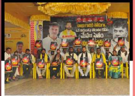
విజయవాడలో ఎమ్మెస్ బిగ్ ఆధ్వర్యంలో నిరసన వ్యక్తం చేస్తున్న కార్యకర్తలు