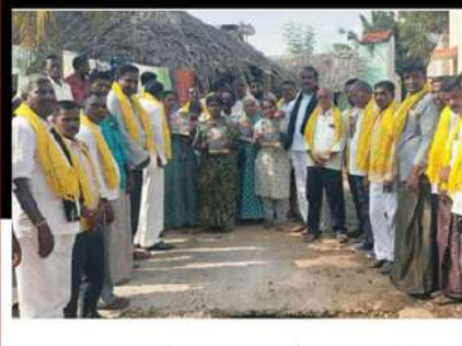
అమలాపురంలో విరసన వ్యక్తం చేస్తున్న కార్యకర్తలు