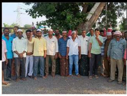
పొన్నూరు నియోజకవర్గం, తక్కెళ్ళపాడులో చంద్రబాబు శ్రేణుంగా బయటకు రావాలని మైనార్టీ కార్యకర్తల ప్రార్థనలు