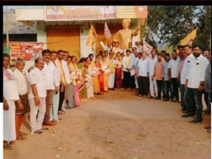
గోకవరంలో కార్యకర్తలతో కలిసి రిలే నిరాహార దీక్ష చేపడుతున్న బీడీపీ నేతలు