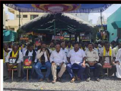
మర్యాపూరులో చంద్రబాబుకు మద్దతుగా దీక్ష చేపడుతున్న కార్యకర్తలు