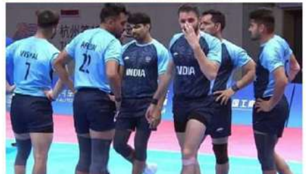
అథ్లెట్లు తమ సత్తా చాటుతున్నారు. ఇంకా మరిన్ని పతకాలు పెరిగే అవకాశముంది. కాగా అరబ్ దేశాల్లో ఆసియా క్రీడలు ముగియనున్నాయి.