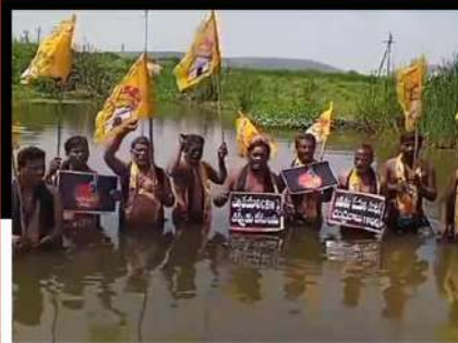
పల్నాడులో జలదీక్ష చేపడుతున్న కార్యకర్తలు