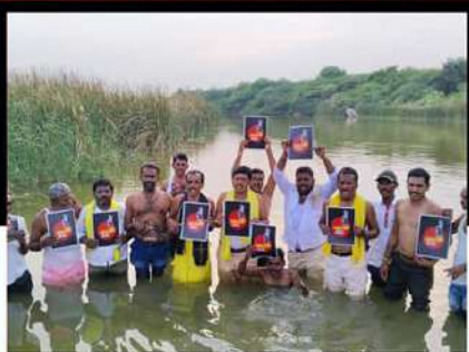
అనంతపురం రూరల్ నియోజకవర్గంలో బీడీపీ కార్యకర్తల జలదీక్ష