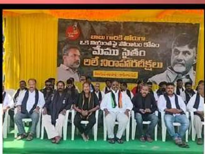
కాకినాడలో కార్యకర్తల లిలే నిరాహార దీక్ష