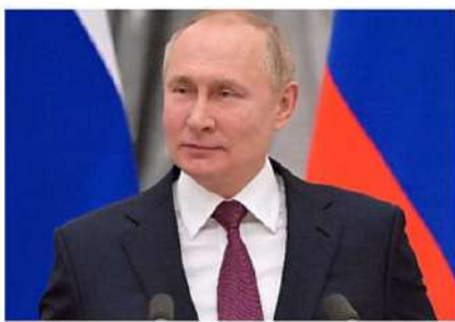
భారత్ అధ్యక్షుడైన ఢిల్లీలో జరిగిన జే20 సదస్సుకు

పశ్చిమ దేశాలు తమ పౌరుల ప్రయోజనాల కోసం పని చేస్తున్న భారత్ పై కుట్రలు, కుట్రల త్రాలు పనిచేయవని అన్నారు. ఇందులో భాగంగానే భారత్ సహా ఇతర దేశాలూ ఆ ప్రమాదం ఉన్నదని తెలిపారు. అయితే, భారత్ స్వతంత్రంగా పని చేస్తున్నదని వివరించారు.