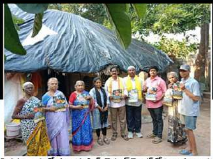
పెనమలూరులో ప్రజలకు సిల్వ్ డెవలప్ మెంట్ లోని వాస్తవాలను ప్రజలకు వివరిస్తున్న కార్యకర్తలు