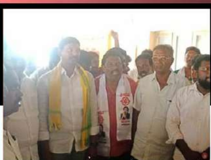
విడనలో శ్రేణులతో కలిసి చంద్రబాబుకు మద్దతు తెలుపుతున్న టీడీపీ కార్యకర్తలు, జనసేన నాయకులు