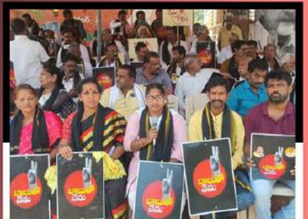
ఒంగోలులో చంద్రబాబుకు మద్దతుగా రిలే నిరాహార దీక్ష చేపడుతున్న కార్యకర్తలు