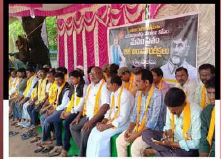
శ్రీశైలం నియోజకవర్గం ఆళ్ళకూరులో రిలే నిరాహార దీక్ష చేపడుతున్న కార్యకర్తలు