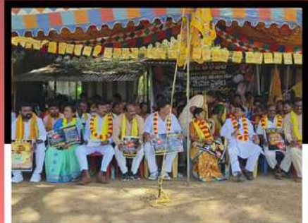
పార్వతీపురం జిల్లా కురుపాంలో కార్యకర్తల రిలే నిరాహార దీక్ష