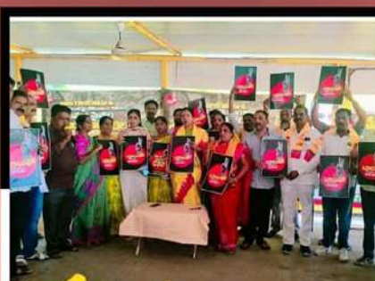
విజయవాడలో గడ్డి అనురాధ ఆధ్వర్యంలో శ్రేణులతో కలిసి లిలే నిరాహార దీక్ష