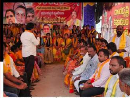
రాజంపేటలో కార్యకర్తల్లో నిరసన తెలుపుతున్న నాయకులు