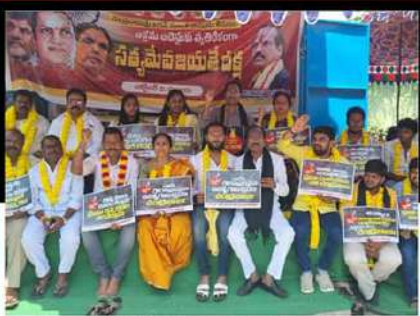
ఏలూరులో బడేటి చంటి ఆధ్వర్యంలో నిరాహార దీక్ష చేపడుతున్న కార్యకర్తలు