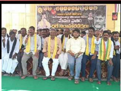
డోన్ లో టీడీపీ కార్యకర్తల రిలే నిరాహార దీక్ష