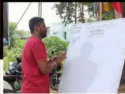
మదనపల్లిలో నంతకాలు సేకరణ చేస్తున్న కార్యకర్త