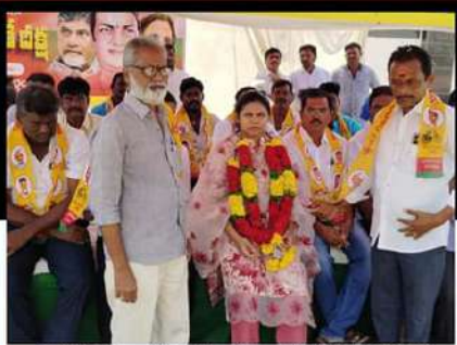
ఆళ్లగడ్డలో శ్రేణులతో కలిసి రిలే నిరాహార దీక్ష చేపడుతున్న భూమా అభిలప్తియా