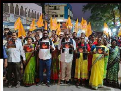
విశాఖలో బీడీపీ ఎమ్మెల్యే వెలగపూడి రామకృష్ణబాబు