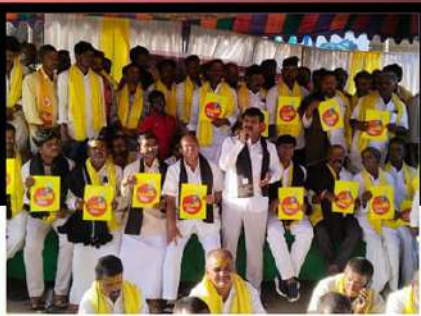
ఎమ్మిగనూరులో కార్యకర్తలకు సంఘీభావం తెలుపుతున్న నేతలు