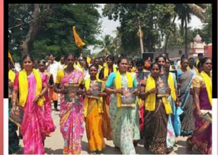
మదకూరిలో చంద్రబాబుకు మద్దతుగా నిరసన ర్యాలీ చేపడుతున్న కార్యకర్తలు