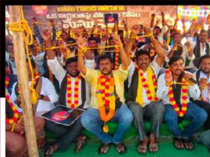
వినుకొండలో ఆందోళన వ్యక్తం చేస్తున్న కార్యకర్తలు