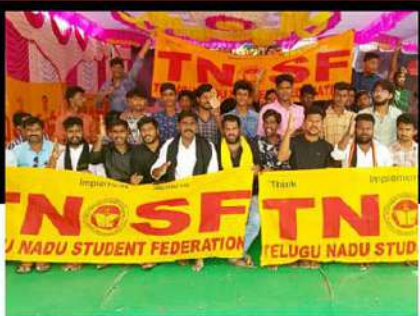
అనంతపురంలో టీఎన్ఎస్ఎఫ్ ఆధ్వర్యంలో రిలే నిరాహార దీక్ష చేపడుతున్న కార్యకర్తలు