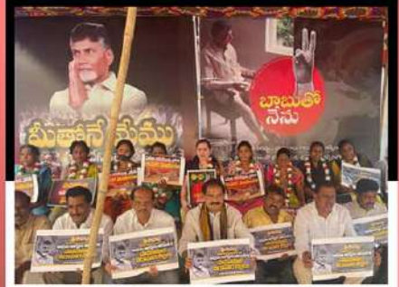
మైలవరం నియోజకవర్గం గొల్లపూడిలో రిలే నిరాహార దీక్ష చేపడుతున్న కార్యకర్తలు