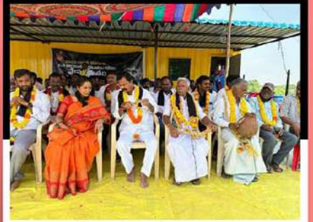
పొన్నూరులో గౌరు చరిత్రార్థి ఆధ్వర్యంలో చంద్రబాబుకు మద్దతుగా రిలే నిరాహార దీక్ష