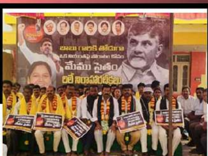
రాజమహేంద్రవరంలో ఆందోళన వ్యక్తం చేస్తున్న కార్యకర్తలు