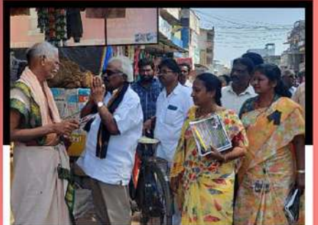
రాజోలులో సర్వోపాధ్యక్షుల సమన్వయ కమిటీని వ్యావహారిక ప్రజలకు తెలియజేస్తున్న గొల్లపల్లి