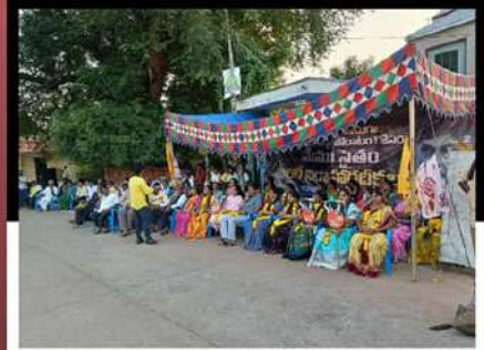
గోపాలపురంలో రోడ్డుపై రిలే నిరాహార దీక్ష చేపడుతున్న కార్యకర్తలు