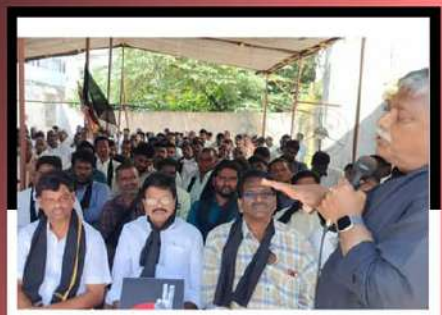
జగ్గనపేటలో ఆందోళన వ్యక్తం చేస్తున్న కార్యకర్తలకు సంఘీభావం తెలుపుతున్న జ్యోతుల నెట్టెం