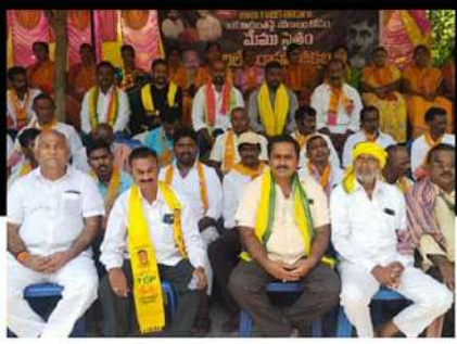
కోడూరులో ఆందోళన చేపడుతున్న కార్యకర్తలు