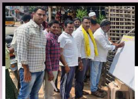
దడ్డలో సంకళాల సీకరణ చేపడుతున్న కార్యకర్తలు