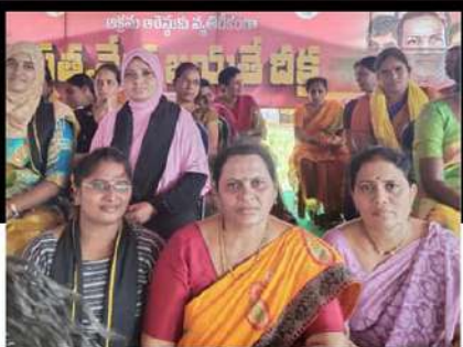
తాడికొండలో మహిళల రలే నిరాహార దీక్ష