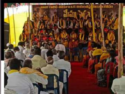
సంతనూతలపాడులో అందోళన వ్యక్తం చేస్తున్న కార్యకర్తలు