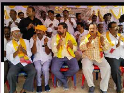
రాయచోటిలో తాళాలు కొడుతూ చంద్రబాబుకు మద్దతు తెలుపుతున్న నాయకులు, కార్యకర్తలు