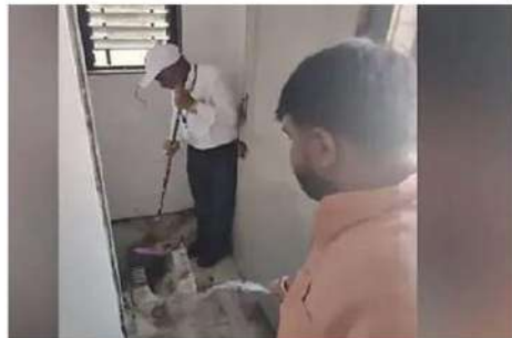
దీంతో ఆయన వీధురకుట్టు తీసుకుని టాయెలెట్ కు త్రొంగు చేయగా, ఎంపీ బాలకృష్ణ పైట్తో సీడిని కొట్టడం వీడియోలో లభిస్తోంది. సిబ్బంది అందరూ చూస్తుండగానే టాయెలెట్ ను డీన్ కు త్రొంగు చేశారు.