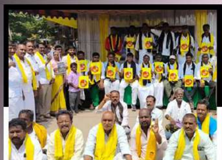
చంద్రబాబుకు అక్రమ అరెస్టును ఖండిస్తున్న ఎమ్మెగనూరులోని టీడీపీ కార్యకర్తలు