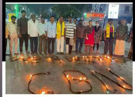
నెల్లూరులో చంద్రబాబుకు మద్దతుగా దీపాలు వెలగించి సంఘీభావం తెలుపుతున్న కార్యకర్తలు