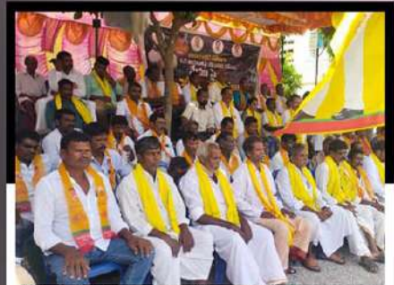
కోడుమూరులో చంద్రబాబుకు మద్దతుగా ఆందోళన వ్యక్తం చేస్తున్న కార్యకర్తలు