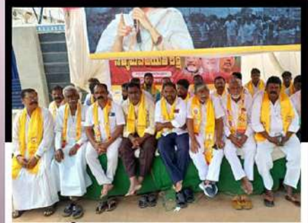
అళ్లగడ్డలో చంద్రబాబుకు మద్దతుగా నిరసన తెలుపుతున్న కార్యకర్తలు