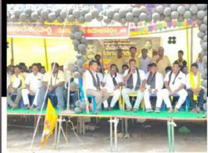
కోనసీమ జిల్లా ముచ్చడివరంలో చంద్రబాబుకు మద్దతు తెలియజేస్తున్న సేతలు