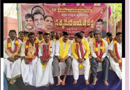
బనగానపల్లెలో శ్రేణులతో కలిసి రిలే నిరాహార దీక్ష చేపడుతున్న జీసీ జనార్ధన్ రెడ్డి