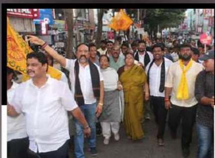
శ్రీకాకుళంలో గుండ లక్ష్మీదేవి ఆధ్వర్యంలో నిరసన ర్యాలీ చేపడుతున్న కార్యకర్తలు