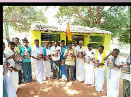
కళ్యాణదుర్గంలో ప్రభుత్వానికి ఘోరంగా ఆందోళన వ్యక్తం చేస్తున్న కార్యకర్తలు