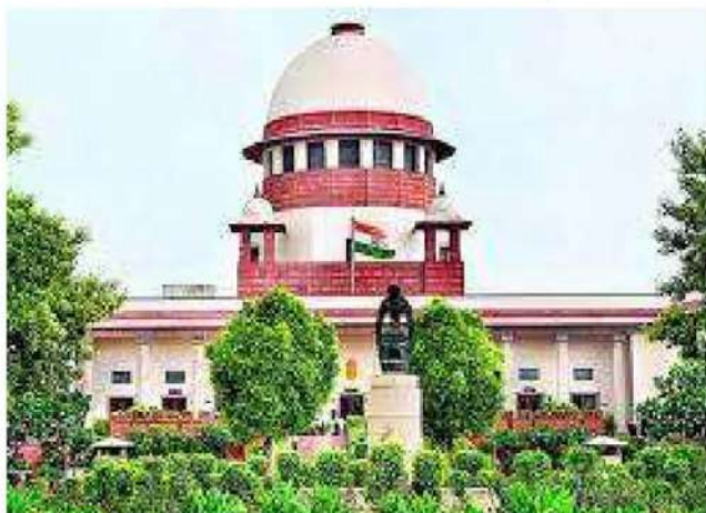
పాల్వడినట్లు సీబడీ ఒక్క అధికారం కూడా చూపలేక పోయిందని మన సింట్స్ కోర్టుకు వివరించారు.

న్యూఢిల్లీ: స్మిత్ దెవలమ్ మెంటల్ కేసులో దీదీపీ అధినేత చంద్రబాబు దాఖలు చేసిన క్యాష్ పిటిషన్ పై సుప్రీంకోర్టులో మంగళవారం సుదీర్ఘ వాదనలు జరిగాయి. అనంతరం విచారణను ఈ నెల 9వ తేదీకి వాయిదా వేస్తున్నట్లు ధర్మాసనం ప్రకటించింది. జస్టిస్ అనిరుద్ధ ధోన్, జస్టిస్ బేలా ఎం. త్రివేది ధర్మాసనం విచారణ నిర్వహించింది. గతంలో ఏపీ హైకోర్టు క్యాష్ పిటిషన్ ను తిరస్కరిస్తూ ఇచ్చిన తీర్పును సవాల్ చేస్తూ సుప్రీంకోర్టును దీదీపీ అధినేత చంద్రబాబు ఆశ్రయించారు. తీవ్ర ఉభయోక్త నడుమ స్మిత్ కేసులో చంద్రబాబు క్యాష్ పిటిషన్ ను ఇవాళ జస్టిస్ అనిరుద్ధ ధోన్, జస్టిస్ బేలా (త్రివేది ధర్మాసనం విచారించింది. ఈ కేసుకు సంబంధించి హైకోర్టులో సమర్పించిన పత్రాలన్నీ సోమవారం లోపు సమర్పించాలని సీబడీ తరపు న్యాయవాది ముకుల్ రోహాట్కీ సుప్రీంకోర్టు ఆదేశించింది.