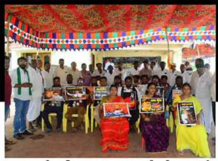
నందిగామలో తంగిరాల సౌమ్య ఆధ్వర్యంలో రిలే నిరాహార దీక్ష చేపడుతున్న కార్యకర్తలు