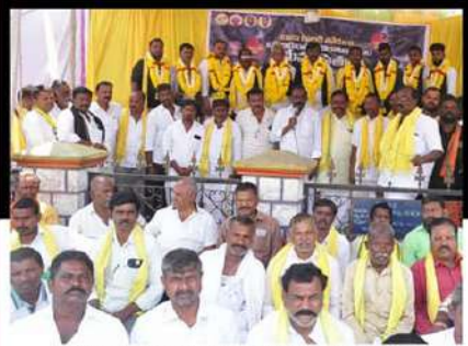
అనాపర్తిలో శ్రేణులతో కలిసి చంద్రబాబుకు మద్దతు తెలుపుతున్న మీనాక్షినాయుడు