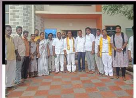
కాకినాడ జెన్.ఎన్.టి.యూ.లోని సిల్వీ డెవలప్.మెంట్ సెంటర్ను సందర్శించిన బీడీపీ నేతలు