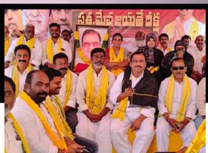
రాజంపేట పట్టణంలో శ్రేణులతో కలిసి నిరసన తెలుపుతున్న బత్తాల చంగల్ రాయుడు