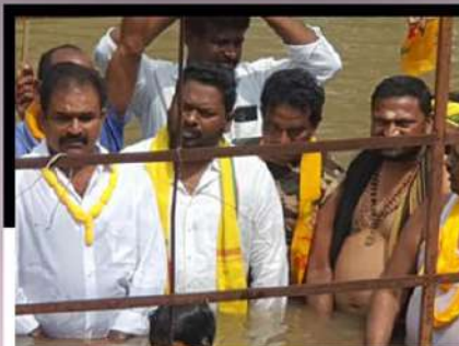
కాకినాడ సొమ్మరకొట్లలో జలదీక్ష చేపడుతున్న కార్యకర్తలు