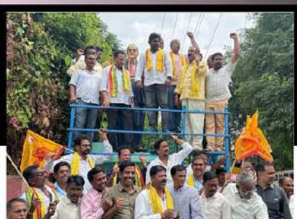
అనపర్తి విగ్రహం వద్ద ఆందోళన వ్యక్తం చేస్తున్న కార్యకర్తలు