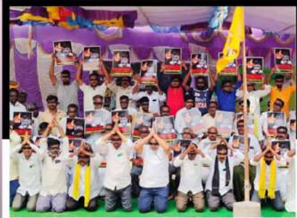
శింగనమలలో కళ్లకు రిబ్బన్న కట్టుకుని మోక్షాక్షి నిలబడి ఆందోళన వ్యక్తం చేస్తున్న కార్యకర్తలు