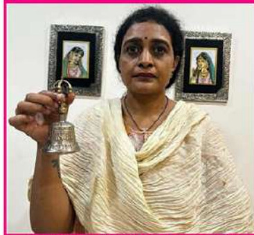
బాలుకు మద్దతుగా గంట మోగిస్తున్న సందమాల సుహాసిని