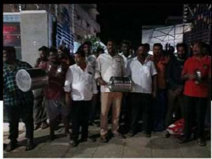
ఆళ్లగడ్డలో భూమా అఖిల ప్రియ ఇంటి వద్ద కంచం, గరిటెలు మోగిస్తూ కార్యకర్తల నిరసన