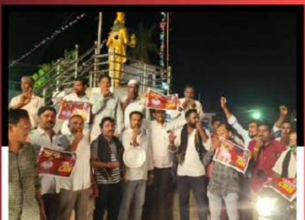
వీరబల్లి మండలంలో విజిల్ చేస్తూ ఆందోళన వ్యక్తం చేస్తున్న కార్యకర్తలు