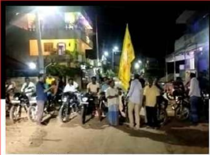
చిత్తూరులో బైక్ హారన్లు మోగిస్తూ బాబు మద్దతు వలకుతున్న కార్యకర్తలు