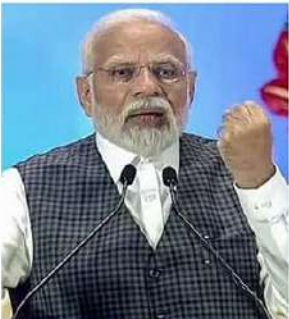
కాంగ్రెస్ ప్రభుత్వం అవినీతిలో పేరుకుపోయిందని, లిక్కర్ అవినీతి, అవు వేడలో అవినీతి, చివరకు ఓపెం గవీర్ కల్యాణ్ యాజ్న సింగ్ కింద ఇచ్చిన రేషన్ వ్యవహారంలోనూ అవినీతికి పాల్పడతారని మోదీ ఆరోపించారు. అభివృద్ధి పనుల విషయంలో కాంగ్రెస్ పాలిత