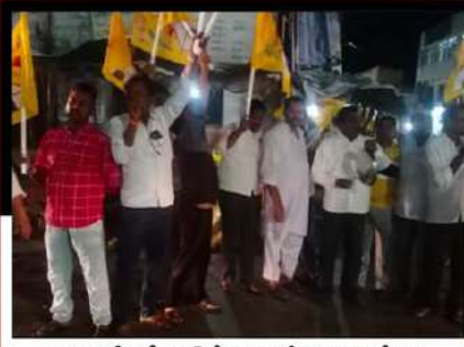
జి.కొత్తకోటలో విజిల్ చేస్తూ ఆందోళన వ్యక్తం చేస్తున్న కార్యకర్తలు