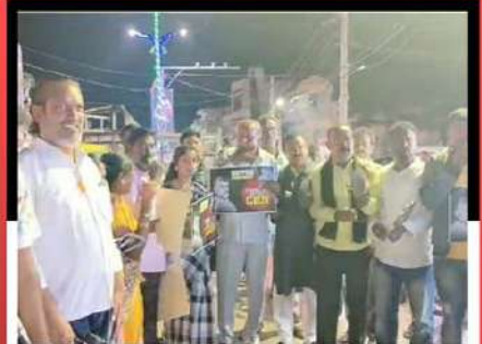
కాకినాడలో రోడ్డుపైకి వచ్చి విజిల్స్ ఊదుతూ బాబుకు మద్దతు తెలుపుతున్న కార్యకర్తలు