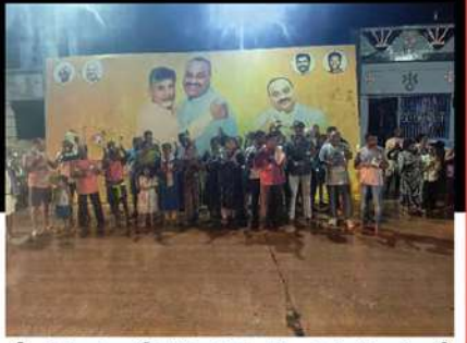
శ్రీకాకుళం జిల్లా కోటబొమ్మకొండ మండలం నిమ్మకల్ల గ్రామంలో కార్యకర్తల డప్పుల మోత