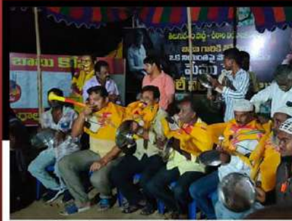
చీరాలలో అధినేతకు అండగా మోతమోగిస్తున్న కార్యకర్తలు