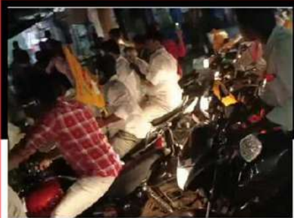
మదనపల్లిలో బైక్ హారన్ మోగిస్తూ నిరసన వ్యక్తం చేస్తున్న కార్యకర్తలు