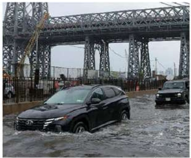
ప్రజలు తమ భద్రతకు తగిన చర్యలు తీసుకోవాలి. ప్రస్తుతం రోడ్లపై ప్రయాణించడంపై హెచ్చరించారు.

ఎక్కడ చూసినా నిశ్శబ్దం కనిపిస్తున్నాయి. జనజీవనం అస్తవ్యస్తంగా మారింది. ప్రజలు అప్రమత్తంగా ఉండాలని సూచించారు. ప్రయాణాన్ని బయటా బయటా చేయాలని అధికారులు అదేశాలు జారీ చేశారు. ప్రజలు ఎక్కడికి వెళ్లవద్దని నిషేధాజ్ఞలు విధించారు. ధారీ వర్షాలు, వరదల కారణంగా నగరం పరిస్థితి మరి దారుణంగా ఉంది. మెట్రో సేవలు నిలిచిపోయాయి. రోడ్లు, రోడ్లు జలమయమయ్యాయి. సబ్వే వ్యవస్థ నిలిచిపోయింది. వరదల కారణంగా లాగాగయి విమానాశ్రయంలో విమానాలు ఆలస్యమయ్యాయి. కొన్ని ప్రాంతాల్లో 5 అంగుళాల (13 సెం.మీ.) కంటే