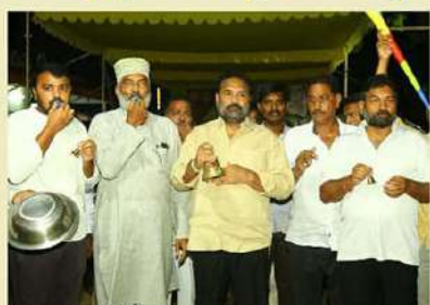
చంద్రబాబు నాయుడు అక్రమ అరెస్టును నిరసిస్తూ నెల్లూరు రూరల్ ఎమ్మెల్యే కార్తాలయంలో మోత మోగించే కార్యక్రమాన్ని నిర్వహించిన రూరల్ ఎమ్మెల్యే కోటంరెడ్డి శ్రీధర్ రెడ్డి, టీడీపీ నాయకులు కోటంరెడ్డి గిరిధర్ రెడ్డి తదితరులు.