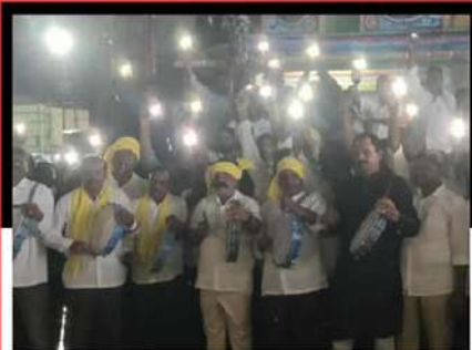
డోన్ పట్టణంలో డప్పులు మోగిస్తూ నిరసన తెలుపుతున్న కార్యకర్తలు