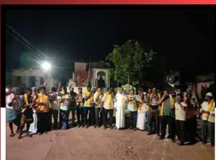
శ్రీశైలం ఆశ్రమానికి మోతమోగిస్తున్న టిడీపీ శ్రేణులు