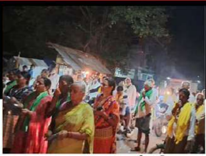
చంద్రబాబుకు మద్దతుగా బొరుపాలెంలో విజిల్ ఊడుతూ నిరసన తెలుపుతున్న కార్యకర్తలు