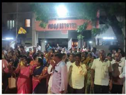
విజయవాడలో రోడ్డుపైకి వచ్చి విజిల్ ఊదుతున్న కార్యకర్తలు