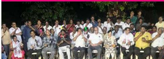
విజయనగరంలో శ్రేణులతో కలిసి విజిల్స్ ఊదాతున్న మాజీ కేంద్రమంత్రి అశోక్ గజపతిరాజు

తాడేపల్లిలోని జగన్ కు వినపడేలా మనకురాలితో కలిసి మోత మ్రోగిస్తున్న వర్ల రామయ్య భార్య జయప్రద