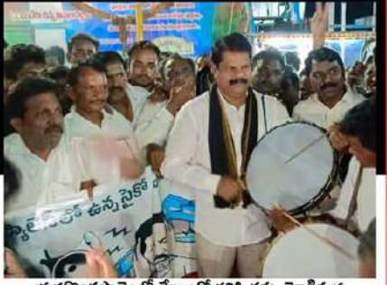
యర్రగొండపాలెంలో శ్రేణులతో కలిసి డప్పు మోగిస్తున్న గూడూరి ఎలక్షన్ బాబు