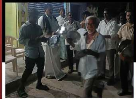
యర్రగోండపాలెం నియోజకవర్గం పెద్దూరవీడు మండలంలో శ్రేణుల నిరసన