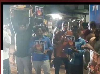
పాన్నూరు నియోజకవర్గం నిడుత్రోలులో రోడ్లపైకి వచ్చి విజిల్ వేస్తూ నిరసన తెలుపుతున్న కార్యకర్తలు