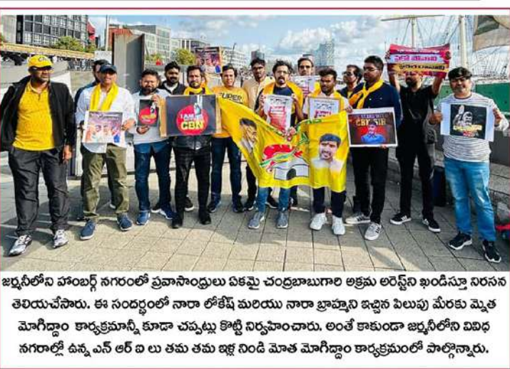
జర్నలిస్ట్ హంబర్గ్ నగరంలో ప్రవాసాంధ్రులు ఏకమై చంద్రబాబుగారి అక్రమ అరెస్టుని ఖండిస్తూ నిరసన తెలియచేసారు. ఈ సందర్భంలో నారా లోకేష్ మలయు నారా బ్రాహ్మణి ఇచ్చిన పిలుపు మేరకు మొత్త మోగిద్దాం కార్యక్రమాన్ని కూడా చప్పట్లు కొట్టి నిర్వహించారు. అంతే కాకుండా జర్నలిస్టుల వివిధ నగరాల్లో ఉన్న ఎన్ ఐ లు తమ తమ ఇళ్ల నుండి మోత మోగిద్దాం కార్యక్రమంలో పాల్గొన్నారు.