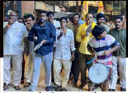
నెల్లూరు నగరంలో విజిల్ ఊతూ డప్పులతో నిరసన వ్యక్తం చేస్తున్న శ్రేణులు