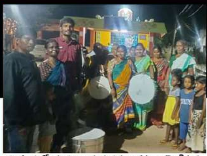
గూడూరులో చంద్రబాబుకు మద్దతుగా డప్పులు మోగిస్తున్న కార్యకర్తలు