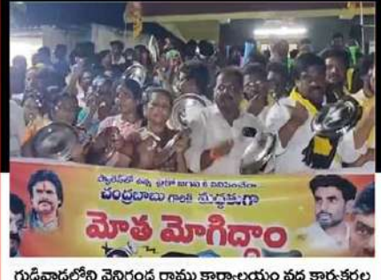
గుడివాడలోని వెనిగండ్ల రాము కార్యాలయం వద్ద కార్యకర్తల మోత మోగిస్తూ నిరసన