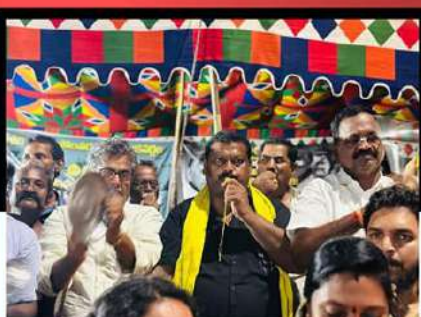
పోలవరంలో విజిల్ ఊదుతున్న నాయకులు, కార్యకర్తలు