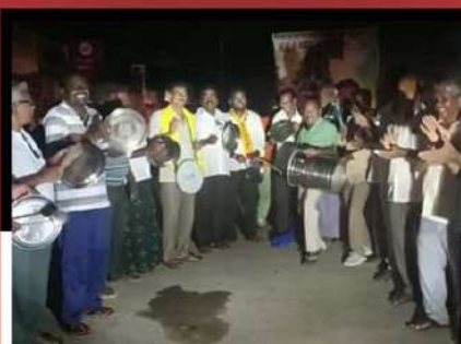
నందులూరు మండలంలో డప్పులు కొడుతున్న శ్రేణులు