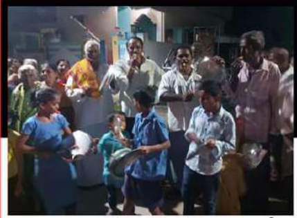
గుంటూరు జిల్లా ప్రత్తిపాడు నియోజకవర్గం గనికపూడి గ్రామంలో చంద్రబాబుకు మద్దతుగా మోతమోగిస్తున్న ప్రజలు