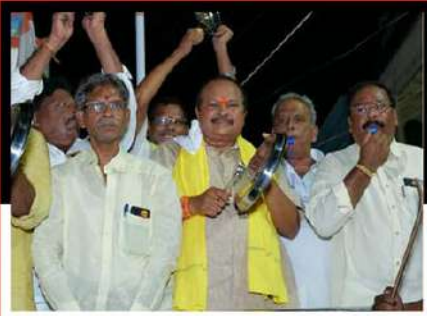
సత్తనపల్లిలో శ్రేణులతో కలిసి చంద్రబాబుకు మద్దతుగా కంచం, గరిటిలతో మోతమోగిస్తున్న కన్నా లక్ష్మీనారాయణ