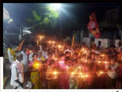
యర్రగోండపాలెం నియోజకవర్గం త్రిపురాతకం మండలంలో నిరసన