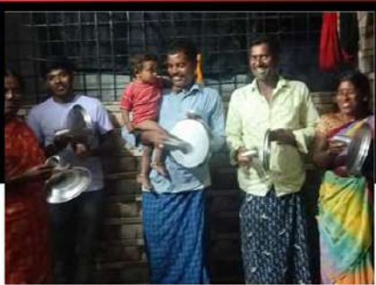
పుట్టపర్తిలోని ఆమడగూరు మండలంలో అధినేత చంద్రబాబుకు మద్దతుగా ఓ కార్యకర్త కుటుంబం నిరసన