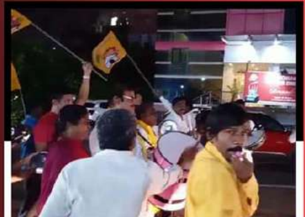
విజయవాడ నగరంలో డప్పులు, విజిల్ ఊదుతూ ఆందోళన వ్యక్తం చేస్తున్న కార్యకర్తలు