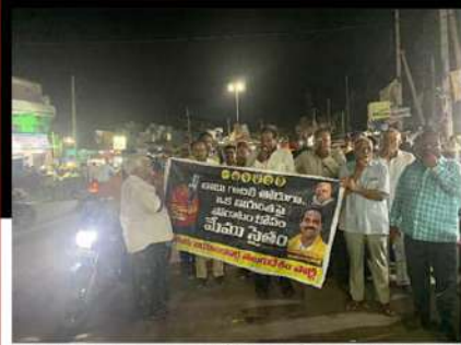
ప్రత్తిపాడు నియోజకవర్గంలో విజిల్స్ చేస్తూ రోడ్డుపై నిరసన వ్యక్తం చేస్తున్న కార్యకర్తలు