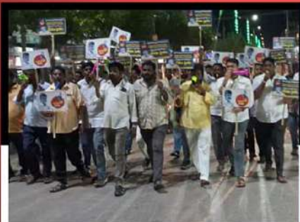
మచిలీపట్నం కోనేరు సెంటర్ వద్ద విజిల్ ఊద నిరసన వ్యక్తం చేస్తున్న కార్యకర్తలు