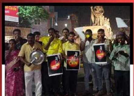
తిరుపతి నియోజకవర్గం ఎం.ఆర్.పల్లి కూడలిలో బాబుకు మద్దతుగా మోతమోగిస్తున్న కార్యకర్తలు