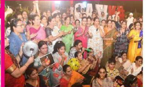
బిజిల్ ఊదాతుతూ, కంచం మోగిస్తూ నిరసన తెలుపుతున్న మహిళలు