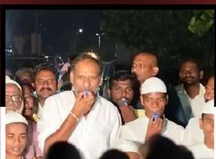
అద్దంకిలో కార్యకర్తలతో కలిసి విజిల్ ఊదుతూ నిరసన వ్యక్తం చేస్తున్న ఎమ్మెల్యే గొట్టిపాటి రవికుమార్