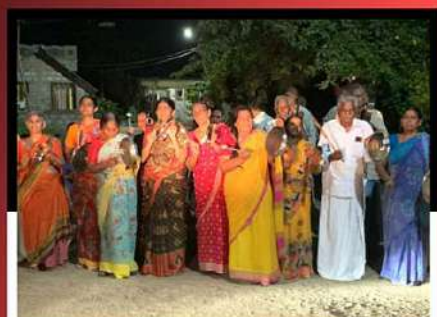
గుంటూరు జిల్లా, ప్రత్తిపాడు మండలం గింజావారిపాలెంలో చంద్రబాబుకు మద్దతుగా కంచం, గరిటెలతో నిరసన