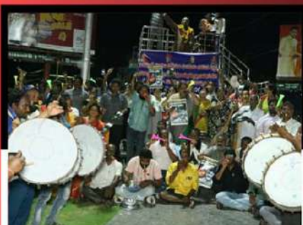
గుంటూరు లాడ్జీ సెంటర్ వద్ద డప్పులు, విజిల్స్ ఊదతూ చంద్రబాబుకు మద్దతు తెలుపుతున్న కార్యకర్తలు