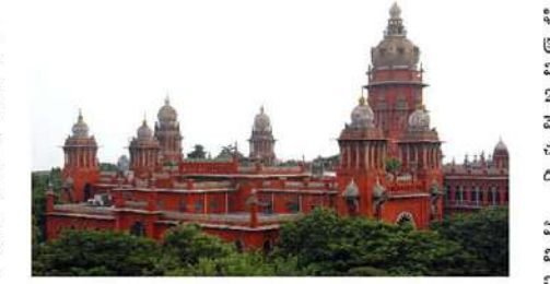
చేశారు. ఇక్కడి వరకు బాగానే ఉన్న ఆ తర్వాత అసలు ఘటన పోలు చేసుకుంది. అటవీ ప్రాంత ప్రజలు వారిని ఏం చేసినా అదిగో వారే ఉండరు.. మైగా ఎర్రనందనం స్పర్షింగ్ చేస్తూ కొరికిపోయారని భావించిన ఆ ప్రభుత్వ అధికారులంతా ఆ గ్రామస్థులకు నరరూప చూపించారు. ఆ గ్రామంలో ఉన్న 18 మంది గిరిజన మహిళలపై అత్యాచారం, లైంగిక వేధింపులకు పాల్పడ్డారు. ఈ ఘటనపై వెంటనే బాధితులు అయ్యా దురస్థులు ఆగ్రహించారు. అయితే పోలీసులు, ప్రభుత్వ ఉద్యోగులపై కేసు నమోదు చేసేందుకు వారు నిరాకరించారు. దీంతో ఇలా తమకు న్యాయం జరగదని భావించిన బాధితులు ఏకంగా సుప్రీంకోర్టు గడువ తొక్కారు. దీంతో తీవ్ర ఆగ్రహం వ్యక్తం చేసిన సుప్రీంకోర్టు, నిందితులందరిపై కేసును నమోదు చేయాలని బోగీసులకు

తమిళనాడు : బ్యాంకాయత ఉద్యోగంలో ఉన్న వ్యక్తులే వారి పాపాల నరరూప రక్షణలు అయ్యారు. ఒక్కయి కాదు ఇద్దరు కాదు ఏకంగా 18 మంది మహిళలపై అత్యాచారం, లైంగిక వేధింపులకు పాల్పడ్డారు. అయితే నిందితుల్లో అంతా పోలీసులు, అటవీ సిబ్బంది, రెవెన్యూ అధికారులు ఉండటం తీవ్ర సంబంధంగా మారింది. ఇక ఈ కేసు 1992 నాటిది కాగా.. 31 ఏళ్ల తర్వాత మద్రాస్ హైకోర్టు తీర్పు వెలువరించింది. ఈ తీర్పుతో 3 దళాల్లో మోరాలం సాగిస్తున్న బాధితులకు న్యాయం దక్కనున్నట్లు అయింది. దీంతో పాటు బాధితులకు డిక్లారేషన్ రూ.10 లక్షల చొప్పున పరిహారం చెల్లించాలని మద్రాస్ హైకోర్టు తీర్పు వెలువరించింది. ఈ ముఠా తమిళనాడులో జరిగింది. ఇక ఈ కేసు వివరాలు ఇక్కడ వెళ్తే. 1992 లో తమిళనాడులోని ధర్మపురి జిల్లా కల్యాణయన్ కొండ ప్రాంతాల్లో దట్టమైన అటవీ ప్రాంతంలో వాసాట్ల అనే దిన్నీ గ్రామం ఉంది. అయితే ఆ గ్రామంలో ఎర్రనందనం స్పర్షింగ్ జరుగుతోందని పోలీసులకు సమాచారం అందింది. ఈ నేపథ్యంలోనే భారీగా ఆ ప్రాంతా నికీ చేరుకున్నాయి. 1992 జూన్ 20 వ 155 మంది అటవీ సిబ్బంది, 108 మంది పోలీసులు, అరుగురు రెవెన్యూ శాఖ అధికారులు కలిపి మొత్తం 269 మంది ఆ గ్రామాన్ని చుట్టుముట్టారు. ప్రతి ఇంటికీ వెళ్లి తనిఖీలు చేశారు. ఆ రోజుల్లో కొన్ని ఎర్రనందనం దుంగలను సాగ్రించిన చేసుకున్నారు. వీటికి సంబంధించి 90 మంది మహిళలు, 43 మంది పురుషులపై పోలీసులు కేసు నమోదు