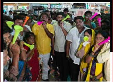
నంద్యాలలో శ్రేణులతో కలిసి విజిల్ ఊది నిరసన వ్యక్తం చేస్తున్న ఎమ్మెల్యే విమ్మల రామనాయుడు, భూమా