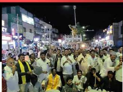
హిందూపురం సింబర్ లో మోతమోగిస్తున్న కార్యకర్తలు