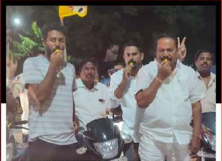
మదనపల్లిలో డొమ్మలపాటి రమేష్ ఆధ్వర్యంలో విజిల్ ఊడుతూ నిరసన వ్యక్తం చేస్తున్న టీడీపీ కార్యకర్తలు