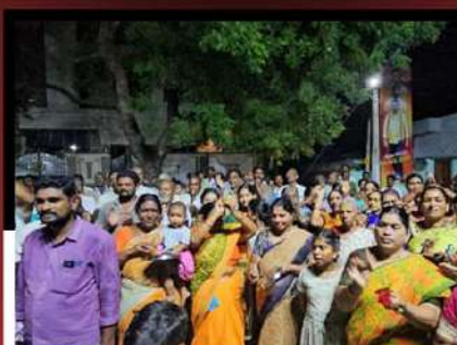
నిడదవోలులో బూరుగుపల్లి శేషారావు అధ్వర్యంలో చంద్రబాబుకు మద్దతుగా నిరసన తెలుపుతున్న మహిళలు