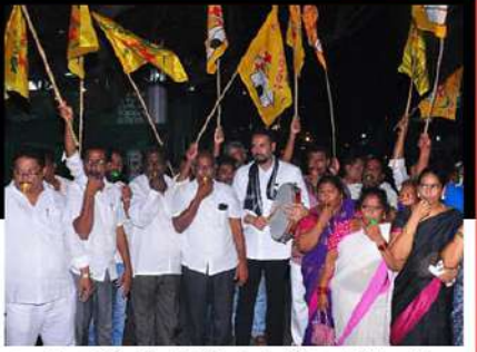
విజయవాడలో ఎమ్.ఎన్.బేగ్ ఆధ్వర్యంలో విజిల్ వేస్తూ డప్పులు కొడతూ నిరసన తెలుపుతున్న కార్యకర్తలు