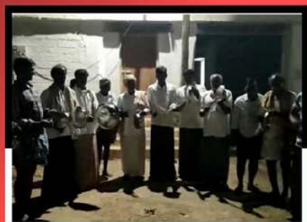
రాష్ట్రాడులో కంచం, గరిటెలతో మోత మోగిస్తున్న కార్యకర్తలు