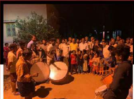
శ్రీకాకమాన్ని తొట్టెంబేడులో డప్పులు మోగిస్తూ చంద్రబాబుకు మద్దతు తెలుపుతున్న కార్యకర్తలు