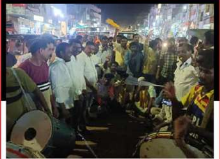
డప్పులు మోగిస్తూ నందికొట్కూరులో కార్యకర్తలు నిరసన