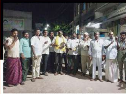
ఆళ్లగడ్డ నియోజకవర్గం చాగలమల, నిరివెళ్ల, దుద్రవరం మండలాల్లో శ్రేణుల డప్పుల మోత