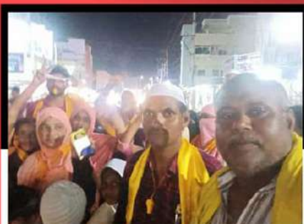
ఓంగోలులో విజిల్ వేస్తూ, డప్పులు మోగిస్తూ బాబుకు మద్దతు తెలుపుతున్న కార్యకర్తలు