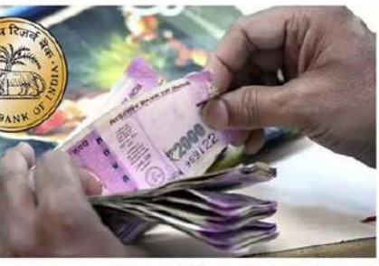
అయితే, చెలామణిలో ఉన్న రూ.2000 నోట్లలో 93 శాతం బ్యాంకులకు తిరిగి వచ్చినట్లు ఈ నెల 2వ అట్టిం తెలిపింది. ప్రధాన బ్యాంకుల నుంచి సేకరించిన సమాచారం ప్రకారం రూ.2000 డిమాండ్ నేషనల్ ఉన్న మొత్తం నోట్లలో 87 శాతం డిమాండ్ నేషనల్ ఉండగా, దాదాపు 13 శాతం ఇతర డిమాండ్ నేషనల్ నోట్లలోకి మార్చుకున్నట్లు వివరించింది. ఇంకా ఎవరవద్దనైనా రూ.2000 నోట్లు ఉంటే సమీపంలోని బ్యాంక్ బ్రాంచ్ వెళ్లి రూ.2వేల నోట్లను మార్చుకోవచ్చని ఆర్బీఐ వివరించింది.

ఢిల్లీ : రిజర్వ్ బ్యాంక్ ఆఫ్ ఇండియా రూ.2వేల నోట్ల చెలామణి నుంచి వెనక్కి తీసుకున్న రేక వ్యాప్తిగా తెలిపింది. నోట్ల డిమాండ్, మార్కెటికీ సెప్టెంబర్ 30 వరకు గడువు విధించింది కేంద్రం. ఈ క్రమంలో అధిపతి మరోసారి గడువును పొడిగించింది. అక్టోబర్ 7 వరకు ప్రజలు నోట్లను మార్చుకోవచ్చని తెలిపింది. ఇప్పటికే 90 శాతానికి పైగా తిరిగి వచ్చాయని గతంలో పేర్కొంది. ఉప సంచారణపై సమీక్ష జరిపిన అధిపతి మరోసారి నోట్లను మార్చుకునేందుకు గడువును పొడిగించాలని నిర్ణయించినట్లు అధిపతిని ఓ ప్రకటనలో తెలిపింది. ప్రస్తుతం చెలామణిలో ఉన్న రూ.2వేలనోట్ల చట్టబద్ధంగా చెల్లుబాటు పుతాయని రిజర్వ్ బ్యాంక్ ఆఫ్ ఇండియా పేర్కొంది. ఎవరవద్దనైనా నోట్లు ఉంటే బ్యాంకుల్లో, పోస్టాఫీసుల్లో మార్చుకోవచ్చని పేర్కొంది. ఇదిలా ఉండగా.. మే 16న ఆర్బీఐ రూ.2వేలనోట్లను ఉపసంహరించు కుంటున్నట్లు ప్రకటించింది. అది సెల 19 నుంచి నోట్లను మార్చుకునేందుకు అవకాశం ఇచ్చింది.