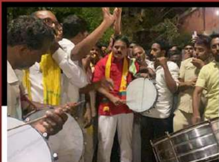
పుట్లపల్లిలో కార్యకర్తలతో కలిసి డప్పుల మోగిస్తూ నిరసన వ్యక్తం చేస్తున్న మాజీమంత్రి పల్లె రఘునాథరెడ్డి