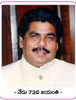
- నేడు 72వ జయంతి -