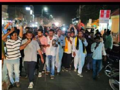
రాజంపేటలో శ్రేణులతో కలిసి విజిల్ ఊడుతూ మోతమోగిస్తున్న నాయకులు, కార్యకర్తలు