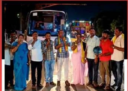
చంద్రబాబుకు మద్దతుగా విజిల్ ఊదుతున్న కార్యకర్తలు