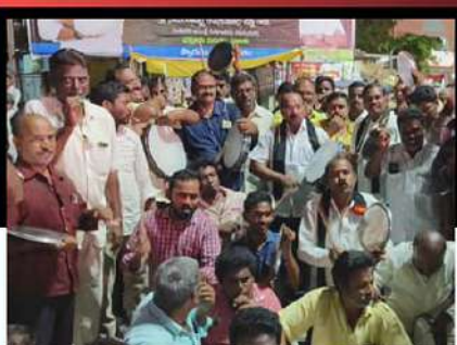
వెంకటగిరిలో కురుగొండ్ల ఆధ్వర్యంలో డప్పుకొట్టి అభినేతకు మద్దతు తెలుపుతున్న కార్యకర్తలు