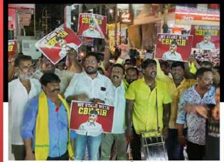
తిరువతిలో డప్పులు మోగిస్తున్న కార్యకర్తలు