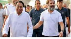
కమలినాథ్ కు సోదీ ఎవరూ మధ్యప్రదేశ్ లో లేరని, కాంగ్రెస్ గెలుపు ఖాయమని అన్నారు. దేశంలోనే అవినీతి కేంద్ర స్థానంగా మధ్యప్రదేశ్ నిలుస్తోందని శివరాజ్ సింగ్ ఛౌహాన్ హయాంలోని బీజేపీ ప్రభుత్వాన్ని ఆయన విమర్శించారు. ఈ పోరాటం కాంగ్రెస్, ఆర్ఎన్ఎస్ఐ-బీజేపీల మధ్య సిద్ధాంతాల పోరాటం, ఒకప్పుడు మాజీ శాఖ గాంధీ ఉన్నారని, మరొకప్పుడు గార్జీ ఉన్నారని పరోక్షంగా బీజేపీని తప్పుపట్టారు. బీజేపీ ఎక్కువకు వెళ్ళిన విద్యేషాలను ప్రోత్సహిస్తుందని, కాంగ్రెస్ పార్టీ ప్రేమ, గౌరవం, సౌఖ్యం తల్పానికి పాలు పడుతుందని, పేదలు, రైతులకు అభివృద్ధి పనులను నిలుపుతుందని, ఓడిపోయిన ప్రధానమంత్రి మోదీ వంటివారని విమర్శించారు. ఈ ఏడాది చివర్లో మధ్యప్రదేశ్ అసెంబ్లీ ఎన్నికలు జరగనున్నాయి.

భోపాల్ : మధ్యప్రదేశ్ అసెంబ్లీ ఎన్నికల్లో గెలుపే లక్ష్యంగా డూసుకు వెళ్తున్న కాంగ్రెస్ పార్టీ అనూహ్యంగా తమ పార్టీ ముఖ్యమంత్రి అభ్యర్థి పేరును ముందుగానే ప్రకటించింది. భోపాల్లోని షాజహాద్ శనివారంనాడు జరిగిన కాంగ్రెస్ 'ఇన్ ఆక్టో' యాత్రలో పాణ్యు కాంగ్రెస్ మాజీ అభ్యర్థుడు, చయూన్ ఎంపీ రాహుల్ గాంధీ కీలక ప్రకటన చేశారు. మధ్య ప్రదేశ్ కాంగ్రెస్ ముఖ్యమంత్రి అభ్యర్థిగా కమలినాథ్ పేరును అధికారికంగా ప్రకటించారు. దీంతో సహచేదికపై ఉన్న కమలినాథ్ ఒక్కసారిగా భారతీయగానికీ లోనయ్యారు. అంతలోనే టెప్పులిక్కి సంకేతంలో సభికులకు, వేదికపై ఉన్న అందరికీ అభివందన చేశారు. కమలినాథ్ పేరును సీఎం అభ్యర్థిగా ప్రకటించిన రాహుల్ గాంధీ ఆయన రాష్ట్రానికి మాజీ సీఎంగా చేసిన సేవలను ప్రశంసించారు. రాష్ట్రం కోసం అపారమైన అభివృద్ధి పథకాలలో కమలినాథ్ కు దాగి తెలుసునని, తన సొంతమంట్రి ఎమ్మిలో ఆయన నిరూపించుకున్నారు అన్నారు. రాష్ట్రంలో ఇండియన్ నేషనల్ కాంగ్రెస్ ప్రభుత్వాన్ని ఏర్పాటు చేస్తుందని, తన హయాంలో అసంపూర్తిగా ఉన్న పనులనుండి అయిన పూర్తి చేస్తారని రాహుల్ భరోసా ఇచ్చారు.