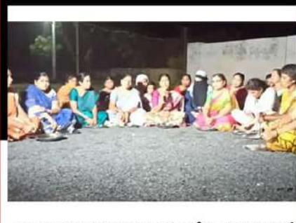
చంద్రబాబుకు మద్దతుగా బనగానపల్లెలో కంచం, గరిటలతో మోతమోగిస్తున్న తెలుగు మహిళలు