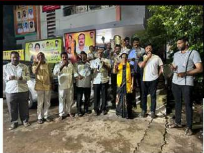
పొణ్యంలో గంటలు మోగిస్తూ ఆందోళనకు దిగిన నియోజకవర్గ టీడీపీ నేత గారు చలతరెడ్డి