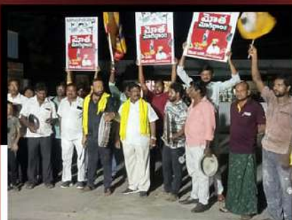
తైకలూరులో రోడ్డుపై డప్పుల మోతతో నిరసన తెలుపుతున్న కార్యకర్తలు