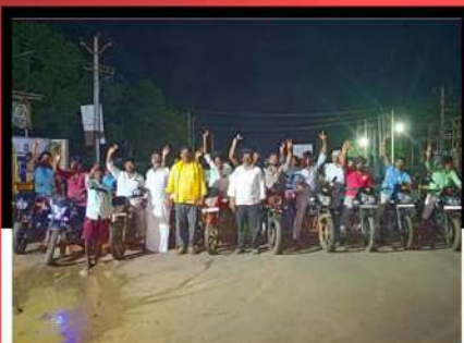
అపెజాలంలో రోడ్లపైకి వచ్చి చంద్రబాబుకు మద్దతుగా విజిల్ వేస్తూ నిరసన వ్యక్తం చేస్తున్న శ్రేణులు