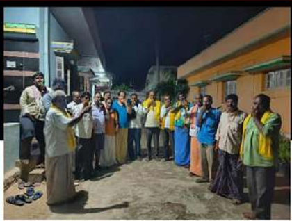
మడకశిరలో విజిల్ వేస్తూ చంద్రబాబుకు మద్దతు తెలుపుతున్న కార్యకర్తలు