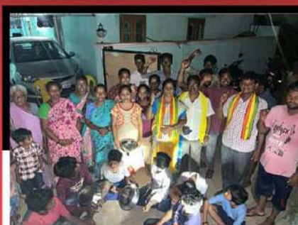
మంగళగిరి టౌన్లో కంచం, గరిటెలతో మోతమోగిస్తున్న కార్యకర్తలు