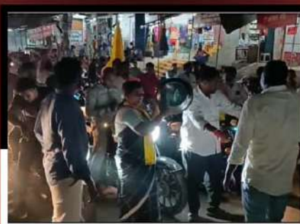
రైల్వేకోడూరులో రోడ్డుపైకి వచ్చి కంచం, గరిటెలతో మోతమోగిస్తున్న కార్యకర్తలు