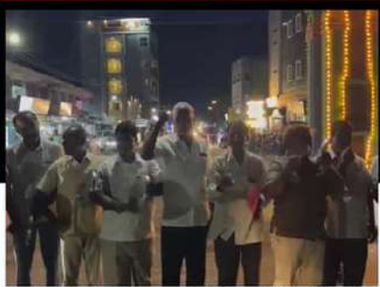
చంద్రబాబు అక్రమ అరెస్టును వ్యతిరేకిస్తూ కాణిపాకంలో కంచం, గరిటలతో నిరసన వ్యక్తం చేస్తున్న కార్యకర్తలు