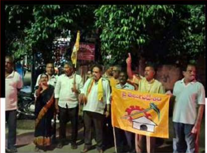
విజయవాడ సింట్రిల్ నియోజకవర్గంలో నిరసన