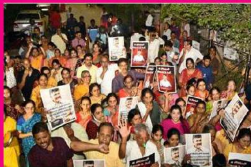
హైదరాబాద్ లో మోతమోగిస్తున్న కార్యకర్తలు