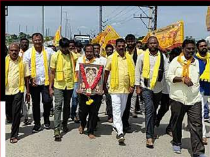
చంద్రబాబు విడుదల కావాలంటూ పలమనేరులో నిరసన ర్యాలీ చేపడుతున్న శ్రేణులు