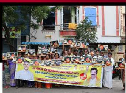
విజయవాడ సింట్రిల్ నియోజకవర్గంలో శ్రేణుల నిరసన ర్యాలీ