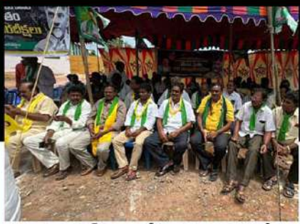
పెద్దాపురం రూరల్ ప్రాంతంలో నిరసన తెలుపుతున్న శ్రేణులు