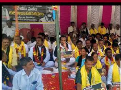
మడకశిలలో లిలే నిరాహార దీక్ష చేపడుతున్న శ్రేణులు