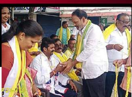
కొవ్వూరులో ద్విసభ్య కమిటీ సభ్యుల రిలే నిరాహార దీక్ష