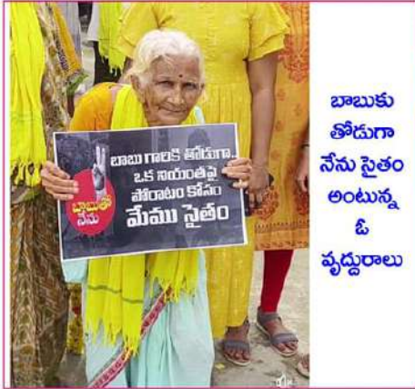
బాబుకు తోడుగా నేను సైతం అంటున్న ఓ వృద్ధురాలు