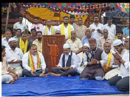
అధినేత చంద్రబాబు అక్రమ కేసుల గుంచి బయట పడాలని మైనార్టీ సోదరులతో కలిసి ప్రార్థనలు చేస్తున్న కొల్లూరిపేట