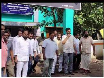
చిప్పురపల్లిలో కిమిడి నాగార్జునను అరిస్తూ చేస్తున్న పావీనులు