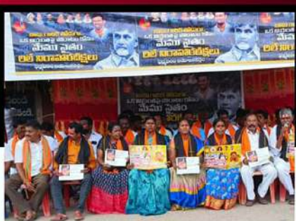
ధర్మవరంలో ఆందోళన చేపడుతున్న శ్రేణులు