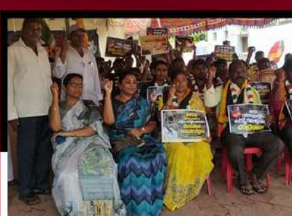
నందిగామలో ఆందోళన వ్యక్తం చేస్తున్న శ్రేణులకు సంఘీభావం తెలుపుతున్న తంగిరాల సౌమ్య