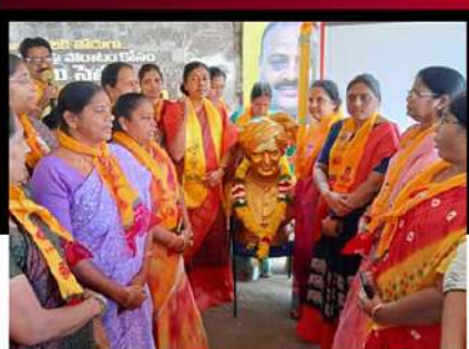
గద్దె లామరాధ ఆధ్వర్యంలో రిలే నిరాహార దీక్ష