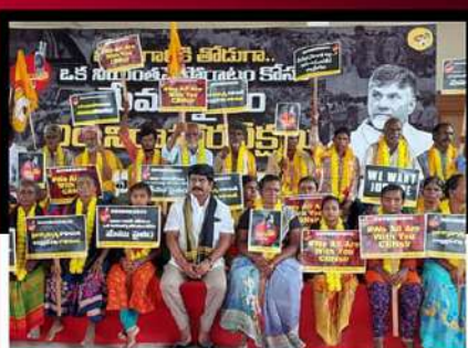
కనగిరిలో ముక్కు ఉగ్రనరసింహారెడ్డి ఆధ్వర్యంలో నిరసన