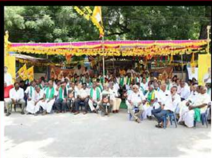
చంద్రగిరిలో ఆందోళన వ్యక్తం చేస్తున్న శ్రేణులకు పులివర్తి నాని