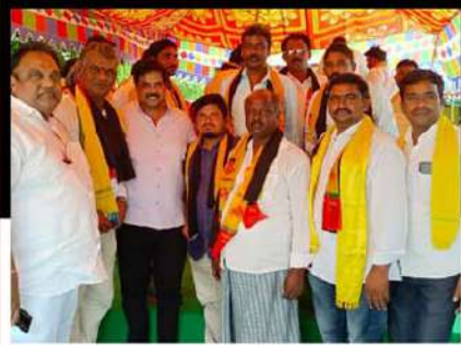
జగ్గయ్యపేటలో లిలే నిరాహార దీక్ష చేపట్టిన శ్రేణులు