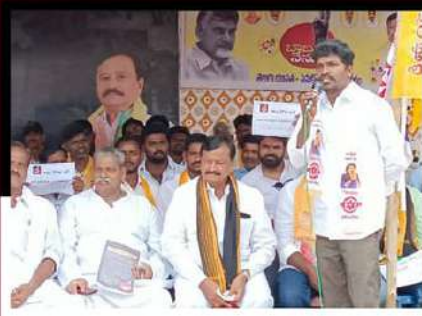
పెనుకొండలో జీకే పార్థసారథి అధ్యక్షులలో రిలే నిరాహార దీక్ష