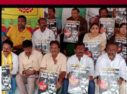
బాబుతో మొమ్మ సైతం అంటూ గుంటూరులో ఆందోళన చేపడుతున్న శ్రేణులు