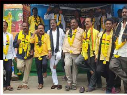
మీలూరులో ఒంటికాలుసై నిరసన తెలుపుతున్న చిత్రం