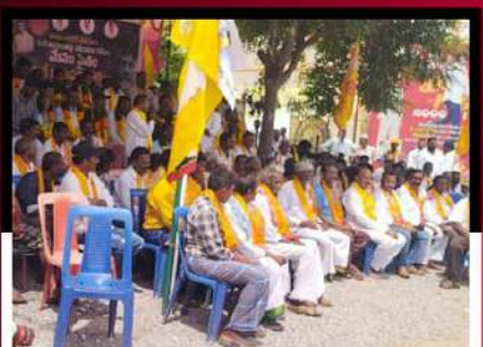
కోడూరులో రిలే నిరాహార దీక్ష చేపట్టిన టీడీపీ కార్యకర్తలు