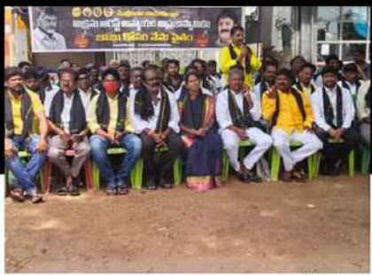
హిందూపూర్లో అధినేత అరిస్టెక్కు నిరసనగా రిలే నిరాహార దీక్ష చేపడుతున్న కార్యకర్తలు, నాయకులు