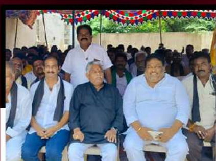
జగ్గంపేటలో జ్యోతుల నెహ్రూ ఆధ్వర్యంలో రిలే నిరాహార దీక్ష