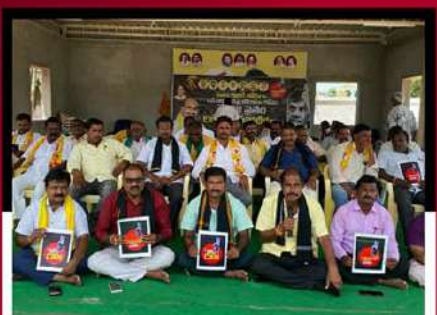
వెంకటగిరిలో శ్రేణుల రిలే నిరాహార దీక్ష