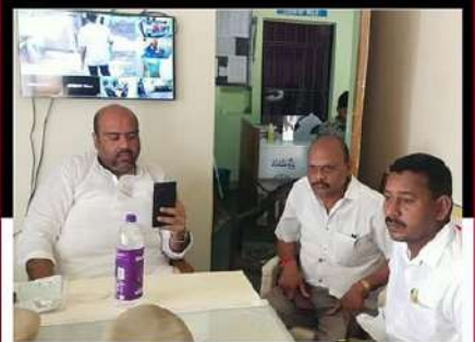
బొబ్బిలి టు సింహాచలం పార్లమెంటు చేపట్టిన జైబాబునాయనను అరిస్తూ చేయడంతో స్టేషన్ వద్ద ఆందోళన చేస్తున్న ధృత్యం