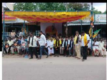
జీడి నెల్లూరులో రిలే నిరాహార దీక్ష చేపడుతున్న శ్రేణులు