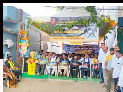
చిత్తూరు పార్లమెంట్ పరిధిలో శ్రేణుల నిరసన