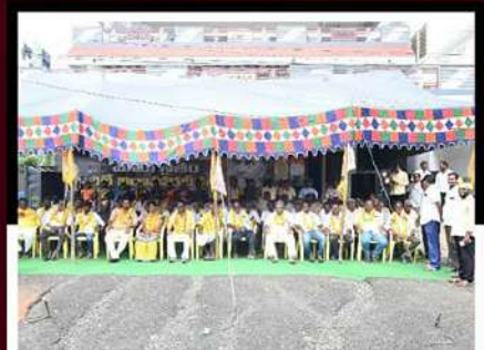
గోపాలపురంలో లిలే నిరాహార దీక్ష చేపట్టిన శ్రేణులు