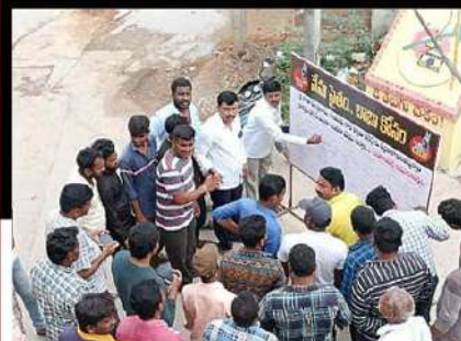
బనగానేపల్లిలో సంతకాల సేకరణ చేస్తున్న టీడీపీ శ్రేణులు