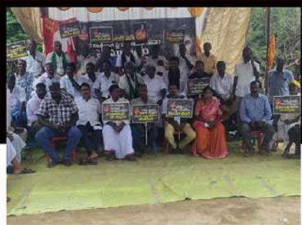
నగిరిలో సైకో పోషించి... సైకిల్ రావాలని రిలే నిరాహార దీక్ష