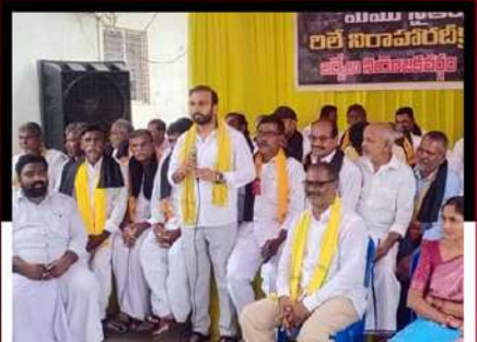
బద్వేలులో రిలే నిరాహార దీక్ష చేపట్టిన శ్రేణులు