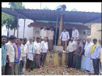
ధర్మవరం నియోజకవర్గంలోని కనగానపల్లి మండలం వేపకుంట పంచాయతీలో కొబ్బరికాయలు కొడుతున్న శ్రేణులు