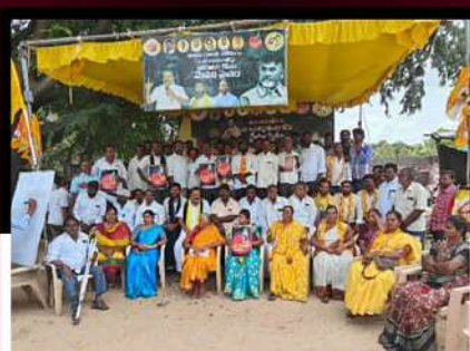
మచనపల్లిలో లిలే నిరాహార దీక్ష చేపడుతున్న కార్యకర్తలు