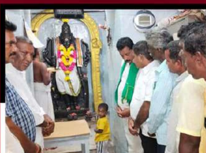
చంద్రబాబు క్షేమం కోరుతూ శీతాకాలానికి ప్రత్యేక పూజలు నిర్వహిస్తున్న టీడీపీ కార్యకర్తలు