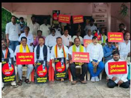
కాకినాడ రూరల్ వరసపాకల మెయిన్ రోడ్డు వద్ద ఆందోళన వ్యక్తం చేస్తున్న శ్రేణులు