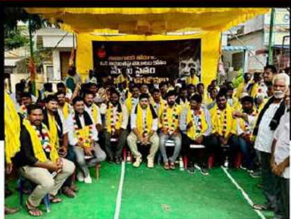
పెదకూరపాడు నియోజకవర్గం క్రోసూరులో లిలే నిరాహార దీక్ష చేపట్టిన కార్యకర్తలు