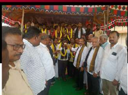
సంతనూతలపాడులో శ్రేణులచే దీక్ష విరమింప చేస్తున్న నూకపాని బాలాజీ