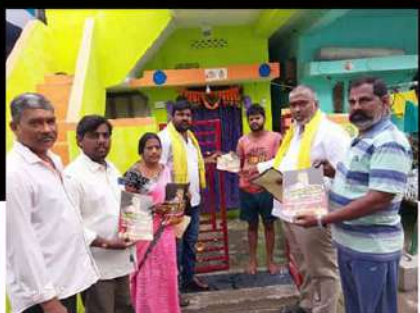
నెల్లూరులోని 47వ డివిజన్ లో కంపత్రాలు పంపిణీ చేస్తున్న జీన్ సెల్ రాష్ట్ర ఉపాధ్యక్షులు ధర్మవరం సుబ్బారావు