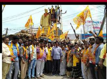
తునిలో ఆందోళన వ్యక్తం చేస్తున్న యనమల దివ్య తదితరులు