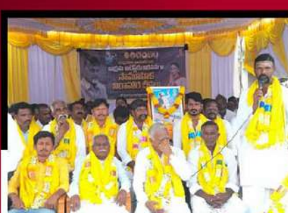
అలూరులో నిరసన తెలుపుతున్న టీడీపీ కార్యకర్తలు