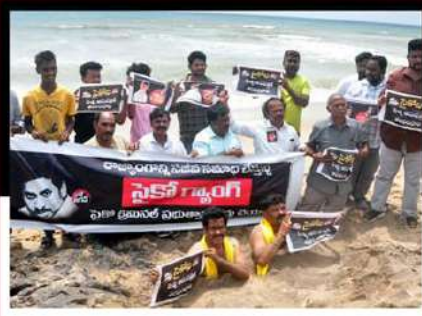
విశాఖ జిల్లాలో విమాకూర్ క్రికెట్ నిరసన