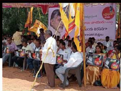
కున్పూలో పదోవ రోజు రిలే నిరాహార దీక్ష చేపట్టిన కార్యకర్తలు