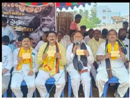
చోడవరంలో పోస్టు కార్డుల ఉద్యమం చేపడుతున్న టీడీపీ శ్రేణులు