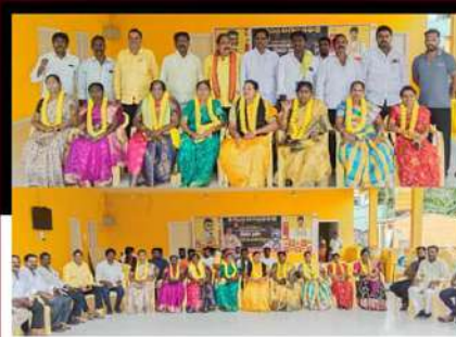
తిరువూరులో రిలే నిరాహార దీక్ష చేపట్టిన శ్రేణులు