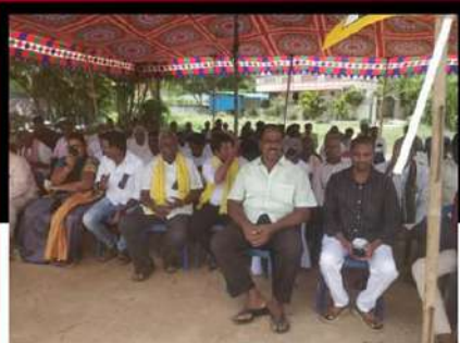
పూతలపట్టులో టీడీపీ శ్రేణుల ఆందోళన