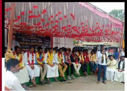
మంత్రాలయంలో లిలే నిరాహార దీక్ష చేపడుతున్న శ్రేణులు