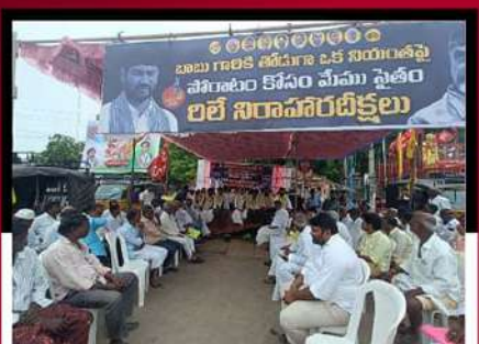
జమ్మలమడుగులో ఆందోళన వ్యక్తం చేస్తున్న శ్రేణులు