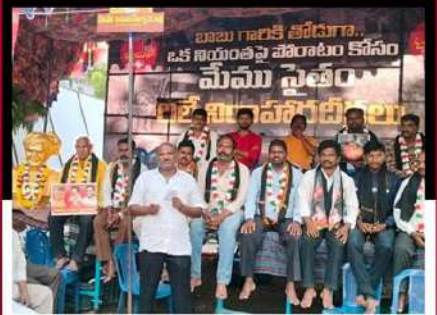
మైలవరం కొండపల్లిలో శ్రేణుల రిలే నిరాహార దీక్ష