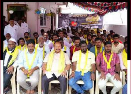
నత్తెనపల్లిలో ప్రేమలతో కలిసి ఆందోళన చేపట్టిన మాజీ మంత్రి కన్నా లక్ష్మీనారాయణ