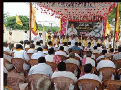
కమలాపురంలో ఆందోళన వ్యక్తం చేస్తున్న నేతలు, కార్యకర్తలు