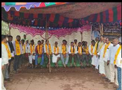
శ్రీశైలం నియోజకవర్గం ఆత్మకూరులో నిరసన తెలుపుతున్న టీడీపీ శ్రేణులు