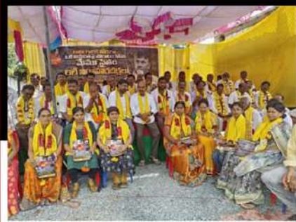
నంద్యాలలో భూమా బ్రహ్మానందారెడ్డి, ఫరూక్ రిలే నిరసన