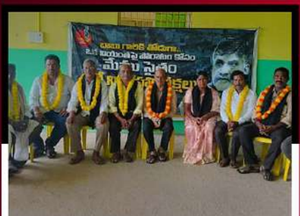
రల్లిలో ఆందోళన వ్యక్తం చేస్తున్న శ్రేణులు