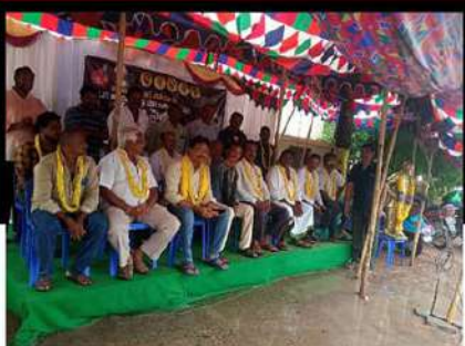
అవనిగడ్డలో అధినేత అరిస్తున్న ఆందోళన వ్యక్తం చేస్తూ రిలే నిరాహార దీక్ష చేపట్టిన టీడీపీ శ్రేణులు