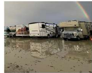
కొన్ని బస్సులను నెవార సమీపంలోని గెర్లాన్ వద్ద సిద్ధంగా ఉంచారు. బైడ్ ఫర్ మైన్ అక్కరపడక పరిస్థితులు నెలకొంటే స్పందించేందుకు మిల్గా వీల్ వాన్ లో ఛార్జీ-వీల్ డ్రైవ్ వాహనాలను, ఆల్ డెస్ట్రో బైరన్ సిద్ధంగా ఉంచాలని నిర్వాహకులు కోరారు. బిల్లింగ్ మ్యాన్ ఫెస్టివల్ ప్రతినిధి ట్లార్క్ రాక్ ఏడాదిలో జరుగుతుంది. ఈ ఫెస్టివల్ చివరి లో అన ఛార్జీ మనిషిగోమ్మును దహనం చేస్తారు. ఈ వేడుకకు ఛార్జీ సంఖ్యలో ప్రజలు హాజరవు తారు. ఈ ఏడాది అన్ని ఇబ్బందులున్నా.. నేటి రాత్రి వాతావరణం అనుకూలమై మనిషి బోమ్మును దహనం చేసే అవకాశం ఉందని నిర్వాహకులు పేర్కొన్నారు. సోమవారం ఎండ వస్తే పరిస్థితి కొంచెం మెరుగుపడవచ్చని భావిస్తున్నారు.

ఇబ్బంది పడిన వారిలో హాల్ వద్ద కమ్మేయన్ క్రెస్టిన్ డీజీ డిఫ్ఫె వంటి ప్రముఖులు కూడా ఉన్నారు. వీరు దాదాపు నాలుగు గంటల పాటు బయటలో నడిచారు. చివరికి ఓ అభిమాని వీరిని తన పికప్ ట్రక్ ఎక్కించుకునేందుకు ముందుకు రావడంతో బయటపడ్డారు. ఈ విషయాన్ని డీజీ డిఫ్ఫె తన ఇన్స్టాలో వంతుకొన్నారు. ఏడాదిలో జరిగే ఫెస్టివల్లో.. ఏకంగా 70 వేల మంది బురద హాజరయ్యారట. వీరింతా అకాల వర్షంతో బురద లో చిక్కుకుపోయారు. ప్రస్తుతం ట్లార్క్ ఏడాది లోని బురదపై ప్రయాణించేందుకు వాహనాలను అనుమతించడంలేదు. దీంతో కొందరు హుల్లం సుమారు 6 మైళ్లు బురదలోనే నడుచు కుంటూ ప్రయాణించేందుకు సిద్ధపడ్డారు. ట్లార్క్ రాక్ ఏడాది బురదలో వేల మంది చిక్కుకు పోయిన విషయాన్ని ఆదివారం అధికారులు దేశాధ్యక్షుడు జో బైడెన్ దృష్టికి తీసుకెళ్లారు. ఈ విషయాన్ని శ్వేత సౌధం కూడా ద్రువీకరించింది. ఆయన కార్యదర్శన స్థానిక అధికారులతో కలిసి పరిస్థితిని పర్యవేక్షించింది. బిల్లింగ్ మ్యాన్ నిర్వాహకుల సూచనలను అనుసరించి అక్కడే ఉండిపోయిన వారికి సిల్వోన్, వైల్డ్ సౌకర్యాలను అందించేందుకు ఏర్పాటు జరుగుతున్నాయి. నడుచుకుంటూ బయటపడేందుకు ప్రయత్నిస్తున్న వారిని ఎక్కించుకోవడానికి