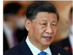
అమరులయ్యారు. ఈ ఘటనలో చైనా, భారత్ మధ్య ఉద్రిక్తతలు పెరిగిపోయాయి. అలాగే భారత్ ఒకవైపు జే20 సదస్సుకు ఏర్పాటు చేస్తుంటే.. చైనా సరికాక మూర్ఖ