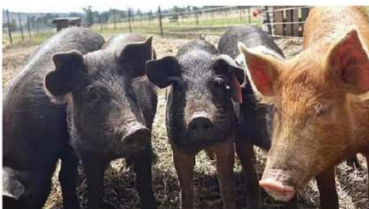
- కరోటీ ఫైత్ 1000 ఎదుల నిర్మూలన

న్యూఢిల్లీ : అసోంలో అఫ్రికన్ స్టైస్ ఫీవర్ విజ్ఞానస్థులను, లఖింపూర్ జిల్లాలో అఫ్రికన్ స్టైస్ ఫీవర్ కేసుల సంఖ్య వేగంగా పెరుగుతున్నది. ఈ నేపథ్యంలో ఈ స్టైస్ ఫీవర్ ఇతర జిల్లాలకు పాకకుండా కట్టడి చేయడం కోసం అధికారులు చర్యలు చేపట్టారు. అఫ్రికన్ స్టైస్ ఫీవర్ విస్తరణకు ప్రధాన కారణమైన పందుల నిర్మూలనకు జిల్లాలోని పశు సంవర్ధక శాఖ అధికారులు దృష్టి సారించారు. అందులో భాగంగా ఇప్పటివరకు వెయ్యి పందులను కరికెట్ ఫైత్ పెట్టి చంపేశారు. ఈ విధాన ప్రారంభంలో కూడా ఇతర రాష్ట్రాల్లో అఫ్రికన్ స్టైస్ ఫీవర్, ఏపీయస్ ఇన్‌ఫ్లూయెంజా విస్తరణంది. దాంతో అసోంలోకి ఆ వ్యాధులు ప్రవేశించకుండా రాష్ట్ర ప్రభుత్వం, ఇతర రాష్ట్రాల నుంచి పందులు, ఫోల్డ్లీ చేరవేతన్ని నిషేధం విధించింది. వరిస్థితి మెరుగుపడిన తర్వాత ఆ విషయాన్ని ఎత్తివేసింది. కాగా, అఫ్రికన్ స్టైస్ ఫీవర్‌ను కలుగుతూనే వైరస్ అప్పిరివిరస్ కుటుంబానికి చెందిన పెద్దదైన డయల్ ప్రొటోడెక్ డీఎన్ఎ వైరస్, చందుల ద్వారా వ్యాపించే ఈ వైరస్ వల్ల బంతువుల్లో మరణం రేటు భారీగా ఉంటుంది.