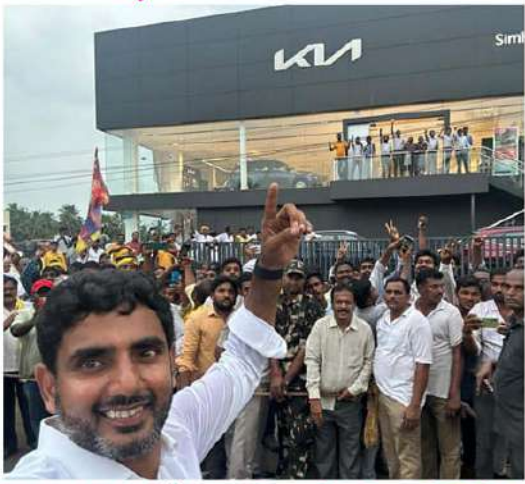
వైట్ ఫ్యాట్ వైరస్ కంటే ప్రమాదకరం జగనోరా వైరస్! ఆక్సా రైతులకు రూ. 1.50కే యూనిట్ విద్యుత్ ఇస్తాం 4

ఇది భీమవరంలోని కియా కార్ల షోరూమ్. దేశంలోనే అత్యంత దుర్భిక్ష ప్రాంతంగా పేరొందిన అనంతపురం జిల్లాకు కియా కార్ల పరిశ్రమను రప్పించి, ఉద్యోగాల పంట పండించారు దార్శనిక నేత చంద్రబాబునాయుడు. ఈ పరిశ్రమ ద్వారా రాష్ట్రవ్యాప్తంగా సుమారు 50 వేల మంది యువతకు ప్రత్యక్షంగా, పరోక్షంగా ఉద్యోగాలు లభించాయి. 51నెలల జలగన్న పాలనలో చేసినదేమిటి? ఫ్యాక్స్ కాన్, అమర్ రాజా, జాకీ, లులూ వంటి పరిశ్రమలను పొరుగు రాష్ట్రాలకు తరలించారు. ఉన్నత చదువులు చదివిన యువతకు ఉద్యోగాభివృద్ధి చేతగాక చేపల దుకాణాలు, మటన్ మార్కెట్లు పెట్టించారు. అభివృద్ధి ప్రదాత ఎవరో, విధ్వంసకపాలనతో రాష్ట్రాన్ని భ్రష్టు పట్టించింది ఎవరో అర్థమైందా రాజా...?! - నారా లోకేశ్ (యువగళం పాదయాత్ర నుండి)