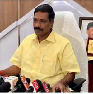
ముఖ్య నాయకులపై బనాయింపిన అక్రమ కేసులకు సంబంధించి ఆయన స్పందించారు.