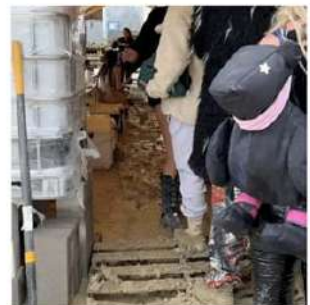
అమెరికా, నెవాడలో బురద మయంగా మారిన ట్లార్క్ రాక్ ఏడాది నుంచి బయటపడేందుకు వేల మంది నరకయాతన పడుతూ నడుస్తున్నారు. ట్లార్క్ రాక్ ఏడాదిలో బిల్లింగ్ మ్యాన్ ఫెస్టివల్ ప్రత్యేకం నిలుస్తుంది. అసలే పర్వతలను అంటే మోహుపడే.. వారాల లాలను బాగా ఎంబాయ్ చేయాలని తమింటి అమెరికన్లకు ఇంట్ టూరిస్ట్ స్పాట్. ఇలానే కొందరు గత వారం తలతో ట్లార్క్ రాక్ ఏడాదికి వచ్చారు. వర్షం కురువడం అనకు న్నారు. వారి అంచనాను తలకిందులు చేస్తూ వాస ముంకెళ్లింది. ఆ రెట్లకు ఏడాది బురద మయంగా మారిపోయింది. ఇక్కడ చిక్కుకుపోయి

ఇబ్బంది పడిన వారిలో హాల్ వద్ద కమ్మేయన్ క్రెస్టిన్ డీజీ డిఫ్ఫె వంటి ప్రముఖులు కూడా ఉన్నారు. వీరు దాదాపు నాలుగు గంటల పాటు బయటలో నడిచారు. చివరికి ఓ అభిమాని వీరిని తన పికప్ ట్రక్ ఎక్కించుకునేందుకు ముందుకు రావడంతో బయటపడ్డారు. ఈ విషయాన్ని డీజీ డిఫ్ఫె తన ఇన్స్టాలో వంతుకొన్నారు. ఏడాదిలో జరిగే ఫెస్టివల్లో.. ఏకంగా 70 వేల మంది బురద హాజరయ్యారట. వీరింతా అకాల వర్షంతో బురద లో చిక్కుకుపోయారు. ప్రస్తుతం ట్లార్క్ ఏడాది లోని బురదపై ప్రయాణించేందుకు వాహనాలను అనుమతించడంలేదు. దీంతో కొందరు హుల్లం సుమారు 6 మైళ్లు బురదలోనే నడుచు కుంటూ ప్రయాణించేందుకు సిద్ధపడ్డారు. ట్లార్క్ రాక్ ఏడాది బురదలో వేల మంది చిక్కుకు పోయిన విషయాన్ని ఆదివారం అధికారులు దేశాధ్యక్షుడు జో బైడెన్ దృష్టికి తీసుకెళ్లారు. ఈ విషయాన్ని శ్వేత సౌధం కూడా ద్రువీకరించింది. ఆయన కార్యదర్శన స్థానిక అధికారులతో కలిసి పరిస్థితిని పర్యవేక్షించింది. బిల్లింగ్ మ్యాన్ నిర్వాహకుల సూచనలను అనుసరించి అక్కడే ఉండిపోయిన వారికి సిల్వోన్, వైల్డ్ సౌకర్యాలను అందించేందుకు ఏర్పాటు జరుగుతున్నాయి. నడుచుకుంటూ బయటపడేందుకు ప్రయత్నిస్తున్న వారిని ఎక్కించుకోవడానికి