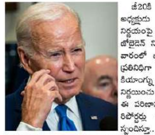
గరువ్యాసు.. కానీ, నేను ఆయనను కలిసేందుకు వెళ్తున్నాను" అని ముక్తసరిగా పేర్కొన్నారు. కానీ, వీరి సమావేశం ఒక్కడ జరుగుతుందనే సమాచారం మాత్రం వెల్లడించలేదు. ఈ ఏడాది సెప్టెంబర్ 7-10 మధ్యలో జైడెన్ జే20 సదస్సు పర్యటన జరుగుతుంది. అనంతరం వియత్నాంలో

పర్యటించనున్నారు. ఈ పర్యటనపై జైడెన్ స్పందిస్తూ.. ఆయా దేశాల్లో మరత సమస్యలను చేసుకోవాల్సి ఉందన్నారు. ఆరే సమయంలో భారత్, వియత్నాం కూడా అమెరికాతో సంబంధాలను బలపర్చుకోవడానికి అసక్తి చూపుతున్నాయన్నారు. వాస్తవానికి గతంలో తాను భారత్ వెళ్తానని జిన్ పింగ్ వెల్లడించారు. కానీ, గరువారం చైనా విదేశాంగ శాఖ నిర్వహించిన సాధారణ ప్రెస్ మీట్ లో ఈ పర్యటనపై విరళీకృత ప్రశ్నించగా.. కచ్చితంగా అధికారులు చెప్పలేకపోయారు. ఆరే సమయంలో జిన్ పింగ్ ఈ ఏడాది జే20కి హాజరుకొనడానికి నిర్ణయించుకున్నట్లు ప్రతిభా కథనాలు చెప్పాయి. భారత్-చైనా సంబంధాలు బాగా బలపడిన పరిస్థితిలో ఉన్న సమయంలో జిన్ పింగ్ గైరాజరు.. పరిస్థితిని మరత దిగజారుస్తుంది. గత వారం చైనా సరికాక మూర్ఖ జూరీ చేయడం జరు చేశారు మధ్య మరో వివాదాన్ని రాజీపింది. జైడెన్-జిన్ పింగ్ గతేడాది బాలి దీపిగ సదస్సులో భేటీ అయ్యారు. వీరు ఈ ఏడాది నవంబర్ లో కూడా భేటీ అయ్యే అవకాశాలున్నాయి. ఆ నెలలో క్యాన్టాన్ లో ఆయా-పసిఫిక్ ఏకనామిక కో-ఆపరేషన్ సదస్సు నిర్వహించనున్నారు. ఈ భేటీకి జిన్ పింగ్ హాజరయ్యే అవకాశం ఉంది.