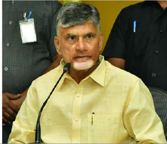
- మిగతా 2లో..

న్యూఢిల్లీ: ఆంధ్రప్రదేశ్ కు ఉన్న అతిపెద్ద సమస్య సీఎం జగన్ అని టీడీపీ అధినేత చంద్రబాబునాయుడు విమర్శించారు. జగన్ ఓడిపోతేనే రాష్ట్రం బాగుపడుతుందని ఆభిప్రాయం వ్యక్తం చేశారు. ఢిల్లీలో మంగళవారం మీడియాతో పిచ్చాపాటిగా చంద్రబాబు మాట్లాడుతూ.. టీడీపీ ఎప్పుడూ జాతీయ భావంతో ఉండే పార్టీ అని.. జాతీయ రాజకీయాలతో పార్టీకి ప్రత్యేక అనుబంధం ఉండవచ్చు. ప్రత్యేక హోదా అంశంపైనే కేంద్రంలోని నరేంద్ర మోదీ ప్రభుత్వంతో విభేదించినట్లు చెప్పారు. మిగతా విషయాల్లో కేంద్రంతో ఎలాంటి భేదాభిప్రాయాలు లేవని వెల్లడించారు. ఈ విషయాన్ని గతంలో చాలాసార్లు చెప్పారని అన్నారు. 80వ దశకం నుంచే టీడీపీ జాతీయ కూటముల్లో భాగంగా ఉండవచ్చు. ఇండియా కూటమికి నాయకుడు లేకపోవడం టీడీపీకి అనుకూల అంశం అన్నారు. ఇండియా కూటమి ఎలా ముందుకు వెళ్తుందో చూడాలి. ఎంతో రాజకీయ అనుభవం ఉన్నవాళ్లే మోదీని విమర్శించడం లేదు. మోదీ భారత్ కు ప్రపంచ వ్యాప్తంగా గుర్తింపు తెచ్చారు.