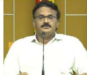
1. రైతుభరోసా : గత తెలుగుదేశం ప్రభుత్వం రైతుభరోసా అమలుచేసి రైతులకు అందిగా ఉంది... అప్పుట్లో రైతులకు అందిన సాయం కంటే జగన్ రెడ్డి రైతు భరోసా కింద తక్కువే అందుతుందని యనమల చెప్పారు. 2014-19 కాలంలో అప్పుటి తెదేపా ప్రభుత్వం రైతులకు రూ.మాత్రం కోపే రూ. 15,700 కోట్లు ఇవ్వడంతో పాటు, అన్నదాతా సుభిక్షం కింద అదనంగా రూ.5వేల కోట్లు ఇచ్చి మొత్తం రూ.21వేల కోట్లు రైతులకు తెలిపారు. జగన్ రెడ్డి ఇప్పుటివరకు రైతులకు కోపే కేవలం రూ.15వేలకోట్ల వైదొలగడం మాత్రమే మిగిలిన పదహారేల కోపే రూ.5వేల కోట్లు ఖర్చుచేసినా గతంలో చంద్రబాబు చెల్లించిన దానికంటే తక్కువే అని యనమల స్పష్టం చేశారు.

పెంచారు... ఇవి మోసంతో కూడిన నాలుగవ నవరత్నమని యనమల ఎద్దేవా చేశారు.