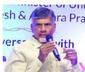
సంకల్పానికి నేను వందనం చేస్తున్నానన్నారు. దేశ అనంతయానానికి ఇది ప్రారంభం అన్నారు.

మాజీ ముఖ్యమంత్రి, టీడీపీ అధినేత చంద్రబాబు టీవీలో మాట్లాడుతూ ఇలాంటి అభినందనలు తెలిపారు. చంద్రుడిపై భారత్ కాలుమోపింది. ఈ రోజు మనమంతా చరిత్ర సృష్టించామని అన్నారు. చంద్రుని దక్షిణ భ్రమంపై చంద్రయ్యాన విజయవంతంగా ల్యాండ్ అయ్యిందని, ఈ ఘనతను సాధించిన ఏకైక అంతర్జాతీయ సంస్థగా ఇన్ఫో అవతరించింది అని కొనియాడారు. భారతదేశ ఆంతర్జాతీయ పరిశోధన కార్యక్రమాన్ని చంద్రునిపైకి, ఇంకా వెలులకు తీసుకెళ్లాలనే ఇన్ఫో శాస్త్రవేత్తల అవసరమైన సూక్ష్మ, దృఢ