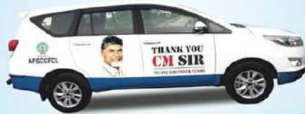
APSCCFCL - ఆంధ్రప్రదేశ్ షిడుక్కులు కులాల ఆర్థిక సహకార సంస్థ

ఆత్మగౌరవం, ఆత్మవిశ్వాసం మా నినాదం. ఆచరించి చూపడం మా ప్రభుత్వ విధానం.