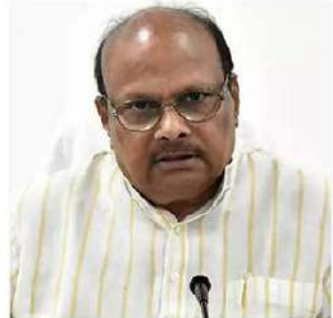
2014-19 మధ్య తెలుగుదేశం హయాంలో చేసిన అప్పుల కన్నా వైసీపీ ప్రభుత్వం రెండున్నర రెట్లు ఎక్కువ అప్పులు చేసింది. 1 లక్ష కోట్లు అని డి

అధికారంలో సూచన యనమల లేఖ రాశారు. కేంద్ర ప్రభుత్వాన్ని మోసం చేస్తూ... కాగ్ తప్పుడు సమాచారం జస్టూ రాష్ట్ర ప్రభుత్వం అందించిన అంశాలను యనమల ప్రశ్నించారు. కాగ్ 2022 ఆడిట్ నివేదికలో ప్రస్తావించిన అంశాల ఆధారంగా రాష్ట్ర ప్రభుత్వం చేసిన అప్పులు, తప్పులపై వాస్తవాల చెప్పాలని డిమాండ్ చేశారు. రాష్ట్ర అప్పులు రూ. 10 లక్షల కోట్లకు చేరిన వైదాన్ని వివరించారు. ఈ వివరాలపై ప్రభుత్వ పరంగా పూర్తి వివరాలతో సమాధానం చెప్పాలని డిమాండ్ చేశారు. తెలుగుదేశం ప్రభుత్వం 2014-19 పాలనలో రూ. 1.39 లక్షల అప్పులు మాత్రమే చేసింది. ఎఫ్ఆర్ డిఎం పరిమితికి లోబడి మాత్రమే నాడు డీడీపీ ప్రభుత్వం అప్పులు చేసింది.