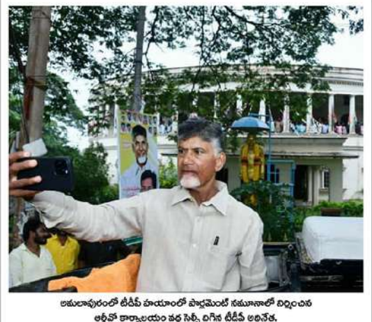
అమలాపురంలో లీడీమ్ హయాంలో పార్లమెంట్ నకుగానూలో నిర్మించిన అక్కడ కాపులకు వద్ద స్పర్శింగ్ లీడీమ్ అధినేత.

రోడ్లకు కూడా నేయలేకపోతున్నారు. బద్ద లేని ఈ సీఎం ప్రజలకు డెబ్బులన్నీ రోడ్ల ద్వారా నరకాన్ని చూపుతున్నారు. సాగు నీటి కాలువల్లో పూడికలు తీయలేదు. లాకులకు గ్రీజుకూడా రాయలేదు. కాలు వల నిర్వహణ సరిగ్గాలేక చివరి భూములకు నీరు రావడంలేదు. ప్రభుత్వం వ్యవస్థలను నాశనం చేయడంవల్లనే ఈ దుస్థితి వచ్చింది. రాష్ట్రం రాష్ట్రం... ఈ ముఖ్య మంత్రి కాళ్ళుకొడుకొడుకొడు చంద్రబాబు స్వస్థం చేశారు.