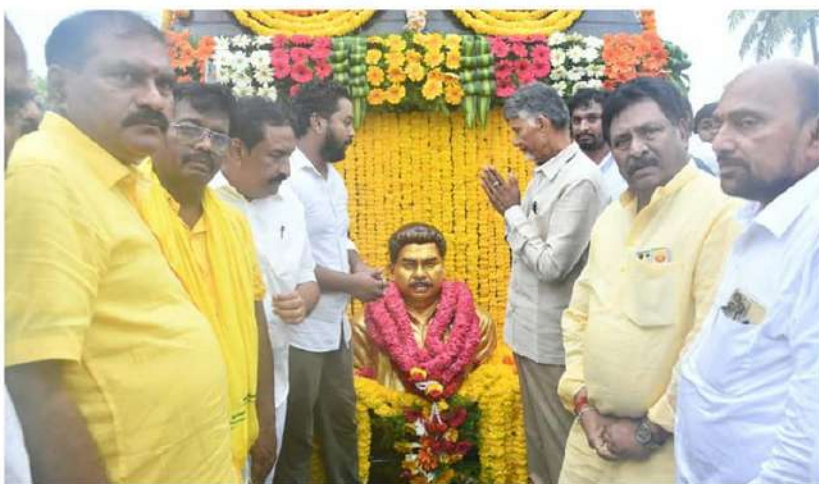
అమలాపురంలో లోక్ సభ మాజీ స్పీకర్, డిఎన్ డి బాలయోగి ఘోష్ వద్ద సభాపలు లభించిన డీఎమ్ జాతీయ అధ్యక్షులు నారా చంద్రబాబు నాయుడు

ఈ వెల 15న తాము విడుదల చేసిన విజన్ - 2047 పూర్వకాల అమలాపురం వంటి ప్రాంతానికి కూడా ప్రయోజనం చేకూరుతుందని, నేటి కీలక తరుణంలో స్పష్టమైన ఆలోచనలు కలిగిన నాయకత్వం చాలా అవసరమని తెలుగుదేశం అధినేత చాలా చంద్రబాబునాయుడు వ్యాఖ్యానించారు. తుక్కదాం నాయుడు 'అమలాపురం ప్రగతి కోసం ప్రజా వేదిక' సదస్సులో మాట్లాడుతూ పలు కీలక విషయాలపై తమ అభిప్రాయాలను పంచుకున్నారు.