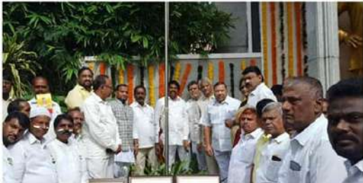
హైదరాబాద్ లోని టీడీపీ ప్రధాన కార్యాలయంలో స్వాతంత్ర్య దినోత్సవ వేడుకలు ఘనంగా జరిగాయి. ఈ సందర్భంగా పార్టీ

హైదరాబాద్ లోని టీడీపీ ప్రధాన కార్యాలయంలో పంద్రాగస్టు వేడుకలు