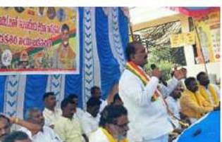
సమావేశం నిర్వహించారు. ఈ కార్యక్రమంలో మదకశిర నియోజకవర్గ పరిశీలకులు పులిచెందుల పార్లమెంటరీ రెడ్డి తదితరులు పాల్గొన్నారు.