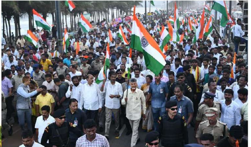
విశాఖ ఆర్బీ జేఎన్ రోడ్డులో మంగళవారం సాయంత్రం 2.5 కి.మీ మేర యూబిటీ వాక్లో పాల్గొన్న చంద్రబాబు