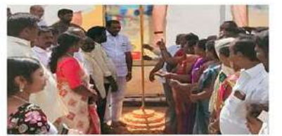
కావలి (చైతన్యరథం): మనకు స్వాతంత్ర్యం వచ్చిన సంగతి

కావలిలో 77వ స్వాతంత్ర్య దినోత్సవ వేడుకలు