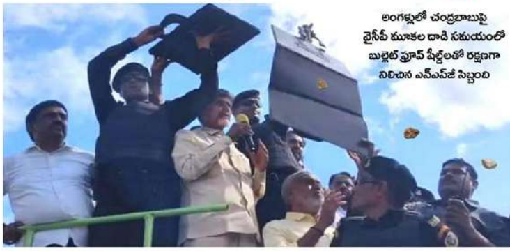
అంగళ్లలో చంద్రబాబుపై వైసీపీ మూకల దాడి సమయంలో బులెట్ ప్రూఫ్ షీట్లతో రక్షణగా నిలిచిన ఎన్ఎన్జి సిబ్బంది

సోగసీటి ప్రాజెక్టుల విధ్వంసంపై యుద్ధచేరి యాత్ర ఉమ్మడి చిత్తూరు జిల్లాలోకి ప్రవేశించినప్పుడు గత శుక్ర వారం దాడు తనపై జరిగిన దాడులు, హత్యాప్రయత్నానికి సంబంధించిన ఘటనలను తెదేపా జాతీయ అధ్యక్షులు నారా చంద్రబాబు నాయుడు నిన్న విజయనగరంలో విలేజరుల సమావేశంలో, ఆ ఘటనల తాలూకా వీడియోల ఆధారంతో పూసగుచ్చినట్లు వివరించారు. మంత్రి పెద్దిరెడ్డి ప్రిన్స్ ప్రకారం అంగళ్లు, పుంగమారు లైహెచ్ వద్ద తనపై దాడులు, హత్యాయత్నం జరిగితే నిన్న తనపై రెండు ఎఫ్.ఐ.ఆర్ లు రిజిస్టర్ చేయడంపై స్పందిస్తూ, ఈ కుట్ర కారణాలను చంద్రబాబు వెల్లడించారు. రాష్ట్ర వ్యాప్తంగా జగన్మోడీ సోగసీటి ప్రాజెక్టులను నాశనం చేసిన తీరుని వివరించేందుకు 2,500 కిలోమీటర్ల మేరకు తనయాత్ర జరుగుతున్నప్పుడు.. ఇందులో భాగంగా కాంట్రాక్టర్ మంత్రి పెద్దిరెడ్డి దోపిడీని వెల్లడించినందున తనపై దాడులకు తల పడ్డారని ఆయన తెలిపారు. జగన్ ప్రభుత్వం రాష్ట్రంలో జరుగుతున్న నేరాలు ఘోరాల్లో పోలీసుల్ని భాగస్వామి చేస్తోందని దుయ్యబట్టారు. - మిగతా 2లో..