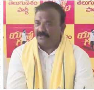
కట్టుకోవాల్సిన ఖర్చు చంద్రబాబుకు లేదని యరపతినేని స్పష్టం చేశారు. తాడేపల్లి కొంప అవినీతి డబ్బుతో కట్టారు. అక్ష కోట్ల అవినీతి చేసిన ఖైదీ నెంబర్ 6093 కట్టాడే ఆ తాడేపల్లి కొంప. మీమా, మాకు రాజకీయాల్లో పోలికే లేదు. మీరు సరహంతకులు. మా అధినేతని పది మందికి తుంటివేళ్ళ కుటుంబం, కార్యకర్తలు

త్రాంగెడి విక్టర్ తీసిన రూ. 5000 పాపాలు చీపి విక్టర్ అమ్మకా నెలకు రూ. 1000 కోట్లు సంపాదిస్తున్నారు. నాసిరకం మధ్యంతో 60వేల మంది ప్రజలును తీశారు. అక్ష మందికిపైగా ఆ విషయం నీరు తాగి పక్షవాతి పారిన పద్దారు. జగన్ రెడ్డి చిన్న సైకో అయితే కాసు చిన్న సైకో. గురజాల, మావర్ల నియోజకవర్గాల్లో తెలంగాణ నుంచి మధ్యం తెచ్చి అమ్మడం ద్వారా రోజూ ఎమ్మెల్యేకి రూ. కోటి అందుతోంది. తాడేపల్లిలో ఉండే సైకో, గురజాలలో ఉండే సైకోలా మేము ఎవరి పొట్టు కొట్టలేదు. హైదరాబాద్ లో చంద్రబాబు ఇల్లు సారా డబ్బుకో కట్టారని విమర్శిస్తున్నారు. అయిన ఇల్లు ఎప్పుడు కట్టాలో మీకు తెలుసా? సారాయికో ఇల్లు