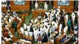
ప్రధాని కూడా చేలం జడరు వృత్తులు అమితే షా, అదాని మాటలనే వింటారని జతరలను ఎవరని లెక్క చేయని రాహుల్ అన్నారు.