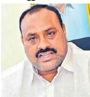
సమయంలో తెలుగుదేశం పార్టీ కార్యకర్తల ఒంటి నుండి చిందిన ప్రతిరక్తపు బొట్టుకూ బదులు చెప్పి తిరుకామని అచ్చెన్నాయుడు హెచ్చరించారు.

అమరావతి: పుంగనూరు, అంగళ్లులో రచ్చ చేసి, దారులకు ఉసిగొల్పిన జగన్ రెడ్డి... చంద్ర బాబుపై కేసు నమోదు చేయించడం ఆయన అత్యున్మానకమ అద్దం పడుతోందని టీడీపీ రాష్ట్ర అధ్యక్షుడు కింజరాపు అచ్చెన్నాయుడు విమర్శించారు. సాగునీటి ప్రాజెక్టుల విధ్వంసంపై నారా చంద్ర బాబు చేపట్టిన యుద్ధభేరితో జగన్ రెడ్డి వెన్నులో వణుకు మొదలైందని బుద్ధవారం ఒక ప్రకటనలో అచ్చెన్నాయుడు పేర్కొన్నారు. ప్రజాస్వామ్యంపై చంద్ర బాబు సందించే ప్రశ్నలకు సమాధానం చెప్పలేక, రోడ్ బోలకు వస్తున్న జనాభరణ చూసి అపహాసంతో తప్పుడు కేసులతో భయపెట్టేందుకు ప్రయత్నిస్తున్నారు. జగన్ రెడ్డి చేస్తున్న పిల్ల చేష్టలు చూస్తుంటే ఖాతేసింది. తెలుగుదేశంపార్టీ చర్యలనుకు సంబంధించిన పెద్దవారే జగన్ రెడ్డిని కారాకం లో వైసీపీ కార్యకర్తల రాబిలు, భర్తలకు అధికారులు ఎలా అనుమతిస్తున్నారు? జెండాలు పట్టుకుని రచ్చగొట్టింది ఎవరు? పులివెందులలో కారులో వచ్చి రిచ్చగొట్టి, టీడీపీ క్రేజుల తిరుగుబాటుతో వైసీపీ నేతలు తోక ముడిచారు. తెలుగుదేశం పార్టీ శ్రేణుల్లో కనిపిస్తున్న ఉత్సాహం, చంద్రబాబు సభలకు, బేరసరినైన అంశాలకు ప్రజల నుండి మెరుగైన స్పందన వస్తుండడంతో... ఏం చేయాలో తెలియని స్థితిలో దారులకు తెగబడుతున్నారు. దారులు చేసిన వారినే వదిలేసి, బాధితులపై కేసులు పెట్టడం జగన్ రెడ్డిచే చెల్లింది. ఎన్ని కేసులు పెడతావో పెట్టతావో... ఎంత మందిని అరెస్టు చేస్తావో చేసుకో. చాందివదిలిన ప్రతి కార్యకర్తకు తెలుగుదేశం పార్టీ అందంగా నిలుస్తుంది. న్యాయం చేస్తుంది. అదే