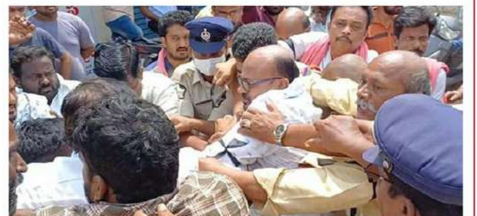
గుడివాడలో కొదావి నాసికీ వ్యతిరేకంగా నిరసన వ్యక్తం చేస్తున్న మోగా అభిమానులు

వ్యక్తం చేశారు. పెద్ద ఎత్తున తరలి వచ్చిన మోగాస్టర్ ను నిలువరించడం పోలీసులకు కష్టపాధ్యం మారింది. దీంతో గుడివాడలో ఉద్రిక్త పరిస్థితి నెలకొంది. మరోవైపు విజయవాడలో కూడా మొన్ రోడ్డుపై చిరంజీవి అభిమానులు జైతానం పాట నిరసన వ్యక్తం చేశారు. వంగవీటి రంగా విగ్రహానికి రికార్డు అభిమానుల ఓట్లతో కొదావి నాసికీ బుద్ధి చెప్పడామని హెచ్చరించారు. నాగబాబు కొంటర్ మీ బతుక్కి మీ కాళుల మీద అవగాహన ఉండదు.. అభివృద్ధి అనేదానికి అర్థమే తెలియదు.. బలం నోట్స్ కోట్లలో మంచి వేల మందికి ఉచితాలు పంపడమే అభివృద్ధి అనుకుంటున్నారా.. అని చిరంజీవి సోదరుడు నాగబాబు ప్రశ్నించారు. కొన్నా రోజులుగా సినిమా అందర్నీ వైసీపీ మంత్రులు ఎలా టార్గెట్ చేశారో తెలియండి రాబు. శ్రో సినిమా విషయంలోనే కాకుండా.. రాజ్యసభలో సైతం ఊలోల చెప్పుకుంటున్నారే వైసీపీకి చెందిన ఓ ఎంపీ మాట్లాడుతున్నా.. తిమ్మకొండూ చిరంజీవి చిన్న ఖైదీ అన్నారు. ఆయన చెప్పిన దానిలో ఎవరినీ హార్ట్ చేసే పదాలు కూడా ఏం లేవు. ప్రజల అవసరాలపై దృష్టిపెట్టండి.. మిమ్మల్ని నెత్తిన పెట్టుకుంటారని మాత్రమే చెప్పారు. దీనికి ఏమీ ప్రభుత్వాన్ని, మంత్రులను విమర్శించినట్లుగా భావిస్తూ మోగాస్టర్ని 'శ్రో' చేస్తూ, ఇప్పుడు వచ్చినట్లుగా మాట్లాడుతున్నారని నాగబాబు ట్వీట్ చేశాడు స్పందించారు.