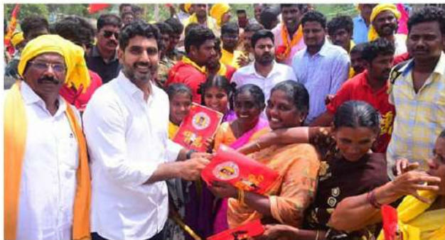
డ్రైనేజీ, తాగునీరు వంటి మౌలిక సదుపాయాలు రోడ్డు నిర్మాణం చేపట్టి రైతుల ఇబ్బందులను కల్పిస్తాయి. గ్రామాలనుంచి పొలాలకు వెళ్లే వుంత తొలగిస్తాయి.

వినుకొండ నియోజకవర్గం రవ్వవరం గ్రామస్థులు నారా లోకేశ్ కలిసి వినతిపత్రం అందించారు. టీడీపీ హయాంలో గ్రామంలో సీసీ రోడ్డు నిర్మించారు. సైదు కాలువలు నిర్మించే సమయంలో ప్రభుత్వం మూడవ పనులు చేపట్టలేదు. గ్రామంలో ఎక్కువ మంది వ్యవసాయంపై ఆధారపడుతున్నారు. పొలాలకెళ్లే రోడ్డుసరిగా లేక ఇబ్బంది పడుతున్నారు. అధికారంలోకి వచ్చాక మా సమస్యలు పరిష్కరించండి.