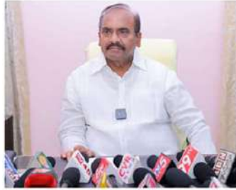
బాలకృష్ణపై జగన్ చేసిన అనుచిత వ్యాఖ్యలు, విమర్శలను తీవ్రంగా ఖండించారు. నాలుగేళ్ల పాలనలో ఏం చేశారో చెప్పకుండా ప్రజాధనంతో

చిలకలూరిపేట (వైతన్యరథం): ఓటమి భయంతో సీఎం జగన్‌లో నిరాశ, నిస్పృహలు అవహించాయని.. అందుకే నోటికొచ్చినట్లు మాట్లాడుతున్నారని మాజీమంత్రి, టీడీపీ రాష్ట్ర ఉపాధ్యక్షులు ప్రత్తిపాటి పుల్లారావు అన్నారు. రోజురోజుకూ ప్రజల్లో వైసీపీ ప్రభుత్వంపై వ్యతిరేకత పెరుగుతుందని... ఓటమి భయంతోనే జగన్ నోటికొచ్చినట్లు మాట్లాడుతున్నారని తెలిపారు. చిలకలూరిపేటలోని తన నివాసంలో జరిగిన మీడియా సమావేశంలో ప్రత్తిపాటి పుల్లారావు మాట్లాడారు. చంద్రబాబు, లోకేశ్,