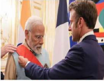
ప్రధాని మోదీకి అరుదైన గౌరవం న్యూఢిల్లీ: ప్రధాని నరేంద్ర మోదీకి ఫ్రాన్స్‌లో అరుదైన గౌరవం లభించింది. ఆ దేశపు అత్యున్నత