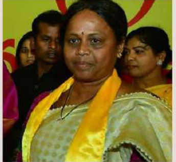
వేలు అందిస్తాం. ఆర్.టి.సిలో మహిళలకు ఉచిత ప్రయాణం కల్పిస్తాం.

ఆధునిక హైదరాబాద్ సృష్టికర్త నారా చంద్రబాబు నాయుడు.. మహిళలకు అన్ని హక్కు మహిళా విశ్వవిద్యాలయాలు, ద్వాక్రా సంఘాలు, మహిళా కందక్రమ, చంద్రన్న భీమా, పసుపు - కుంకుమ లాంటి అనేక పథకాలు, కార్యక్రమాలు తెలుగుదేశం పాలనలోనే వచ్చాయని ఎమ్మెల్సీ పంచమర్రి అనురాధ అన్నారు. వైసీపీ ప్రభుత్వంలో ఎక్కడ చూసినా అరాచకాలే, హత్యానారాలే. జగన్ రెడ్డి రాష్ట్రంలో మద్యం ఏరులై పారినట్లా మహిళల తాళిబొట్లు తెంపుతున్నారు. తెలుగుదేశం ప్రభుత్వం అధికారంలోకి రాగానే మహిళలకు మహాశక్తి పథకం అమలు చేస్తాం. ఏడాది ఋూడు గ్యాస్ సిలిండర్లు ఇస్తాం. నిరుద్యోగ భృతి కింద రూ.3