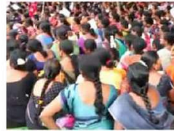
వేలాదిసంఖ్యలో అంగన్ వాడీలు పాల్గొని ముఖ్యమంత్రికి వ్యతిరేకంగా నిరసనగళం వినిపించారు.

పనిభారంమోపి వేధిస్తోందన్నారు. ప్రభుత్వం తక్షణమే తమసమస్యలపై స్పందించ కుంటే సీఎం ఇంటిని ముట్టడిస్తామని హెచ్చరించారు. జగన్మోహన్ రెడ్డి పాద యాత్రలో అంగన్ వాడీ లకు ఇచ్చిన హామీల్ని పూర్తిగా విస్మరించాడని, అలా పరిష్కారంపై తక్షణమే ఆయనచర్యలు తీసుకోవాలని డిమాండ్ చేశారు. ఒంగోలులో జరిగిన ధర్మాలో అంగన్ వాడీలు భారీసంఖ్యలో పాల్గొన్నారు. అంగన్ వాడీ వరల్డ్ కనీస వేతనం రూ.28వేలకు పెంచాలని, నిత్యావసరాలు సహా ఆర్బిధర్మలు పెరిగిన నేపథ్యంలో కుటుంబపోషణ భారమైందన్నారు. రాష్ట్రవ్యాప్తంగా కలెక్టరేట్ల వద్ద జరిగిన ధర్మాల్లో