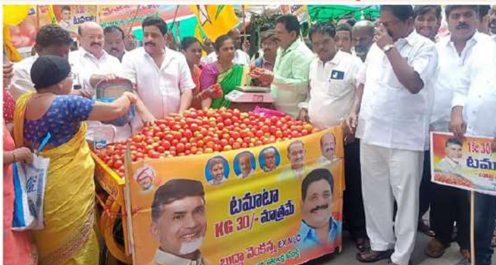
పంటను కాపాడి... దళారుల పాలు కాకుండా ప్రజలకు సబ్సిడీపై టమోటాను అందించాలన్నారు.