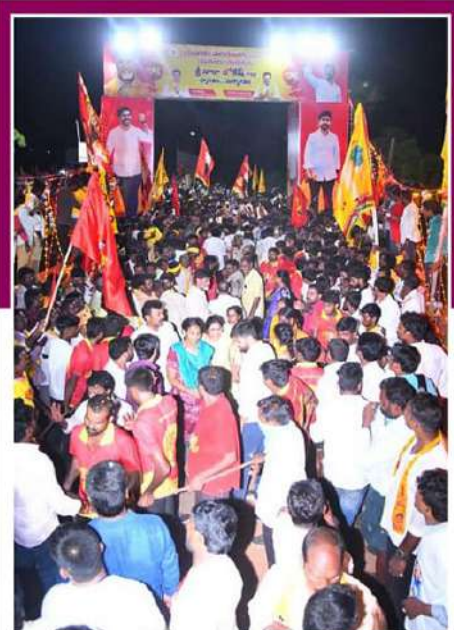
కావలి నియోజకవర్గంలోకి ప్రవేశించిన నారా లోకేశ్ యువగళం పాదయాత్ర. యువనేత లోకేశ్ పాదయాత్రకు ప్రజలు బ్రహ్మరథం పట్టారు.