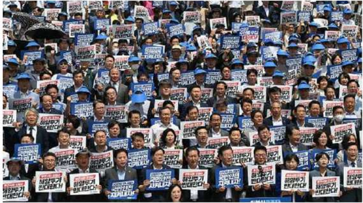
ఫుకుషిమా అణు కర్మాగారం నుండి శుద్ధి చేసిన నీటిని విడుదల చేసి అమెరికా ప్రజాకలకం వ్యతిరేకంగా దక్షిణ కొరియాలో అందోళనకారులు ప్రదర్శన

అందోళనకారులకు దక్షిణ కొరియా హామీ సీయోల్: జపాన్ లోని ఫుకుషిమా అణు విద్యుత్ కర్మాగారం నుండి కుద్దివేసిన నీటిని విడుదల చేయటం పట్ల తమదేశానికి ఎలాంటి నష్టమూ కలగదో దని దక్షిణకొరియాకు శుక్రవారం తెలిపింది. జపాన్ నిర్ణయానికి వ్యతిరేకంగా తమతమ దేశంలు పెరుగుతున్న ప్రజల అందోళనను తగ్గించే ప్రయత్నంలో భాగంగా దక్షిణకొరియా ఈ ప్రకటన చేసింది. 2011లో జపాన్ తూర్పు ఊరాన్ని తాకిన భూకంపం, సునామీ కారణంగా నాశనమైన ఫుకుషిమా అణు విద్యుత్ కర్మాగారంలో పేరుకుపోయిన నీటిని శుద్ధిచేసి ఇన్స్టాల్డ్ ట్యాంకుల్లో భద్రపరిచి ఉంచారు. ఆ నీటిని విడుదల చేయడానికి అంతర్జాతీయ అణు శక్తి సంస్థ (ఐఏఈఏ) ఈ వారం జపాన్ కు అనుమతి ఇచ్చింది. కానీ దీనిపై దక్షిణ కొరియాలో ప్రజల్లో తీవ్రమైన వ్యతిరేకత, నిరసనలను వెల్లువెత్తుతున్నాయి. ఫుకుషిమా నీరు సముద్రాన్ని సముద్రపు నీటి నుండి సేకరించిన ఉప్పును కలుషితం చేస్తుందనే భయాందోళనలకు గురిచేసింది. జపాన్ నిర్ణయంపై దక్షిణ కొరియా ప్రత్యేకసమీక్ష నిర్వహించింది. జపాన్ నిర్ణయం అంతర్జాతీయ ప్రమాణాలకు అనుగుణంగానే ఉందని తెల్పింది. దక్షిణ కొరియా జలాల్పై ప్రభావం చూపుతుందా అనే దానిపై దృష్టి సారించిన చేసిన అధ్యయనంలో ఎలాంటి ప్రభావం ఉండదనిచూపును, ఇన్నా చాలా స్వల్ప ప్రభావం మాత్రమే ఉంటుందని తెలిసింది. ఫుకుషిమా నుండి పసిఫిక్ మహాసముద్రంలోకి విడుదల చేసిన శుద్ధి చేసిన నీరు కొరియా ద్వీపకల్పం సమీపంలో తిరిగి ప్రసరించడానికి 10 సంవత్సరాల వరకు పడుతుందని తెలిసింది. శుద్ధి చేసిన ఆ జలాలు తిరిగి వచ్చినప్పుడు సాధారణ సమయాల్లో ఇది నగలు స్థాయిలో సుమారు లక్షలో ఒక వంతు రేడియేషన్ స్థాయిని