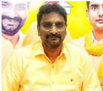
భవిష్యత్తు గ్యారంటీ వైతన్య రథం బస్సుయాత్ర జయప్రదం చేయాలని కోండ్రు కోరారు.

వ్యక్తం చేస్తున్నారన్నారు. రాష్ట్ర ప్రభుత్వం తమ అనాలోచిత నిర్ణయాలతో రాష్ట్రం మరో ముప్పు ఏళ్ళు వెనక్కువైల్లిందన్నారు. గ్రామీణ ప్రాంతాల నుంచి పట్టణాల వరకు రోడ్లు అస్తవ్యస్తం అయ్యాయన్నారు. పదిలక్షల కోట్లకు పైగా ఆస్తుల ఊబిలో ముంచిన సీఎం జగన్ మోహన్ రెడ్డికి రాజోయే రోజుల్లో ప్రజలు గట్టిగా బుద్ధి చెప్పతారన్నారు. వైసీపీ ప్రభుత్వం పాలనలో నిరుద్యోగ యువతీ యువకులు ఉపాధి లేక తీవ్ర ఇబ్బందులు ఎదుర్కొంటున్నారని దుయ్యబట్టారు. జాతీయ తెలుగుదేశం పార్టీ ప్రధాన కార్యదర్శి నారా లోకేష్ పాదయాత్రతో రాష్ట్రానికి రాజోయే రోజుల్లో ఉజ్వల భవిష్యత్తు ఉందన్నారు. శుక్రవారం చేపట్టే