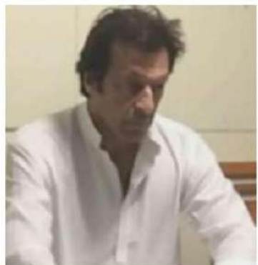
చెలరేగడంతో ఇమ్రాన్ ఖాన్ పార్టీ తీవ్ర గందరగోళంలో పడింది. గత ఏడాది ఏప్రిల్ లో పదవీమ్యుతుడైనప్పటి నుంచి ఇమ్రాన్ ఖాన్ దేశవ్యాప్తంగా 150 కేసులను ఎదుర్కొంటున్నారు.

ఇస్లామాబాద్: గత మే 9న రావల్పిండిలోని పాక్ ఆర్మీ జనరల్ హెడ్ క్వార్టర్స్ (జిహెచ్ క్వార్టర్స్) దాడి చేసినందుకు గాను పాకిస్తాన్ మాజీ ప్రధాని ఇమ్రాన్ ఖాన్ పై కఠిన ఉగ్రవాద నిరోధక చట్టం కింద ఆరు కేసులు నమోదుచేసినట్లు స్థానిక మీడియా తెలిపింది. పాకిస్తాన్-ఇస్రాల్-ఇ-ఇస్లామ్ పార్టీ చీఫ్ ఇమ్రాన్ ఖాన్ మద్దతుదారులు, మే 9న రావల్పిండిలోని ఆర్మీ జనరల్ హెడ్ క్వార్టర్స్ గేట్లను విరగొట్టి దాడి చేశారని ఆరోపణలు వచ్చాయి. సైనిక స్థావరాలపై దాడులు, మెట్రో స్టేషన్ లో కాల్పుల ఫుటనతో సహా అన్ని కేసులను జాయింట్ ఇన్వెస్టిగేషన్ టీమ్లు దర్యాప్తు చేస్తున్నాయని పాకిస్తాన్ జియో న్యూస్ వర్గాలు తెలిపాయి. 70 ఏళ్ల ఇమ్రాన్ ఖాన్ పై మే 9న మూడు కేసులు, మిగిలిన మూడు మే 10న ఉగ్రవాద నిరోధక చట్టం కింద నమోదయ్యాయని జియో న్యూస్ కి వర్గాలు తెలిపాయి. అవినీతి కేసులో ఇమ్రాన్ ఖాన్ ని ఇస్లామాబాద్ హైకోర్టు ఆపరేషన్ నాటకీయంగా ఆరెస్టు చేయడంతో మే 9న దేశవ్యాప్తంగా హింస