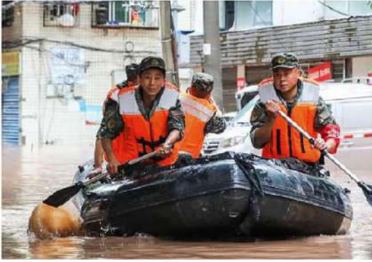
బీజింగ్: నైరుతి చైనాలో గల్లంతయ్యారు. నైరుతి చైనాలోని కుండపోత వర్షం కారణంగా 15 దాంకికింగ్ మునిసిపాలిటీలో గత మంది మృతి చెందగా, నలుగురు మూడు రోజులుగా కురుస్తున్న