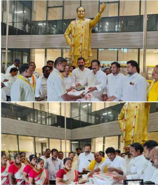
జీసీ విభాగం ఆధ్వర్యంలో కేక్ కట్ చేసిన నేతలు కార్యాలయంలోని స్మిలింగ్ సిబ్బంది, సెక్యూరిటీకి మాతన వస్త్రాలు పంపిణీ