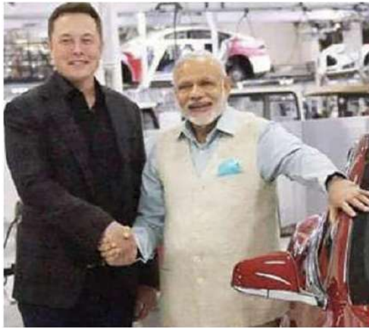
2015లో కాలిఫోర్నియాలోని టెన్సా మోటార్స్ ఫ్యాక్టరీలో మస్కోతో ప్రధాని (మైల్)

న్యూఢిల్లీ: ప్రధాని నరేంద్ర మోదీ తన ఆమెరికా పర్యటనలో బెన్సా కంపెనీ సీఈవో, టీవీటర్ యజమాని ఎలాన్ మస్కోతో సమావేశం కానున్నారు. ఆంకకుముందు 2015లో కాలిఫోర్నియాలోని టెన్సా మోటార్స్ ఫ్యాక్టరీని సందర్శించిన సందర్భంగా ప్రధాని మస్కోను కలిశారు. అప్పట్లో మస్కోకి టీవీటర్ లేదు. టీవీటర్ సంస్థ యజమాన్యం మస్కో చేతుల్లోకి వెళ్లిన తరువాత ఆయనను ప్రధాని మోదీ కలవనుండటం ఇదే మొదటి సారి. తన టెన్సా కంపెనీ ఇండియాలో ప్రవేశం కోసం మస్కో ఎదురుచూస్తున్న సమయంలో ప్రధానితో జరపబోయే సమావేశం ప్రాధాన్యత సంతరించుకుంది. బి వాల స్ట్రీట్ జర్నల్ కి ఇచ్చిన ఇంటర్వ్యూలో ఈ ఏడాది చివరి నాటికి టెన్సా తన ఇండియా ఫ్యాక్టరీని స్థాపించడానికి స్థలాన్ని భారా వేసి ఆవకాశం ఉందని మస్కో తెలిపారు. ప్రభుత్వ వర్గాల సమాచారం ప్రకారం, ప్రధాని బుధవారం న్యూయార్క్ లో దిగిన తర్వాత వివిధ రంగాలకు చెందిన చెందు దణ్ణ మంది మేధావులను, పెద్దలను