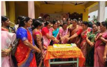
-మంగళగిరిలో 'శ్రీశక్తి' కార్యక్రమం ప్రారంభించి ఏడాది పూర్తి -తెలుగు మహిళ ఆధ్వర్యంలో ఘనంగా వేడుకలు -భారీగా పశిజిర్ నారా భువనేశ్వరికి జన్మదిన శుభాకాంక్షలు తెలిపిన మహిళలు -నారా భువనేశ్వరికి ఆ దేవుని ఆశీస్సులు అర్పిస్తున్నా ఉండాలని ఆకాంక్షించిన మహిళలు

తెలుగుదేశం పార్టీ జాతీయ అధ్యక్షులు, మాజీ సీఎం నారా చంద్రబాబునాయుడు సతీమణి, ఎన్టీఆర్ ట్రస్టు చైర్మన్ నారా భువనేశ్వరి జన్మదిన వేడుకలను మంగళగిరి ఎమ్మెస్సెస్ భవన్లో ఘనంగా నిర్వహించారు. నియోజకవర్గ తెలుగుమహిళ విభాగం ఆధ్వర్యంలో భారీ కేక్ కట్ చేసి నాయకులు, కార్యకర్తలు, మహిళలకు పంది పెట్టారు. నారా భువనేశ్వరికి ఆ దేవుని ఆశీస్సులు అర్పిస్తున్నా ఉండాలని కోరుకుంటూ నారా భువనేశ్వరికి వ్యవసాయకార్యకర్తల జన్మదిన శుభాకాంక్షలు తెలిపారు. పెద్ద ఎత్తున హాజరైన మహిళలు నారా భువనేశ్వరికి జన్మదిన శుభాకాంక్షలు తెలిపుతూ పండగి చేశారు. సైకోపోవాల్-సైకిల్ రావాంటూ నివాదాలు చేశారు. ఈ సందర్భంగా తెలుగు మహిళలు మాట్లాడుతూ... నారా భువనేశ్వరి ఎన్టీఆర్ ట్రస్టుగా వేల కుటుంబాల జీవితాల్లో వెలుగులు నింపుతూ, ప్రజాసత్వం తన ట్రస్టు ద్వారా అనేక సేవా కార్యక్రమాలు నిర్వహిస్తూ పేద ప్రజలకు అండగా ఉంటూ కర్మి లాంటి ఆప్యాయతను పూర్వకమే నారా భువనేశ్వరి దేవుడు అశీస్సులతో ఆయురారోగ్యాలు సుఖసంతోషాలతో ఉండాలని ఆకాంక్షించారు. ప్రజలకు మరంత సేవ చేయాలని వారు కోరుకున్నారు. నారా భువనేశ్వరి వివాద రహితంగా ఉంటూ జాతీయ అంతర్జాతీయ, రాష్ట్ర వ్యవహారాలలో నిత్యం జోణగా ఉండే నారా చంద్రబాబు నాయుడుకు ఆస్తి విధానంగా చీరేడునాటిగా ఉంటూ విజయవంతంలో పయనించేందుకు కారణమవుతున్నారని చెప్పారు. అదేవిధంగా టిడిపి జాతీయ ప్రధాన కార్యదర్శి