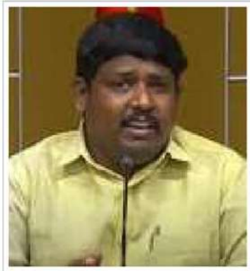
కరోనా సమయంలో అధ్యక్షులు దోపిడీతో వ్యాపారులు రూ.45వేల కోట్లు నష్టపోయారు