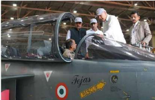
పార్లమెంట్ ఉభయ సభలకు చెందిన కమిటీ సభ్యులకు రక్షణ మంత్రిత్వ శాఖ (ఎంఓడి) రక్షణలో స్వావలంబన సాధనకు చేపట్టిన కార్యక్రమాలు మరియు ఇప్పటివరకు సాధించిన ఫుల్ గిరి గురించి ఆయన వివరించారు.