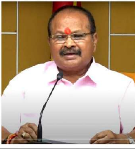
ఎంతరుణమిచ్చారు.. వారు తిరిగి ఎంత చెల్లించారనే వివరాలన్నీ ప్రభుత్వం తక్షణమే ప్రజలముందు ఉంచాలి. సహకారసంఘాల్లో అక్రమాలకు పాల్పడిన అధికారుల్ని సస్పెండ్ చేసి, విచారణ జరిపించి, తప్పిచేసిన వారిని జైళ్లకు

రాష్ట్రంలో సహకార రంగాన్ని వైసీపీ ప్రభుత్వం దోపిడీ కి ఆధారంగా మార్చుకుందని డీజీపీ నేత, మాజీమంత్రి కన్నా లక్ష్మీనారాయణ విమర్శించారు. రాష్ట్రవ్యాప్తంగా కింది స్థాయి వైసీపీ నేతనుంచి ముఖ్యమంత్రి వరకు అందరూ కలిసి సహకార రంగంలో రూ.5వేల కోట్లు కాజేశారన్నారు. దీనిపై దర్భాపు జరిపించాలని ఇప్పటికే కేంద్రపాలాం, సహకార శాఖల మంత్రి అమిత్ షాకు ఫిర్యాదు చేశామన్నారు. మంగళగిరిలోని పార్టీ జాతీయ కార్యాలయంలో తనివారం ఆయన విలేకరులతో మాట్లాడుతూ రాష్ట్రసహకారరంగంలో జరిగే అవినీతిపై అమిత్ షాతో పాటు, ఈడిఐ, అలానే నాబార్డ్ ఛైర్మన్ కు కూడా ఫిర్యాదుచేశామన్నారు. ఆందరికోసం పనిచేయాలిని సహకార వ్యవస్థలో జవాబుదారీతనం లేకుండాచేసి, జేబుదొంగలకు ఆప్యగించారన్నారు. ఇనుకదండారీ ఎలాగైతే పాలిగాళ్లను నియమించి దోచుకుంటున్నారో,