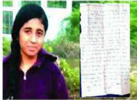
వైసీపీ నాయకుల వేధింపులకు బలైన మైనారిటీ విద్యార్థిని చూపుతుంది