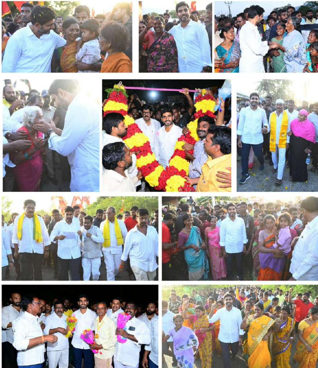
ఉక్కుపాదం మోపుతాం. డ్రిప్ ఇలగేషన్ తో పాటు గతంలో రైతులకు అమలుచేసిన సంక్షేమ పథకాలన్నీ పునరుద్ధరిస్తాం. ఎపి సీడ్స్ ద్వారా రైతులకు నాణ్యమైన విత్తనాలు సరఫరా చేసేందుకు చర్యలు తీసుకుంటాం.