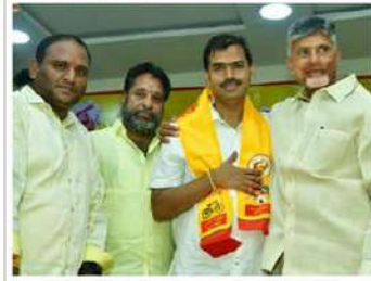
నీతి నిజాయితీకి మారుపేరు కుప్పం ప్రజలు. అలాంటి వారి మధ్య నేడు రౌడీలు పేట్టిగోపోతున్నారు. నా దగ్గర మీ రౌడీయజం చెల్లదు. తీవ్రవాదులపై బొర్రాడిన పార్టీ, రౌడీలను తుదముట్టించిన పార్టీ టీడీపీ అన్నారు. కుప్పంలో వైసీపీ గూండాల బహిరంగంగా ఒక వ్యక్తిపై దాడులు చేయటం ఓ వీడియోలో చూసి చలించి పోయా. ఆనలు బీళ్లుమనుమలా.. రాక్షసులా అని ఆగ్రహం వ్యక్తం చేశారు.

చేశారు. తాను అధికారంలో ఉండి ఉంటే మూడేళ్లలోనే హంద్రీనీవా పూర్తయ్యేదన్నారు. ఇక్కడ 95 శాతం పూర్తైన హంద్రీనీవా పూర్తి చేయలేక పోయాడు. నేనుంటే 3 ఏళ్లలోనే పూర్తిచేసి నీళ్ళిచ్చేవాడిన న్నారు. పార్టీకోసం, ప్రజల కోసం పనిచేసే కార్యకర్తలను ఆదుకునే బాధ్యత తనదేనని హామీ ఇచ్చారు. పేదల్ని ధనకుల్ని చేసి బాధ్యత తీసుకుంటానన్నారు. నాడు దీనిపథకం కింద మహిళలకు ఉద్యోగాలు గ్యాస్ పిలిందరలు ఇచ్చామన్నారు. కాలేజీ సిట్టిలో 33 శాతం మహిళలకు రిజర్వేషన్లు ఇచ్చి మగవాలతో సమానంగా బిర్యులో ప్రోత్సహించాం. ఆడ బిడ్డల్ని మహా శక్తిగా రూపొందించేందుకే 'మహాశక్తి' పథకం తెచ్చాం. ఏడాదికి ఉచితంగా 3 గ్యాస్ పిలిందర్లు, మహిళలకు ఆర్టీసీ బస్సుల్లో ఉచిత ప్రయాణ సౌకర్యం కల్పిస్తామన్నారు. 18 నుంచి 59 ఏళ్ల మహిళలకు నెలకు రూ. 1500 ఇస్తాం. ఇంట్లో ఎంతమంది చదువు చేసిన బిడ్డలుంటే అందరికీ 'తల్లి కి వందనం' కింద ఏడాదికి రూ.15 వేలిస్తామన్నారు. యువతకు రూ.3వేల నిరుద్యోగ భీతి ఇస్తాం. 20లక్షల ఉద్యోగాలు ఇస్తామన్నారు. రైతులకు ఏడాదికి రూ.20 వేలు అందజేస్తామన్నారు. జీవీల రక్షణకు ప్రత్యేకపట్టం తీసుకొస్తామన్నారు. కుళాయి ద్వారా ప్రతి ఇంటికి సురక్షితమైన మంచినీరు అందిస్తామన్నారు. పేదల్ని ధనకులుగా చేస్తాం. ప్రతి యూని వల్లిచీ ఉద్యోగులకు జీతాలివ్వ లేని దుస్థితిలో వైసీపీ ప్రభుత్వం ఉంది. ఉద్యోగులు పొరుగు గుర్తులకు పలన వెళ్తున్నారు. నియోజకవర్గ సమస్యల్ని పరిష్కారం కావాలంటే మళ్ళీ టీడీపీ గెలవాలి. ఎన్నికలు 9నెలలే ఉన్నాయి. మీరంతా ప్రజలు, పార్టీ కోసం పనిచేయండి. మిమ్మల్ని ఆదుకునే బాధ్యత టీడీపీ మీది. గత 35 ఏళ్లలో నియోజకవర్గంలో జరిగిన అభివృద్ధిని వచ్చే 5 ఏళ్లలో చేసిచూపిస్తా" అని చంద్రబాబు సృష్టించిచేశారు.