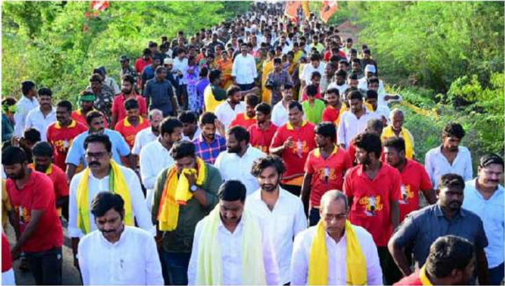
వృద్ధులు, రైతులకు ఇచ్చిన ప్రతి హామీని డెబుతూ అభివృద్ధిలోకి వచ్చాక అమలుచేసి తీరుతామని అన్నారు. గౌరవంలో ఎన్టీఆర్ విగ్రహానికి పూలమాల వేసి నివాళులర్పించారు. బొమ్మపరం, గుడిగుంకు, చిలకలమర్రి, మంగపల్లి, కావీరెడ్డిపాడు, గౌరవరం

దారిపొడవునా జనం నీరాజనాలు... వినకుల వెల్లువ ఆప్యాయంగా పలకరిస్తూముందుకు సాగిన యువనేత ఆత్మీకుారు: ఆరాచకపాలనను అంతమొందించడమే లక్ష్యంగా యువనేత లోకేష్ చేపట్టిన యువగళం పాదయాత్ర ఆత్మీకుారు అసెంబ్లీ నియోజకవర్గంలో ఉత్సాహంగా సాగుతోంది. 127వరోజు పాదయాత్ర ఆత్మీకుారు నియోజకవర్గం బొమ్మపరం క్యాంప్ సైట్ నుంచి ప్రారంభమైంది. అడుగుడుగునా ప్రజలు యువనేతకు నీరాజనాలు పడుతూ తాము ఎదుర్కొంటున్న సమస్యలను విన్నవించారు. అందరి సమస్యలు ఓసిగ్గా విన్న లోకేష్ మరో ఏడాదిలో రాబోయే చంద్రశేఖర ప్రభుత్వం పరిష్కారం చూపుతుందని భరోసా ఇచ్చి ముందుకు సాగారు. పాదయాత్ర దారిలో మహిళలు, యువకులు, వివిధవర్గాల ప్రజలు యువనేతను కలిసి సమస్యలను విన్నవించారు. బొమ్మపరం క్యాంప్ సైట్ యువనేత, పొన్నగడకో ముఖ్యముఖ సమావేశమై వారి సాధకబాధకాలు తెలుసుకున్నారు. చిలకలమర్రిలో భవిష్యత్తు కు గ్యారంటీ పేరుతో యువనేత కరకటాల్లు పంపిణీ చేశారు. మహానాడు వేదికగా పార్టీ అభినేత ప్రకటించిన హామీలను ప్రజలకు వివరించారు. మహిళలు, యువనేత.