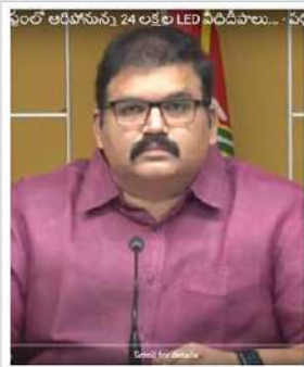
సీఎంఐ ఆఫీసును 24 లక్షల LED వీధిదీపాలు...