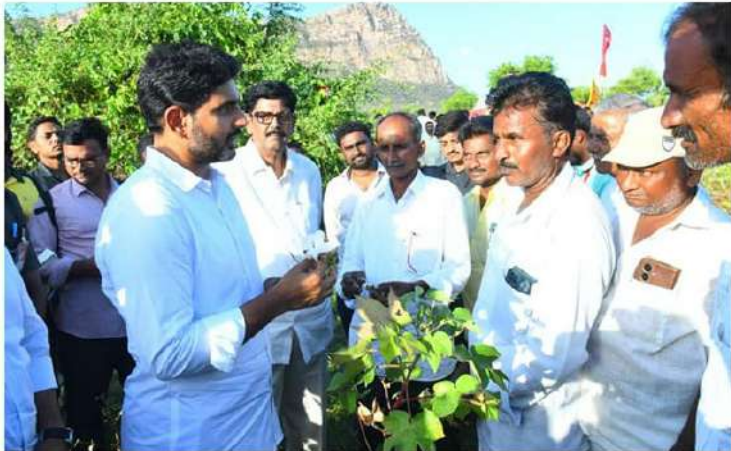
కల్పించడమేగాక ఇవ్వుటే సబ్సిడీ ఇచ్చారు. రైతులు ఎట్టి పరిస్థితుల్లో మోటార్లకు మీటర్లు అంగీకరింబోరు. అవి మీ మెడకు ఉరితాడుగా మారతాయి. టిడిపి అధికారంలోకి వచ్చాక సబ్సిడీ విత్తనాల విక్రేతలపై

నారా లోకేష్ మాట్లాడుతూ... వ్యవసాయమంత్రి మీ జిల్లా వాడే. ఆయన కోర్టులో పత్రాల చోరీ కేసులో సిబిఐ దిరుగుతున్నాడు. మిమ్మల్ని పట్టించుకునే తీరక ఆయనకు ఎక్కడుంది? గతంలో 90కాశం సబ్సిడీతో డ్రిప్ సాకర్యం