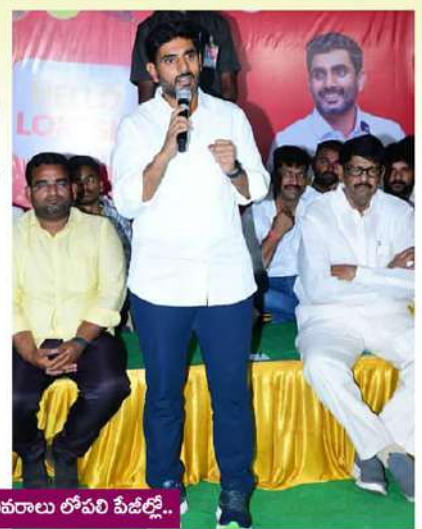
- వివరాలు లోపలి పేజీల్లో..

విజనలీకి, ప్రిజనలీకి తేడా గమనించండి! జగన్ పాలనలో కంపెనీలు పారిపోతున్నాయి రాష్ట్రాన్ని గంజాయి క్యాపిటల్ గా మార్చేశాడు అధికారంలోకి వచ్చక నిరుద్యోగ భృతి కల్పిస్తాం పరిశ్రమలు రప్పించి 20లక్షల ఉద్యోగాలిస్తాం హలో లోకేష్ కార్యక్రమంలో యువనేత లోకేష్