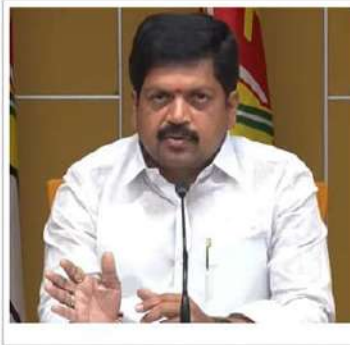
రాష్ట్రంలోని బలహీనవర్గాల మనసుల్లో విడుదలవుతున్న నాలుగు జగన్ ను గొప్పవాడిగా చిత్రీకరించి, బీసీలకు

ఓట్లు అతనికేవలం చేయడంలో కృతకృత్యులైన తెలంగాణ బీసీనేతలు, నాలుగేళ్లుగా జగన్ ఏపీలోని బీసీలపై చేస్తున్న దుర్మార్గాలు, దాడుల్ని మాత్రం ఒక్కరోజు కూడా ప్రశ్నించలేకపోయారు. గత ఎన్నికల్లో పొరుగురాష్ట్ర బీసీనేతల ప్రచారంతో, బీసీల ఓట్లుకొల్లగొట్టిన జగన్, రాజీయే ఎన్నికల్లో మరలా బడుగు, బలహీనవర్గాల్ని వందించడానికి కొత్తగామాలు అడుగుతున్నాడు. 56 ఫెడరేషన్లు పెట్టి, బీసీలను ఉద్ధరించానంటున్న జగన్, కనీసం వాటిలో కూర్చోవడానికి కుర్చీలు లేకుండా చేశాడు. ఫెడరేషన్లకు రూపాయినిధులు ఇవ్వకుండా ఉత్సవ విగ్రహాలుగా మార్చాడు. జగన్మోహన్ రెడ్డి పంచన చేరి, బీసీలకు తీరని గ్రోహం చేసిన ఈశ్వరయ్య లాంటి వాళ్లను రాష్ట్రంలో తిరగనివ్వం. 4 ఏళ్లుగా జగన్ బీసీల్ని తప్పుడు కేసులతో హింసినప్పటికీ, వారి ఆస్పత్రి ధ్వంసం చేస్తుంటే ఈశ్వరయ్యలాంటి వారు ఎందుకు సోరెత్తలేదు?