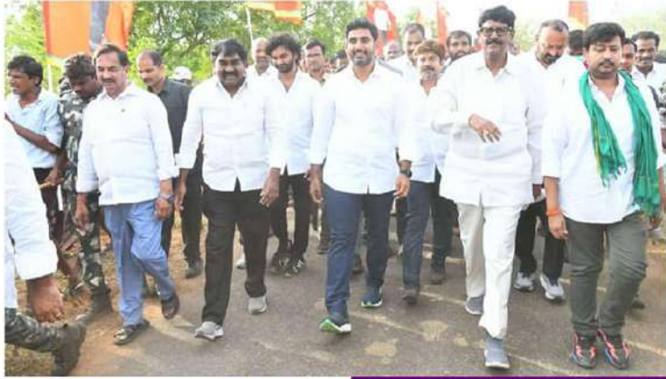
యువనేత ఎదుట వ్యక్తిమైని సీమస్వీలు

ఆత్మకూరు: యువనేత నారా లోకేష్ చేపట్టిన యువగోళం పాదయాత్ర ఆత్మకూరు అసెంబ్లీ నియోజకవర్గ పరిధిలో హారెత్తించింది. అడుగుడుగునా యువనేతకు మహిళలు, యువకులు, వృద్ధులు ఎదురేగి ఘన స్వాగతం వలికారు. దారిపొడవునా గ్రామాల్లో పాల్గొని కార్యక్రమం, అభిమానులు యువనేతను ఘనంగా స్వాగతించారు. అడుగుడుగునా మహిళలు హారతులతో సీరాజనాలు వట్టారు. 126వ రోజు పాదయాత్ర నాయకుడుపై క్యాంపు సైట్ నుంచి ప్రారంభమైంది. మల్లపాడు మండలం చుంచులూరు వద్ద పాదయాత్ర 1600 కి.మీ మైలురాయి చేరుకుంది. ఈ సందర్భంగా చుంచులూరులో హార్వీక్లర్ కోఆపరేటివ్ సాసైటీ ఏర్పాటుకి యువనేత శిలాఫలకాన్ని ఆవిష్కరించారు. దీనిద్వారా ఉద్యానవన పంటలు సాగుచేసే రైతులకి అన్నివిధాలా మేలు జరుగుతుంది. అధికారంలోకి వచ్చిన వెంటనే సాసైటీ ఏర్పాటుకు వర్కలు తీసుకుంటావని చెప్పారు. పాదయాత్ర ప్రారంభానికి ముందు