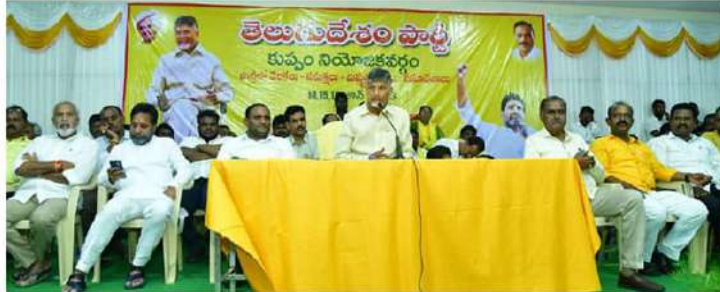
శ్రేణులు చేసిన ఆరాచకాలు, దౌర్జన్యంను ప్రస్తావించారు. ప్రభుత్వ తప్పుడు కేసులు, వైసీపీ గూండాల దాడులను ఎదిరించి నిలబడ్డ క్యాడర్ కు

కుప్పం: కుప్పం నియోజకవర్గ పార్టీ కార్యకర్తల సమావేశంలో టీడీపీ జాతీయ అధ్యక్షులు నారా చంద్రబాబు నాయుడు పాల్గొన్నారు. ఈ సందర్భంగా ఆయన ప్రభుత్వ వైఫల్యాలు, ప్రతిపక్ష పార్టీగా రానున్న రోజుల్లో చేయాల్సిన పోరాటాలపై కార్యకర్తలకు దిశానిర్దేశం చేశారు. ముందుగా 4 మండలాలకు చెందిన కార్యకర్తలతో భేటీ అయిన చంద్రబాబు నాయుడు... ఆనంతరం కుప్పం మునిసిపాలిటీ నేతలతో భేటీ అయ్యారు. ఈ సందర్భంగా పార్టీ అంతర్గత అంశాలపై చర్చించారు. వలుపురు నేతలు కమ ఆలప్రాయాలు, అనుభవాలను సమావేశంలో పంచుకున్నారు. కుప్పంలో 4 ఏళ్లుగా అభివృద్ధి పనులు నిలిచిపోయిన విషయాలను వివరించారు. 2019 ఎన్నికల్లో ఓడిన తరువాత నియోజకవర్గంలో వైసీపీ