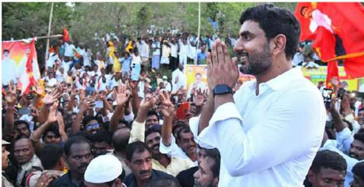
మిషన్ రాయలసీమ ద్వారా మీ కష్టాన్ని తుడిచి రుణం తీర్చుకుంటానని యువగళం సాక్షిగా మాట జస్సున్నాను. ఎంతటి గడ్డు పరిస్థితుల్లోనైనా ప్రత్యర్థులకు ఎదురొడ్డి నిలబడే పాటను స్ఫూర్తిని మీ నుంచి పొందిన నేను లక్ష్యాన్ని చేరుకునేవరకు విశ్రమించబోనని లోకేష్ పేర్కొన్నారు.

యువగళం పాదయాత్రలో తనను ఆదరించిన రాయలసీమ ప్రజాసేవకు యువనేత నారా లోకేష్ కృతజ్ఞతలు తెలిపారు. రాష్ట్రంలో నాలుగేళ్ల ఆరాచకపాలనలో భాగితులుగా మారిన ప్రజలకు భరోసా కల్పించడమే లక్ష్యంగా నేను చేపట్టిన యువగళం పాదయాత్ర తొలి మజలీని మీ అందరి ఆశీర్వాదంతో విజయవంతంగా పూర్తి చేయగలిగాను. 124రోజులపాటు నిర్వహించిన సుదీర్ఘ పాదయాత్రలో నాతోపాటు యువగళం బృందాలను కంటికి రెప్పలా కాపాడుకుంటూ రాయలసీమ ప్రజలు ముప్పై మాసిన ఆదరాభిమానాలను ఊహించలేక పురుషులను. అడుగుడుగునా మీ ప్రజల కష్టాలను నేరుగా చూశాక తీవ్ర మనోవేదనకు గురయ్యాను. రాయలసీమ బిడ్డగా ఈ ప్రాంతంలో నెలకొన్న సాగు, తాగునీటి సమస్య, నిరుద్యోగం, వలసల నివారణకు శాశ్వత పరిష్కారం చూపాలని నిర్ణయించుకున్నాను. అధికారంలోకి వచ్చిన వెంటనే