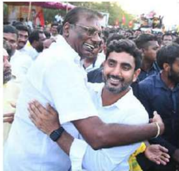
యువనేత ఎదుట వ్యక్తమైన సమస్యలు