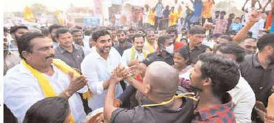
అధికారంలోకి వచ్చాక అక్రమ తవ్వకాలపై ఉక్కుపాదం మోపుతాం. నదీతీర ప్రాంత ప్రజలకు ఉచితంగా ఉచిత తీసుకునే అవకాశం కల్పిస్తాం. కమ్మపాలెం ఎస్సీ కాలనీకి ఇంటింటికీ కుళాయి ద్వారా మందిరినీ అందిస్తాం. వాస్తవ భూ అనుభవదారులను గుర్తించి పట్టాలు అందించేందుకు చర్యలు తీసుకుంటాం.

లోకేశ్ నుందిస్తూ... జగన్మోహన్ రెడ్డి ధనదాం రాష్ట్రంలోని 40 లక్షల మంది భవననిర్మాణ క్యాబులకు శాపంగా మారింది. గత నాలుగేళ్లలో జగన్ అండ్ కో ఇసుక ద్వారా రూ. 10 వేల కోట్లు దోచుకున్నారు. రాష్ట్రంలో ఎక్కడా ఒక్క రోడ్డు వేయలేదు. గుంతల్లో తట్టెడు మట్టి కూడా వేయలేదు. మన రాష్ట్రంలోని ఇసుక తమిళనాడు, కర్ణాటక, తెలంగాణలో విరివిగా దోరుకుతోంది. లక్షలాది రాష్ట్రప్రజల ప్రయోజనాలను ఫణంగా పెట్టి వైసీపీ నాయకులు ఇసుక వ్యాపారం చేస్తున్నారు. వైసీపీనేతర ఇసుక కక్కుర్తిపల్ల అస్సమయ్య ప్రాజెక్టు కొట్టుకుపోయి 61 మంది చనిపోయారు. టిడిపి