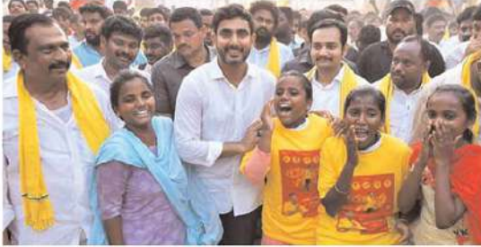
మౌలిక సదుపాయాలు కల్పిస్తాం. పంచాయతీలకు విధులు, నిధులు కల్పించి బలోపేతం చేస్తాం.

జగన్ పాలనలో గ్రామీణులు పూర్తిగా నిర్లక్ష్యమయ్యాయి. పంచాయతీల్లో జ్జీలెం గ్లబ్బడానికి కూడా బిల్డింగ్స్ లేకుండా చేశారు. గ్రామ పంచాయతీలకు చెందిన రూ. 8.600 కోట్లను జగన్ ప్రభుత్వం దొంగిలించింది. టిడిపి అధికారంలోకి రాగానే ఇంటింటికీ తాగునీటి కుళాయి అండబెస్తాం. గ్రామాల్లో ఎర్ర ఇడి వీధిలైట్లు,