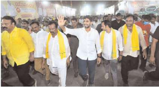
బాధితులు, మైనార్టీలకు ఉన్న