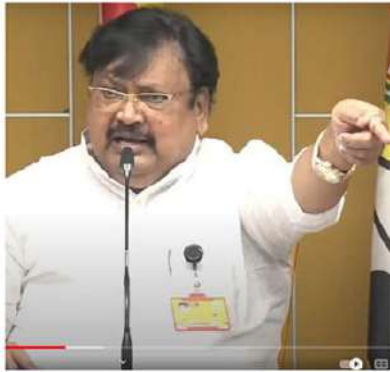
డీజీపీ గారి పూర్వలో మనస్తత్వానికి నిదర్శనం. దళిత మహిళ ఘోరా తిప్పోరంగా హత్య గావించబడితే డీజీపీ స్పందించిన తీరు చాలా బాధాకరం. ఆయన హూరాకు, స్థాయికి తగని పని. ఈ ప్రభుత్వంలో