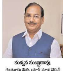
మున్నవ ముఖ్యమంత్రి, గుంటూరు మిర్చి యార్డ్ మాజీ చైర్మన్

కు రూ.12 ఎక్కువగా గుంజాతున్నారు. చంద్రబాబు హయాంలో ఉచితంగా లభించిన ఇసుక నేడు బంగారమైంది. పెద్దపత్తను అమెరికాకి పార్లమెంటు ప్రత్యేక వనరులన్నింటినీ దోచేశారు. సంపూర్ణ మధ్యపాన విషాదమని సొంత బ్రాండ్ బీప్ లిక్వర్ ను అధిక ధరలకు విక్రయిస్తూ పేదల ప్రాణాలతో చెలగాటమూడుతున్నారు. అన్నపూర్ణ లాంటి ఆంధ్రప్రదేశ్ ను అప్పులాండ్రప్రదేశ్ గా మార్చేశారు. అప్పును రూ.10 లక్షల కోట్లకు, పెండింగ్ బిల్లులను రూ.2 లక్షల కోట్లకు చేశారు. వైసీపీ మోసానికి భగవద్గీత, బైబిల్, ఋషి అని ప్రజలను మోసం చేస్తున్నారు. చెప్పేదానికి, చేసేదానికి ఎక్కడా పొంతనలేదు. మోసానికి అన్ని సీట్ల మూటలుగా మిగిలిపోయాయి. జాబ్ కేలండర్ అని చెప్పి సాక్షి కేలండర్ ఇచ్చారు. వారంలో సీపీఎస్ రద్దని జీపీఎస్ తీసుకువచ్చారు. బివరకి అబి లేదు, జేతలు, పెన్షన్ కూడా వచ్చే పరిస్థితి లేదు. ఒక్క ఛాన్స్ పేరుతో అధికారంలోకి వచ్చిన జగన్ రెడ్డి నిజస్వరూపం బట్టబయల్చెంది. ఇంకా ప్రజలు అమాయకులనే ధీమాతో తాను ఏం చెప్పినా నమ్ముతారనకుంటున్నారు. అందులో భాగంగానే పేదలు-పెత్తందార్లంటూ ప్రజలను రెచ్చగొడుతున్నారు. భారతదేశంలో అత్యంత ధనిక ముఖ్యమంత్రిని తానేనన్న విషయం ముగిసిపోయారు. ప్రతి బహిరంగ సభలో జంకు లేకుండా పద్మి అబద్ధాలను వరదలా పాలిస్తున్నారు. సాక్షి పేదర్, టీవీ తనికాబిని చెప్పడం అబద్ధాలకు వరాకాష్ట్ర ప్రతిపక్ష నాయకుడుగా ఉన్నప్పుడు చెప్పిన మాటలను ప్రజలు మర్చిపోయి ఉంటారని, మరోసారి ముఖ్యమంత్రిగా ప్రజలను దగా చేసే ప్రయత్నాలు మొదలెట్టారు. ఏది ఏమైనా పగపాలన, పగసాధనలతో రాష్ట్రాన్ని సర్వ వాననం చేసిన జగన్ రెడ్డి పాలనకు చరమగీతం పాడాల్సిన సమయం ఆసన్నమైంది. ఆంధ్రప్రదేశ్ అభివృద్ధి, సంక్షేమాల బాట పట్టాలంటే తెలుగుదేశం పార్టీ విజయం చారిత్రక అవసరమన్నది ప్రజలు గుర్తించారు.