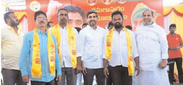
సెల్ఫీ వద్ద యువనేత పాదయాత్ర కడప అసెంబ్లీ నియోజకవర్గంలోకి ప్రవేశించింది.