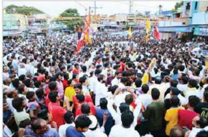
గ్రామాలకు 80మీటర్లు డ్రైన్, 80మీటర్ల సర్వీస్ రోడ్డు 70మీటర్ల స్టాప్ ప్రొవిజన్ వాల్ కావాలి. మీరు అధికారంలోకి వచ్చాక మా సమస్యల్ని పరిష్కరించాలని

మైదుకూరు నియోజకవర్గం దుంపలగట్టు, పాటిమీదపల్లె గ్రామస్థులు సోమవారం యువనేత లోకేష్ ను కలిసి తాము ఎదుర్కొంటున్న సమస్యలపై వివరించుకునే సమర్పించారు. మా గ్రామంలో సీసీరోడ్డు, శ్రేణుల వాటిక లేవు. తాగునీరు సమస్య అత్యధికంగా ఉంది. దుంపలగట్టులో డోల్ పాపా పెట్టినప్పుడు దుంపలగట్టు, పాటిమీదపల్లె గ్రామసమస్యలు తీరుస్తామని కాంట్రాక్టర్ హామీ ఇచ్చారని, ఆయన కాంట్రాక్టర్ పనులను అసంపూర్ణంగా వదిలేసి వెళ్లిపోయారు. రోడ్డు, డ్రైనేజి సరిగ్గాలేకపోవడంతో వర్షపు నీరు బీడులో నిల్వ ఉండిపోతోందని తెలిపారు. నేపవల్ సైనే అధికారులు మా సమస్యల్ని పరిష్కరించకుండా వదిలేశారు. దుంపలగట్టు ఎస్పీకాలనీ, పాటిమీదపల్లె