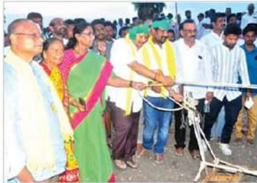
సత్తెనపల్లి నియోజకవర్గంలో మాజీ మంత్రి కన్నా లక్ష్మీనారాయణ గారి ఆధ్వర్యంలో ఏరువాక ఘనంగా నిర్వహించారు.