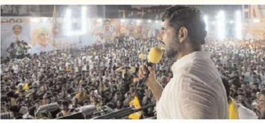
మనగళం, ప్రజాబలం. యువగళం దెబ్బకి జగన్ కి 70 ఎంఎం నిలమాన వ్యతిరేక చూపు జగన్ కి