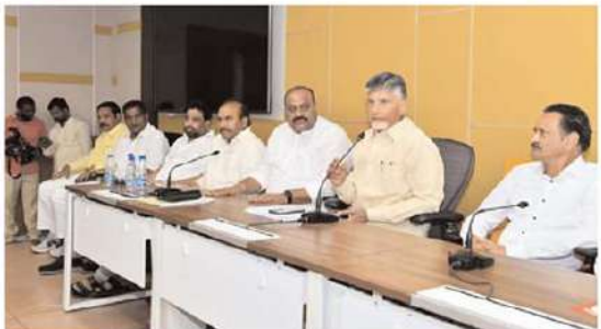
తెలుగుదేశం పార్టీ జాతీయ కార్యాలయంలో పార్టీ నయోజకవర్గ పరిశీలకులతో జరుగుతున్న పార్టీ కార్యక్రమాలపై సమీక్షించిన తెలుగుదేశం పార్టీ జాతీయ అధ్యక్షులు నారా చంద్రబాబు నాయుడు, రాష్ట్ర అధ్యక్షులు కింజరాపు లచ్చం నాయుడు, తెలుగుదేశం పార్టీ ముఖ్య నేతలు