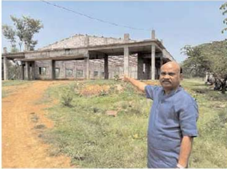
తెలుగుదేశం ప్రభుత్వ హయాంలో ఉత్తరహామిని సత్యనారాయణ స్వామి ఆలయం వద్ద కోటి రూపాయలతో 80 శాతానికి పైగా కళ్యాణ మండపం పూర్తి చేయడం జరిగింది. వైసీపీ అసమ్మద్ పరిపాలనలో నాలుగేళ్లు గడిచినా కళ్యాణ మండపం పూర్తి కాలేదు. ఇప్పటికైనా కళ్ళు తెరవండ్రా.. వేదీయం బ్యావ్: అయ్యన్న పాత్రుడు