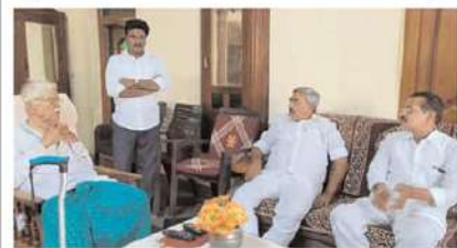
దుగ్గిరాల మాజీ ఎమ్మెల్యే మర్రిశ్రీ వివరామకృష్ణారెడ్డిని మర్యాదపూర్వకంగా కలిసిన మాజీ మంత్రి ఆలపాటి రాజేంద్రప్రసాద్