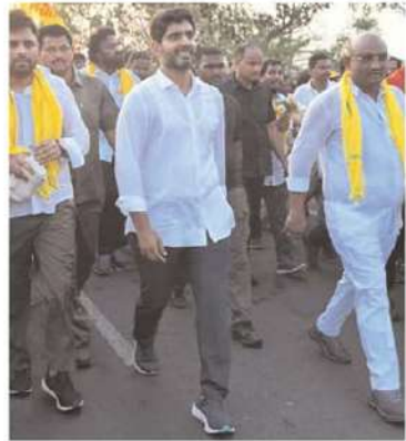
విశ్వనాథపురంలో పసుపు కొనుగోలు కేంద్రాన్ని ఏర్పాటుచేస్తాం. ఇక్కడ పంటనుబట్టి శాశ్వత మార్కెట్ ఏర్పాటుచేసి అంకాన్ని పరిశీలించామని లోకేష్ వారికి హామీ ఇచ్చారు.

మాడెళ్లుగా పసుపు కొనుగోలు కేంద్రాలు పెట్టడం లేదు. పంటను అమ్ముకోవడానికి మేము కడప, దుగ్గిరాల లేదా మహారాష్ట్రలోని శాంగ్గి మార్కెట్ కు వెళ్ళాల్సి వస్తోంది. టిడిపి ప్రభుత్వం అధికారంలోకి వచ్చాక మా ప్రాంతంలో శాశ్వత పసుపు మార్కెట్ ఏర్పాటుచేసి, మద్దతు ధర కల్పించాలి అని వారు విజ్ఞప్తి చేశారు. వారి విజ్ఞప్తిపై నారా లోకేష్ సానుకూలంగా స్పందించారు. రాష్ట్రంలో జగన్మోహన్ రెడ్డి అధికారంలోకి వచ్చాక వ్యవసాయరంగం పూర్తిగా నిర్లక్ష్యమైంది. ఎన్నికల సమయంలో రూ.3.500 కోట్ల ధరల స్థిరీకరణ నిధి ఏర్పాటుచేసి రైతులకు గిట్టుబాటు ధర కల్పిస్తానన్న ముఖ్యమంత్రి తాడేపల్లి వ్యాపిని దాటి బయటకు రావడం లేదు. జగన్ నిర్వాకం కారణంగా ఎపి రైతుల్లో అప్పుల్లో దేశం మొత్తమీద మొదటిస్థానంలో ఉన్నాడు.