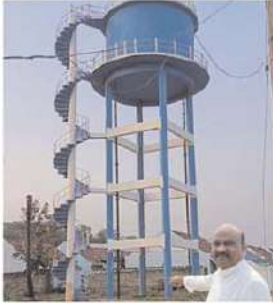
ఓయ్ జగన్ రెడ్డి నా సెల్ఫీవట్టుం నియోజకవర్గం లో పెదజగంపేట గ్రామంలో ఉల మొత్తానికి సరపాయ వాటర్ ట్యాంక్ నేనే కట్టించాను. కాని మళ్ళీ రంగులేసుకున్నావ్ అందుకే నేను అంటూను చేతకాని ముఖ్యమంత్రిని అని: అయ్యన్న పాత్రుడు