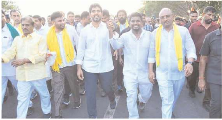
రాష్ట్రంలో జగన్మోహన్ రెడ్డి అధికారంలోకి వచ్చాక గత నాలుగేళ్లలో రాయలసీమలో ప్రాజెక్టులను పూర్తిగా నిర్లక్ష్యం చేశారు. గత టిడిపి ప్రభుత్వ హయాంలో సీమ ప్రాజెక్టుల కోసం రూ.11వేల కోట్లు ఖర్చుచేస్తే గత నాలుగేళ్లలో జగన్ ప్రభుత్వం ఖర్చుపెట్టించి కేవలం రూ.2,700 కోట్లు మాత్రమే. కుందూనది వక్కనే ఉన్న ఖాదర్ పల్లె గ్రామరైతులు సాగునీటి ఇబ్బంది ఎడరకొందరూ దురదృష్టకరమని లోకేష్ పేర్కొన్నారు.

కుందూనది నుంచి ఖాదర్ పల్లె చెరువులకు నీరుందించే అవకాశాలను పరిశీలించి, ఇక్కడి రైతులకు నీరందించేలా చర్యలు తీసుకుంటామని తెలుగుదేశం పార్టీ జాతీయ ప్రధాన కార్యదర్శి నారా లోకేష్ వెల్లడించారు. యువగళం పాదయాత్ర సందర్భంగా శుక్రవారం మైదుకూరు నియోజకవర్గం ఖాదర్ పల్లె గ్రామస్థులు యువనేత లోకేష్ ను కలిసి నమస్కరణలు విన్నవించారు. కెసి కెనాల్ చాపాడు మొయిన్ దాసల్ నెం.1 ఆయకట్టు చివరలో వాపాడు, ఖాదర్ పల్లె గ్రామస్థులు ఉన్నారు. చాసల్ -1 అడ్డకాలు నుంచి వెళ్లే చెరువు కింద ఖాదర్ పల్లె కు చెందిన 1200 ఎకరాల ఖాలాలు ఉన్నాయి. కాల్య ఆధునికీకరణ పనులు చేపట్టకపోవడంతో చెరువుకు నీరందక ఇబ్బంది పడుతున్నాం. డీనివెల్ ఆయకట్టు చివరి భూముల రైతులు సస్టైంబల్. అక్టోబర్ నెలల్లో నీటికయ్యలు తీసుకొని నిల్వ చేసుకోవాలి చర్చించి. మా గ్రామానికి సమీపంలో ఉన్న కుందూనది నుంచి లిఫ్ట్ ఇరిగేషన్ ద్వారా చెరువులకు నీరందించాలి అని వారు విజ్ఞప్తి చేశారు. వారి విజ్ఞప్తిపై నారా లోకేష్ సానుకూలంగా స్పందించారు.