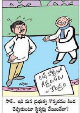
సార్.. ఇది చువ ప్రభుత్వ గొప్పదనం కింద చెప్పుకుంటూ నీళ్లు వేయించేవా?

ప్రభుత్వ ఉద్దేశపూర్వక నిర్లక్ష్య ప్రభుత్వంతో రాష్ట్రమంతటా ప్రతి ఎకరాకు నీరందించే సుపర్నావకాశం చేజారిపోయింది. నదుల అనుసంధానంతో