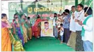
రైతులు, రైతుకూలీల నిరసన దీక్షా తిజరం వద్ద ఈ కార్యక్రమాన్ని నిర్వహించారు. ఒకటే రాజధాని ఒకటే అమరావతి అంటూ వివరాలు చేశారు.