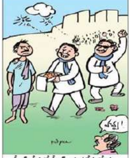
స్వేచ్ఛ తీసుకో స్వేచ్ఛ పాతకేసులో మా నాయకున్నీ అరెస్టు చేయొద్దని తీర్పు వచ్చిందీ!

మహానాడులో టిడిపి కీలక తీర్మానం విధించారు. నాలుగోట్లగా ప్రజలపై బాదుడే, బాదుడు, పన్నుపోటు ప్రత్యక్షంగా కానవస్తోంది. ఈ స్థితిలో ప్రజల్ని ఆదుకునేందుకు తెలుగుదేశం పార్టీ మహానాడు సందర్భంగా విడుదల చేసిన మేనిఫెస్టోలో పలు హామీలు పొందుపరచింది. విద్యుత్ ఛార్జీలు పెంచకుండా వుండటంతో వాటు, ప్రత్యేక కమిటీలు ఏర్పాటు చేసి నిత్యవసరాల ధరల నియంత్రణకు చర్యలు చేపట్టేందుకు చర్యలు తీసుకుంటామని మహానాడు వేదికగా వెల్లడించింది. ధరలు, ఛార్జీలు నియంత్రణలో పెట్టి పేదలపై భారం లేని వ్యవస్థల్ని ఏర్పాటు చేస్తామని ప్రజలకు హామీ ఇచ్చింది. ఈ మేరకు రాజమహేంద్రవరం మహానాడు లో ఒక తీర్మానాన్ని ఆమోదించింది.