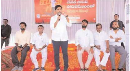
తల్లి చెల్లిన లోడ్లు మీదకి గెంపేసిన జగన్. తల్లి లాంటి కడప జిల్లాకు కూడా తీరని అన్యాయం చేశాడని తెలుగుదేశం పార్టీ జాతీయ ప్రధాన