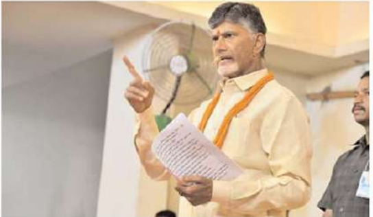
చంద్రబాబు తన విజన్ కో మరణశాసనం రాసిసంపూర్ణం. ప్రధానంగా ఏ రాజకీయ పార్టీకి అయినా యువత, మహిళ, రైతు విభాగాలు ప్రాణప్రదమైనవి. ఈ మూడు విభాగాల పైనే రాజకీయ పార్టీల భవిష్యత్తు ఆధారపడి

ప్రజానీకం హృదయాలపై మందువేసవిలో విరుజల్లులు కురిపించినట్లయింది. సామాన్య మధ్యతరగతి, పేద, బడుగు బలహీన వర్గాలకు ఎంతో ఊరటనిచ్చే టిడిపి వాగ్దానాలు అధికార పార్టీ శిబిరంలో మృత్యుఘంటికలు మోగించాయి. ఇప్పటికే సరిదిద్దుకోలేనంత ప్రజావ్యతిరేకతతో అంపశయ్యై వున్న అధికార పార్టీకి