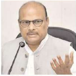
మాజీ మంత్రి యనమల రామకృష్ణుడు

దోపిడి పాలనలో పాలనలో అనునిత్యం దాడులు, దౌర్జన్యాలు, హత్యలకు గురవుతూ, సంక్షేమ పథకాల్లో కోతలతో అన్యాయానికి గురవుతున్న జీవీలను రక్షించుకోవడం లక్ష్యంగా జీవీలకు రక్షణ చట్టానికి రూపకల్పన చేశారు. జీవీలకు సంక్షేమ పథకాల్లో ఎలాంటి అన్యాయం జరగకుండా రక్షణ చట్టంతో కాపాడుతాం. పట్టణంగా సరి పోయిన నిధుల ఖర్చు చేయడం ద్వారా జీవీల అభివృద్ధికి రక్షణ కల్పించడమే తెలుగుదేశం పార్టీ ధ్యేయం. తెలుగుదేశం పార్టీ ప్రకటించిన మేనిఫెస్టో హాసీ జగన్ రెడ్డి ముఠాకు ముచ్చేమలు పడుతున్నాయి. జగన్ రెడ్డి దుష్టపాలనను ఘోషాపిఠకం చేసింది కూడా ఈ మేనిఫెస్టో. జగన్ రెడ్డి మాయ మాటలతో నవమోసాలకు గురైన ప్రతి వ్యక్తికీ స్వేచ్ఛ కలిగిస్తాం. అమ్మడికి రూ.13వేలు ఇచ్చి, నాన్నబుడ్డిలో రూ.70వేలు కొట్టేశారు. డ్రెవర్లకు రూ.10వేలు ఇచ్చి డీజిల్, పెట్రోల్, పోలీస్, ఆర్డీఓ జరిమానాలు పెంచి, మద్యం రేట్లు, కరెంటు ఛార్జీలు