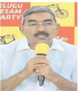
మాజీ మంత్రి ఆలవాలి రాజేంద్రప్రసాద్