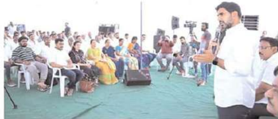
రిజర్వేషన్లు ఇచ్చాం. జగన్ వచ్చిన వెంటనే కాపులకు ఇచ్చిన

జగన్ పాలనలో బలిజలు బాధితులుగా మారారు, కన పిల్లలు విదేశాల్లో చనిపోతే చాలు, పేద విద్యార్థులు విదేశాల్లో వదవకూడదు అనే దుర్మార్గుత్వం అలోచనలో జగన్ విదేశీ విద్య పథకం రద్దు చేశారని టీడీపీ యువనేత నారా లోకేష్ పేర్కొన్నారు. దొర్లపాడు క్యాంప సైట్ వద్ద బలిజ సామాజికవర్గం ప్రతినిధులతో ముఖాముఖ కార్యక్రమంలో లోకేష్ పాల్గొన్నారు. ఈ సందర్భంగా లోకేష్ మాట్లాడుతూ... విద్యా ఉద్యోగాల కల్పనలో రిజర్వేషన్లు కల్పిస్తామన్న హామీ మేరకు గతంలో 5శాతం