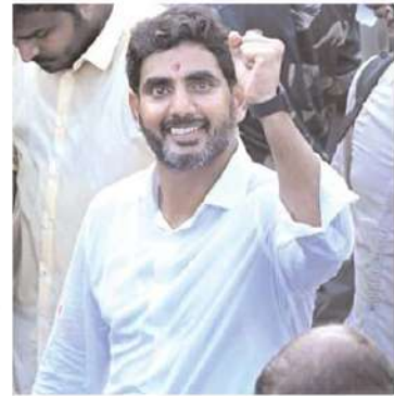
అసెంబ్లీ నియోజకవర్గాల్లోనూ మినీ మహానాడు లు పెద్ద ఎత్తున నిర్వహించారు. ప్రధానంగా

గతంలో ఎన్నడూ లేనివిధంగా తెలుగు రాష్ట్రాలతో పాటు దేశ విదేశాలలో ఘనంగా నిర్వహిస్తున్నారు. ఖండాంతరాలు లోని 50 దేశాలు, ప్రాంతాలలో నభూతో నభవిష్కృతి అన్న రీతిలో ఎన్టీఆర్ శతజయంతి వేడుకలు, మినీ మహానాడులు నిర్వహించారు. బెంగళూరు, హైదరాబాద్, అందమాన్ నుకోబర్ వంటి ప్రాంతాలలోనూ ఘనంగా వేడుకలు జరిగాయి. తెలంగాణ, ఆంధ్రప్రదేశ్ రాష్ట్రాలలో దాదాపు అన్ని