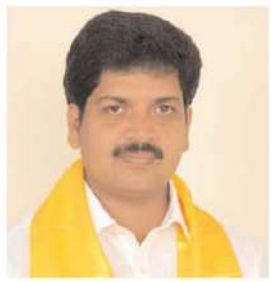
మాజీ మంత్రి కొల్లు రవీంద్ర

పదవికోసం బందర్ పోర్టుని అమ్మేసింది నిజంకాదా? ఇలాంటి దొంగ లంకా పోర్టు కడతాదా? డి.పీ.ఆర్ బయటపడితే ప్రజలకు పోర్టునిర్మాణం లోని వాస్తవాలు తెలుస్తాయి. పోర్టులోకి నౌక రావాలంటే ఎంతలోతు డ్రెడ్జింగ్ చేయాలి. తక్కువలో తక్కువగా 15, 16 మీటర్ల లోతుతప్పాలి. ఒక మీటర్ కి 800మీటర్ల డ్రెడ్జింగ్ చేయాలి. గతంలో ప్రేక్ వాటర్ కింద విస్తీర్ణం 2.5కిలో మీటర్లు ఉంటే, నేడుదాన్ని కేవలం 1.05కిలోమీటర్లకే పరిమితం చేశారు. దానిలోకి పెద్దపెద్ద నౌకలువస్తాయా? అట్టబొమ్మలు తీసుకోచ్చి, పెడతారా జగన్ రెడ్డి అని ప్రశ్నించారు. పోర్టు నిర్మాణంలో అనుభవంలేని సంస్థకు పనులు అప్పగించడం పోర్టు పూర్తి చేయడాని కేనా? నిర్మాణపనుల్ని అప్పగించిన మోసంస్థకు పోర్టులు నిర్మించిన అనుభవంలేదు. కేవలం కమిషన్ కోసమే ముఖ్యమంత్రి బందర్ పోర్టు జపంమొదలెట్టారు. రాజశేఖర్ రెడ్డిహయాంలో 6,220 ఎకరాల్లో నిర్మిస్తామంటే, కిరణ్ కుమార్ రెడ్డి వచ్చాక 5,400ఎకరాల్లో అన్నాడు. అంత విస్తీర్ణం ఇప్పుడు జగన్ వచ్చాక కేవలం 1800 ఎకరాలకే పరిమితం కావడం ఏమిటి? భావన పాడు, మచిలీ పట్నం, గంగవరం పోర్టుల్ని ప్రజల ఆకాంక్షలకు అనుగుణంగా నిర్మించేది టీడీ పీ ప్రభుత్వమే. అందులో ఎలాంటి సందేహంలేదని స్పష్టంచేస్తున్నాం. ఫిలింగ్ హార్బర్ల కట్టే మత్స్యకారుల్ని ఉద్ధరించానన్నట్టు జగన్ రెడ్డి మాట్లాడటం సిగ్గుచేటు. పడవలు, వలలు, డిజల్ రాయితి, కోర్ట్ స్ట్రోచ్ లు లేకుండా మత్స్యకారులు ఎలా బాగుపడతారో ముఖ్యమంత్రి సమాధానం చెప్పాలి. తాను నిర్మిస్తాను అంటున్న ఫిలింగ్ హార్బర్లతో ఎందరు మత్స్యకారులు జీవితాలు బాగుపడతాయో జగన్ చెప్పాలి. డీజల్ ధర ఎంతఉంటే, జగన్ ఎంతరాయితి ఇస్తున్నాడు? పేదలకు ఇచ్చే ఇంటిపట్టణాలు, ఇంటిస్థలాలు ఎందుకుపనికిరావని