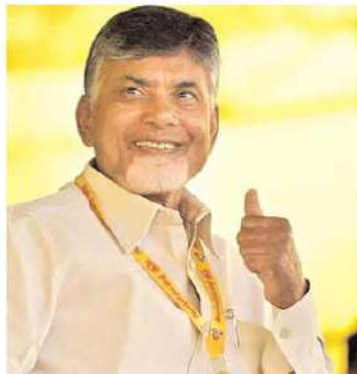
తెలుగుదేశం పార్టీ వ్యవస్థాపకుడు నందమూరి తారకరామారావు శతజయంతి ఉత్సవాలను

ఎన్టీఆర్ శతజయంతిలో సూతనోత్సాహం దేశ విదేశాలలో ఎన్టీఆర్ శతజయంతి ఉత్సవాలు కేడర్ లో పెరిగిన కసి, పట్టుదల చంద్రబాబు నాయకత్వం, లోకేష్ సారథ్యంతో టీడీపీకి కొత్త శక్తి మరో 4 దశాబ్దాల పాటు టీడీపీ అజేయ శక్తిగా వుండేలా ప్రణాళిక