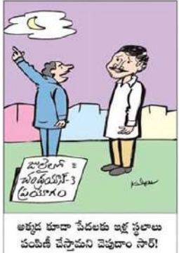
అత్యధిక కూడా పేదలకు ఇళ్ల స్థలాలు కంటికి చేర్చమని చెప్పడాం సాధి!

జగన్ పై సినీమా తీయాల్సి వస్తే 'అవినీతి రత్న' అని పెట్టి తీస్తే బాగుంటుంది: పంచుమర్రి అనురాధ సంపాదకీయం పేజీలో..