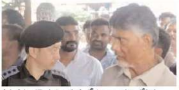
సమర్థవంతమైన పాలన సంక్షేమం అభివృద్ధి చేసిన ఘనత దీడిపిదే అని ఆన్నారు