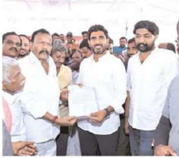
సామాజికంగా వెనుకబడిన వడ్డెర్లను ఎస్టీ జాతిలో చేర్చాలి. వడ్డెర్ల విద్యార్థులకు ఉచిత విద్యనందించాలి. వడ్డెర్లకు ప్రమాద జీమా కూడా లేదు. జమా సాకర్యం