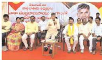
చంద్రబాబు మాట్లాడుతూ 1983లో ఎస్సీ రామారావు పక్కా ఇళ్ల నిర్మాణాలను ప్రారంభించారన్నారు. పేదవాడి సొంతింటి కల నిజం

టిడ్కో ఇల్లు మీ ఆస్తి. వదలిపెట్టొద్దు అని తెలుగుదేశం పార్టీ ఆధినేత నారా చంద్రబాబు నాయుడు సూచించారు. ఇదేం ఖర్చు మన రాష్ట్రానికి కార్యక్రమంలో భాగంగా గురువారం పెంచుల్లో ఆసెంజి నియోజకవర్గంలోని టిడ్కో ఇళ్ల లబ్ధిదారులతో చంద్రబాబు సమావేశం అయ్యారు. తెలుగు దేశం హయాంలో సకల వసతులతో నిర్మించిన ఇళ్లను ఇప్పటికీ కమకు కేటాయింపకపోవడంపై లబ్ధిదారులు చంద్రబాబు ఎదుట ఆవేదన వ్యక్తం చేశారు. వారినుద్దేశించి