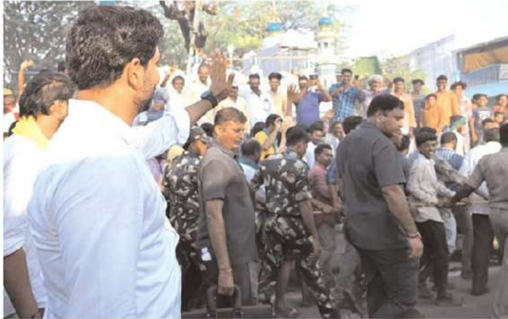
కొనసాగింది. ఇప్పటివరకు మొత్తం 1319.1 కి.మీ.ల పాదయాత్ర పూర్తయింది.

యువనేత నారా లోకేష్ చేపట్టిన యువగళం పాదయాత్ర 103వరోజు నంద్యాల ఆసెంజ్ల నియోజకవర్గ పరిధిలో ఉత్సాహంగా సాగింది. పాదయాత్ర 1300 కి.మీ. మైలులయిన అభిగమించిన సందర్భంగా నంద్యాల యాతం ఫంక్షన్ హాలు సమీపాన లోకేష్ శిలాఫలకాన్ని ఆవిష్కరించారు. టీడీపీ అభివృద్ధిలోకి వచ్చాక నంద్యాల రూరల్ కానాలలో పసుపు మార్కెట్, కోల్డ్ స్టోరేజి ఏర్పాటుకు యువనేత లోకేష్ హామీ ఇచ్చారు. 50 రోజులుగా కుడిభుజిపాస్ పోస్ట్ బాధపడుతున్నప్పటికీ యువనేత లోకేష్ మొక్కలనే పట్టడంతో పాదయాత్ర కొనసాగిస్తున్నారు. గురువారం డాక్టర్ల సూచనమేరకు నంద్యాల పద్మావతిగర్ లో మ్యాగ్నెటిక్ రిసోనెన్స్ టెస్ట్ లో నారా లోకేష్ కుడి భుజానికి ఏంజర్లు స్పానింగ్ చేయించారు. పాదయాత్ర ఉమ్మడి ఆనంతపురం జిల్లా