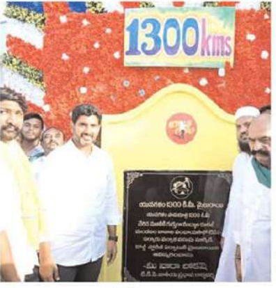
1300 కిలోమీటర్లు పూర్తి పసుపు మార్కెట్, కోల్డ్ స్టోరేజీ ఏర్పాటుకు హామీ నంద్యాల రూరల్ మండలం కానాలలో శిలాఫలకం ఆవిష్కరణ

తెలుగుదేశం పార్టీ జాతీయ ప్రధాన కార్యదర్శి నారా లోకేష్ చేపట్టిన యువగళం పాదయాత్ర గురువారం మరో మజిలీ చేరుకుంది. పాదయాత్ర 103 వ రోజున 1300 కిలోమీటర్లు పూర్తి చేసుకుంది. ప్రతి వంద కిలోమీటర్ల కు ఒక నిర్దిష్ట హామీ ఇస్తూ అందుకు గుర్తుగా శిలాఫలకం ఆవిష్కరిస్తున్న విషయం తెలిసినది. లోకేష్ 1300 కిలోమీటర్ల పాదయాత్ర పూర్తి అయిన సందర్భంగా మరోక హామీ ఇచ్చారు. దీదీపి ప్రభుత్వం రాగానే ఆ ప్రాంతంలో పసుపు మార్కెట్, కోల్డ్ స్టోరేజీ ఏర్పాటు చేయమన్నట్లు వెల్లడించారు. అందుకు గుర్తుగా నంద్యాల రూరల్ మండలం కానాల పంచాయతీలో శిలాఫలకం ఆవిష్కరించారు.