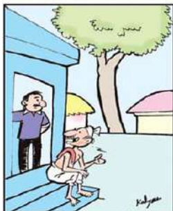
మీ సొంత తరగతినే ధాత్యం కొరతలేదు గానీ, నాకు సాతీ చెప్పవచ్చానని చెప్పా!

ఆర్థిక పరిస్థితిపై శ్వేత పత్రం విడుదల చేయాల్సి: ఆలపాటి సంపాదకీయం పేజిలో..