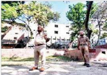
వంజావ్ పోలీస్ డివీజన్ తెలిపారు. ఫోరెన్సిక్ బృందం సంఘటనా స్థలానికి చేరుకుంది. మొత్తం ఆ ప్రాంతాన్ని అదుపులోకి తీసుకుంది.

గోల్డెన్ టెంపుల్ సమీపంలో వారంలో మూడోసారి పేలుడు ఘటనలో ఐదుగురిని అరెస్టు చేశారు. బుధవారం రాత్రి ఒంటిగుంట సమయంలో గురు రాందాస్ నివాసి భవనం సమీక పేలుడు సంభవించింది. ఇక్కడి గోల్డెన్ టెంపుల్ సమీపంలో ఆధారాత్రి తక్కువ తీవ్రతతో పేలుడు సంభవించింది. ఒక వారంలో ఇది మూడో సంఘటనని పోలీసులు గురువారం తెలిపారు. ఈ వారంలో జరిగిన పేలుళ్లకు సంబంధించి ఐదుగురిని అరెస్టు చేసినట్లు