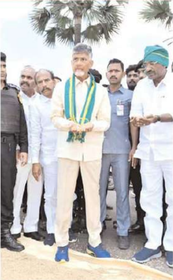
చంద్రబాబు, లోకేష్ ల సంకల్ప బలమే ఈ రాష్ట్రాన్ని గాడిలో పెట్టేందుకు దోహదపడుతుంది అనటంలో సందేహం లేదు.

ఒకరుగా కలిసి పోయారు. కుల,మత, వర్ణ, వయో, లింగ భేదాలు కో నిమిత్తం లేకుండా లోకేష్ అందరి వారయ్యారు. ప్రజా సమస్యల పరిష్కారంపై అక్కడికక్కడే నిర్దిష్ట హామీలు ఇస్తూ ముందుకు సాగుతున్నారు. శాశ్వత ప్రయోజనాన్ని చేకూర్చే హామీలు ఇవ్వటమే గాక, దానికి గుర్తుగా శిరాఫలకాలు సైతం అవిప్పలిస్తూ సరికొత్త ఒరవడికి శ్రీకారం చుట్టారు. దీంతో పాటు ప్రతి నియోజకవర్గంలోనూ అక్కడి నాయకుల అవినీతి బాగోతాన్ని ఎండగడతూ ఆధారాలు సైతం బహిర్గతం చేస్తున్నారు. దమ్ముంటే చర్చకు రావాలి అంటూ సవాళ్లు విసురుతున్నారు. లోకేష్ సవాళ్లకు జవాబు చెప్పే పరిస్థితి లేకపోవటంతో అవినీతి తిమింగలాలు కిమ్మనకుండా దాటవేత దోరణి అవలంబిస్తున్నాయి. అంతేకాక టిడిపి అధికారంలో వున్నప్పుడు చేసిన అభివృద్ధిని ప్రతి బోటా చూపుతూ, అటువంటి పని మీరేదైనా చేశారా? అంటూ పాలకపక్షానికి పెట్టి, ఛాలెంజ్ లను విసురుతున్నారు. లోకేష్ సెట్టి ఛాలెంజ్ లను చంద్రబాబుతో సహా రాష్ట్రవాస్త్రంగా టిడిపి శ్రేణులు ఆదర్శంగా తీసుకొని ప్రభుత్వానికి సవాళ్లు విసరవారంఅంచాయి. చంద్రబాబు, లోకేష్ లు ఎక్కడకు వెళ్ళినా జనసహామీ సే కానవస్తున్నది. తమను కష్టాల కడలి నుంచి బయట పడవేయగలరన్న నమ్మకం సామాన్య ప్రజానీకంలో రోజురోజుకూ ప్రబలుతోంది.