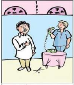
చెచ్చెళ్లక భరోసా అని ఇచ్చాలి యాడ్స్ ఇచ్చారా? మీ స్వంత చెచ్చెలట గుర్తున్నానా అని ధోను!

దళతుల్ని పాంసించిన వారే జగన్ కు ప్రీతిపాతులు: మహాసేన రాజేష్