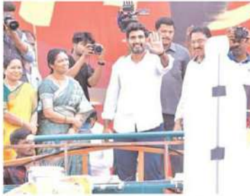
ఎరువుల ధరలు విపరీతంగా పెరిగాయి. కర్రీ విత్తనాలు, పురుగు మందులతో రైతులు తీవ్రంగా నష్టపోతున్నారు. ఇసుక ధరలు పెంచడంతో ఇంట్లో కట్టుకోలేకపోతున్నారు. విద్యార్థులకు ఫీజులు విపరీతంగా పెరిగాయి. చదువుకున్న వారికి ఉద్యోగాలు లేవు. మీరు అధికారంలోకి వచ్చాక మా సమస్యల్ని పరిష్కరించాలని వారు లోకేష్ కు విజ్ఞప్తి చేశారు. వారి సమస్యలపై నారా