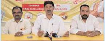
గిరిజనలంటే ప్రభుత్వానికి అంత చురుకైన అయిపోయారా?

విధానాలతో ఎక్కువ అప్పులున్న రైతు కుటుంబాల్లో ఏపీ ప్రథమ స్థానంలో ఉంది. ఏపీలో 93.2 శాతం రైతు కుటుంబాలు అప్పుల్లో కూరుకుపోయాయి. రాష్ట్రంలో ఒక్కో రైతు కుటుంబంపై సగటున రూ.2,45,554 అప్పు ఉంది. ఇప్పటికే 3వేల మంది రైతులు ఆత్మహత్యలకు పాల్పడ్డారు. రోజుకు ముగ్గురు రైతులు ఆత్మహత్య చేసుకోవడం జగన్ రెడ్డికి కనిపించడం లేదా? కాలు రైతు ఆత్మహత్యల్లో ఏపీ దేశంలోనే 2వ స్థానానికి, రైతు ఆత్మహత్యల్లో 3వ స్థానానికి నెట్టింది వాస్తవం కాదా అని ప్రశ్నించారు. చంద్రబాబు పాలనలో వ్యవసాయ రంగంలో రెండంచల పుట్టి రేటు సాధించగా నేడు వ్యవసాయం గిట్టుబాటు కాక క్రాపి హోదీలు ప్రకటిస్తున్నారు. చంద్రబాబుపై దుష్ప్రచారాన్ని ఆపి కన్నెండ్లి ఉన్న రైతులను ఆదుకోవాలన్నారు.