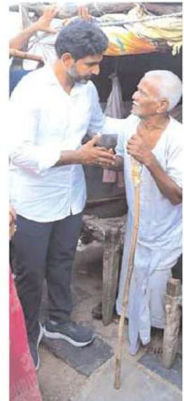
మీ మనవడిని నేను. మీ చేతి కర్రలా వుంటా..

మాత్రమే కాదు టిడిపి అధికారంలోకి వచ్చిన వెంటనే మహిళల్ని గౌరవించడం చిన్నప్పటి నుండి నేర్చిస్తాం. టిడిపి అధికారంలోకి వచ్చిన వెంటనే మహిళల గొప్పతనం, వారి కష్టం అందరికీ తెలిసేలా కేజీ నుండి బీజే పరకూ ప్రత్యేక పాఠ్యాంశాలు తీసుకొస్తామని ఆయన హామీ ఇచ్చారు. యువగళం పాదచారులలో భాగంగా గురువారం పాఠ్యాంశం నియోజకవర్గం బోల్లవరంలో మహిళలతో ముఖాముఖీ కార్యక్రమంలో లోకేష్ పాల్గొన్నారు. ఈ సందర్భంగా మహిళలు అడిగిన పలు ప్రశ్నలకు లోకేష్ సమాధానం చెప్పారు. రాష్ట్రంలో ప్రస్తుతం నెలకొన్న పరిస్థితులపై పలువురు మహిళలు లోకేష్ ఎదుట