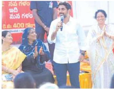
గ్రామంలో అంబేద్కర్ విగ్రహాన్ని పెట్టాలి అని వారు విజ్ఞప్తి చేశారు. వారి సమస్యలపై నారా లోకేష్ నానుకూలంగా స్పందించారు. దళితులకు గత ప్రభుత్వం అమలు చేసిన

దీడిపి అధికారంలోకి రాగానే పాణ్యం నియోజకవర్గంలో ఎస్సీ సంక్షేమ హాస్టల్ నిర్మాణానికి చర్యలు చేపడతామని తెలుగుదేశం పార్టీ జాతీయ ప్రధాన కార్యదర్శి నారా లోకేష్ హామీ ఇచ్చారు. యువగళం పాదయాత్ర సందర్భంగా గురువారం పాణ్యం నియోజకవర్గం పుసులూరు గ్రామ దళితులు యువనేతను లోకేష్ ను కలిసి సమస్యలను విన్నవించారు. గత ప్రభుత్వంలో అమలుచేసిన 27 ఎస్సీ సంక్షేమ పథకాలను జగన్ అధికారంలోకి వచ్చాక రద్దుచేశారు. ఎస్సీ యువతకు ఉద్యోగ అవకాశాలు కల్పించాలి. చట్టసభల్లో అత్యున్నత పదవులు ఇవ్వాలి. కల్లూరు మండలంలో ఎస్సీ హాస్టల్ నిర్మించాలి. పాణ్యం నియోజకవర్గంలో ఎస్సీ కమ్యూనిటీ హాల్ నిర్మించాలి. గ్రామంలో వాటర్ ట్యాంకు, ఎస్సీ కాలనీలో ప్రత్యేక వాటర్ ప్రెస్ లైన్ ఏర్పాటుచేయాలి.